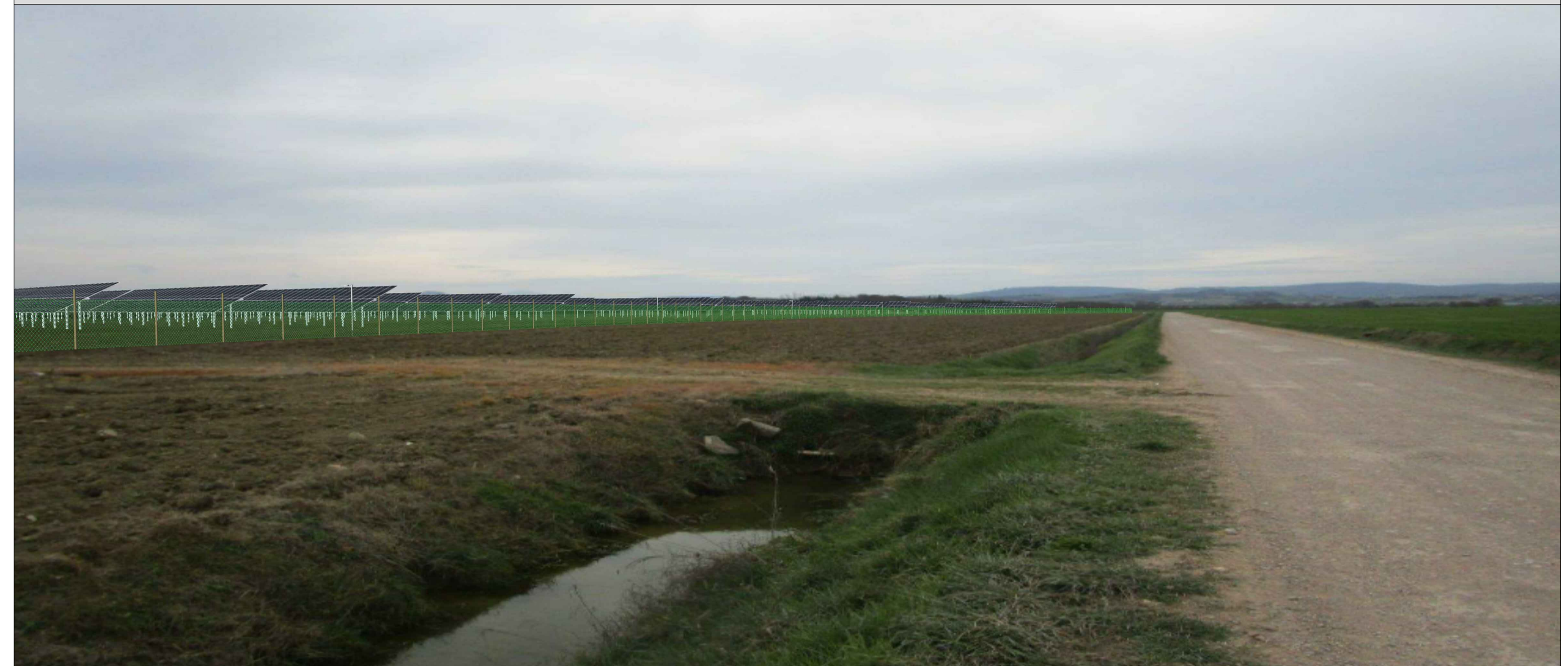
PUNTO DI SCATTO NUMERO 1 - POST OPERAM SENZA MITIGAZIONE