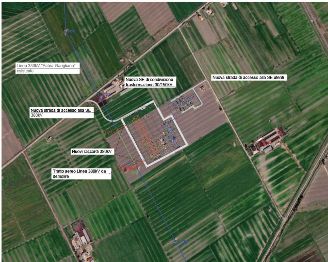
Figure 1: Ortofoto della nuova SE RTN 380/150 kV (a sinistra) e SE di condivisione/trasformazione 30/150 kV

Il comune interessato alla realizzazione della stazione elettrica è Canello ed Arnone in provincia di Caserta località Pantano.