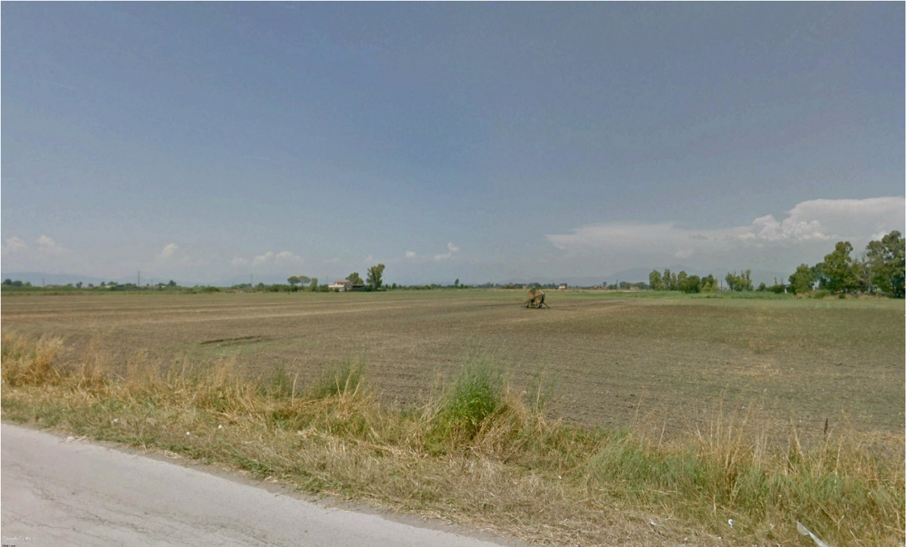
Figura 9: Sezione Vista 4- stato di fatto