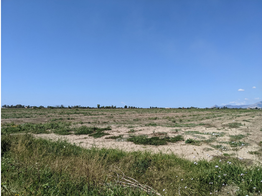
Figura 4_ Sezione Vista 2 - Stato di fatto