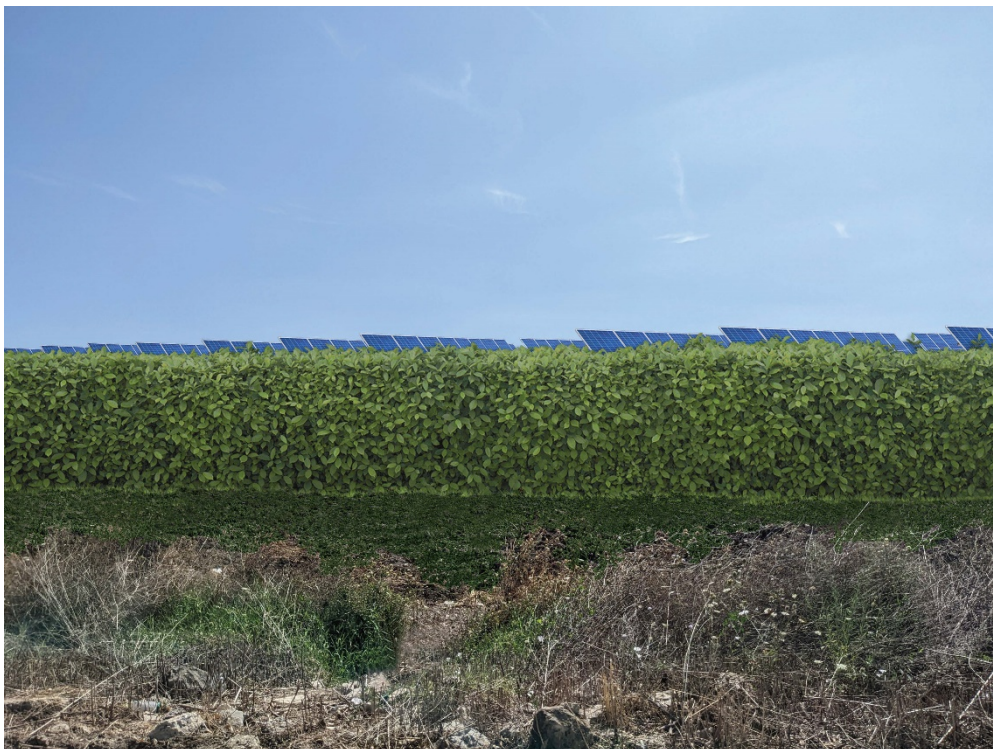
Figura 3. Sezione Vista 1 - stato di progetto