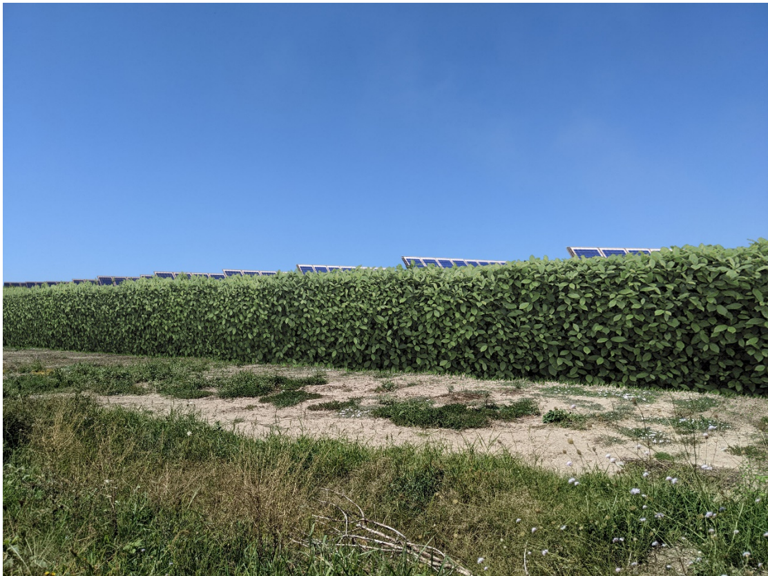
Figura 5. Sezione Vista 2 - Stato di progetto

Sede Legale: Via F. Giordani ,42 - 80122 Napoli - Tel.+39 081 060 7743 Fax +39 081 060 7876 Rea - NA1051228 – Capitale Sociale € 10.000,00 i.v. campaniasolare@starenergia.com PEC: campaniasolare@pecditta.com Cod. Univoco 5RUO82D C.F e P.IVA 09700581219