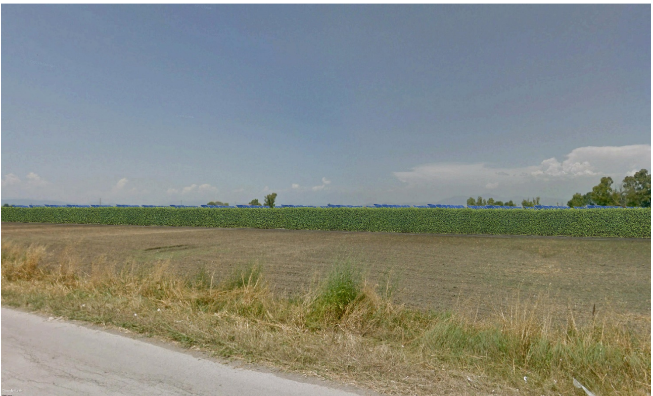
Figura 8: Sezione Vista 4 - stato di progetto

Sede Legale: Via F. Giordani ,42 - 80122 Napoli - Tel.+39 081 060 7743 Fax +39 081 060 7876 Rea - NA1051228 – Capitale Sociale € 10.000,00 i.v. campaniasolare@starenergia.com PEC: campaniasolare@pecditta.com Cod. Univoco 5RUO82D C.F e P.IVA 09700581219