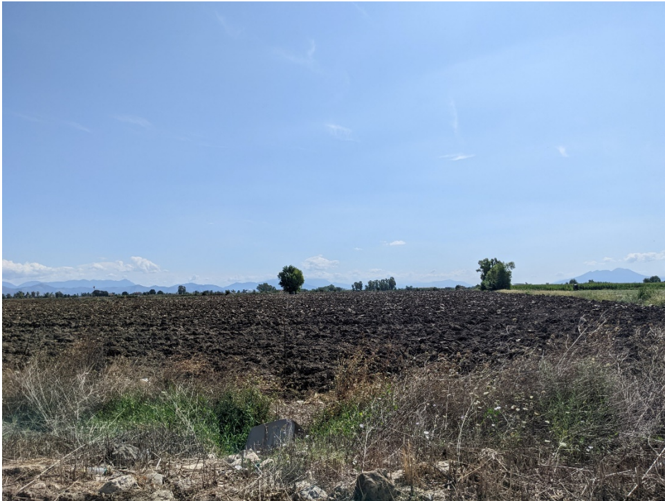
Figura 2: Sezione Vista 1 - stato di fatto