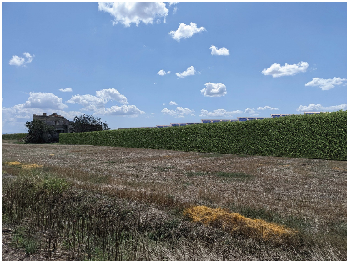
Figura 7: Sezione Vista 3 - stato di progetto