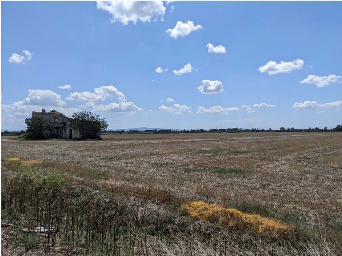
Figura 6: Sezione Vista 3 - stato di fatto