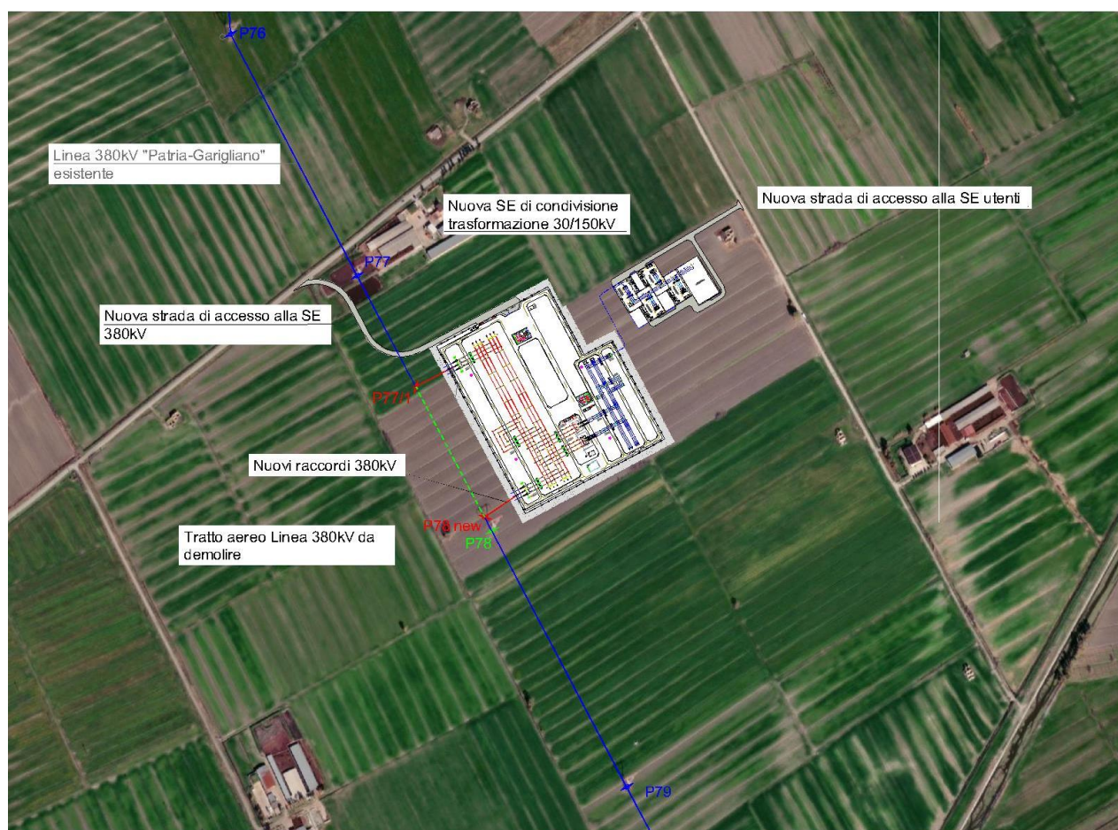
Figura 1 Ortofoto della nuova SE RTN 380/150 kV (a sinistra) e SE di condivisione/trasformazione 30/150 kV