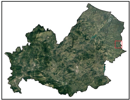
Sfondo Immagine Satellitare