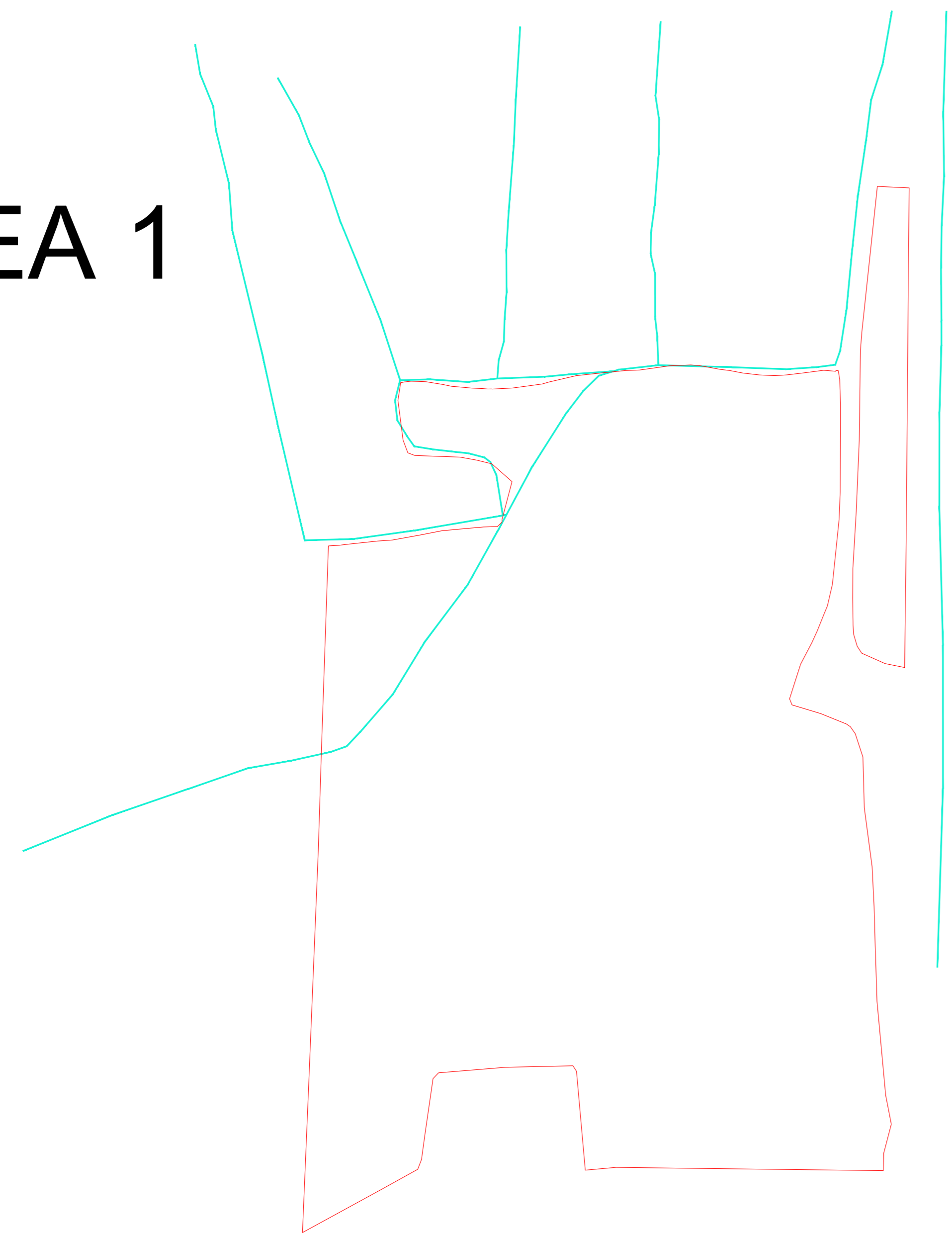
Stato di fatto impluvio