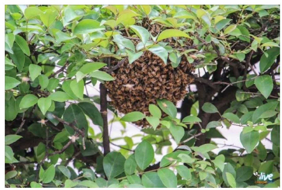
Annidamento api all'interno dell'incolto