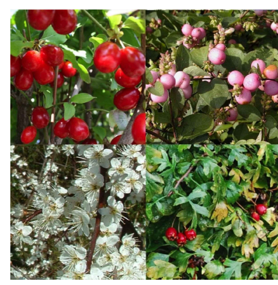
Fiori e Bacche nelle siepi