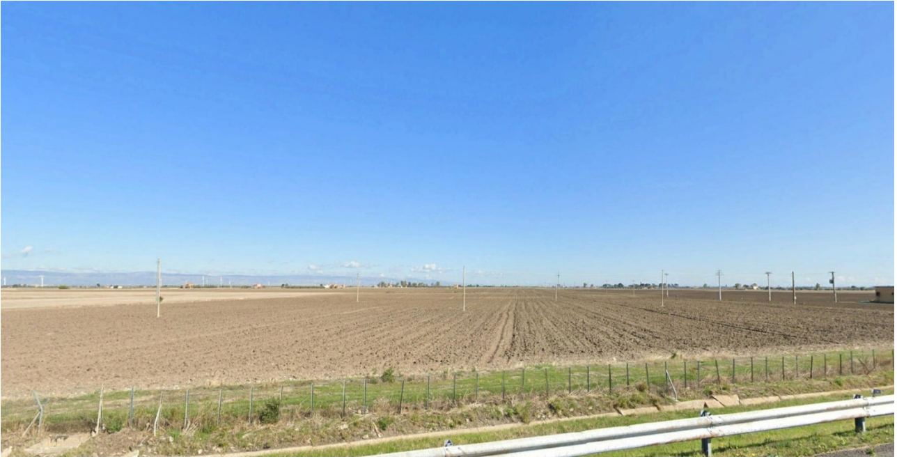
Vista 6 - Plot 4 da A14