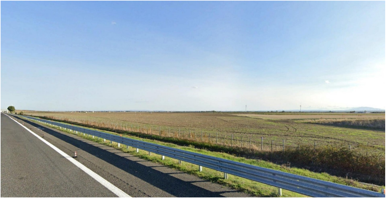
Vista 2 - plot 1 da A14