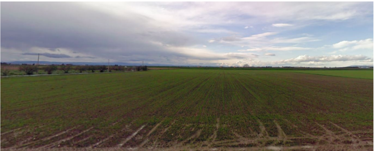
Vista 7 - Plot 3 da SP 80