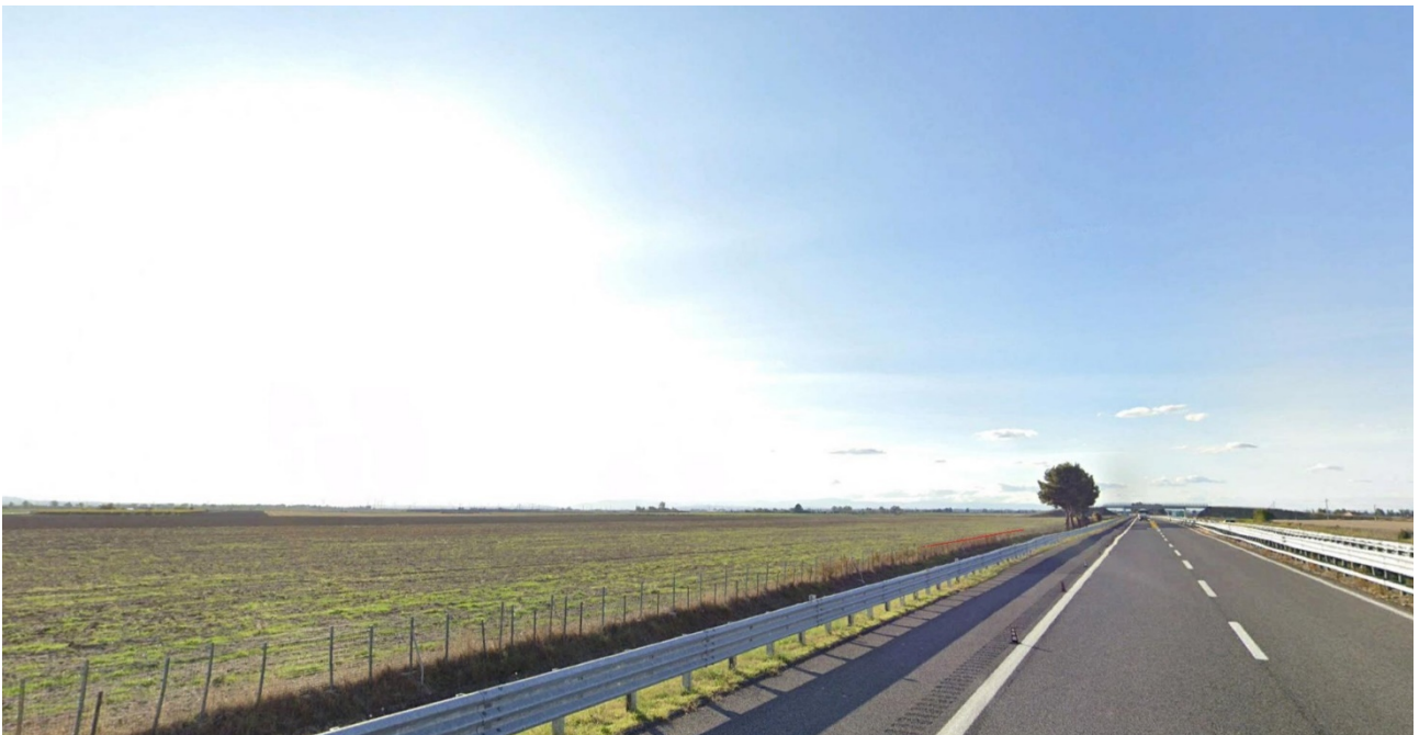
Vista 3 - plot 1 da A14