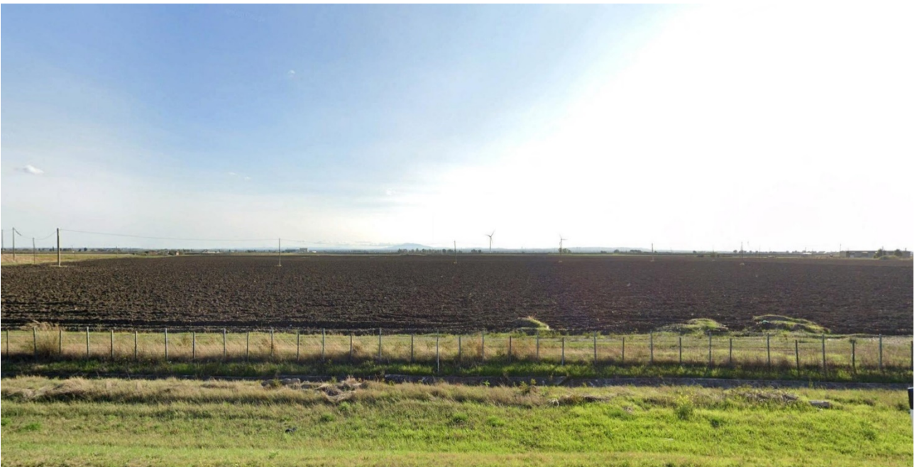
Vista 5 - plot 3 da A14