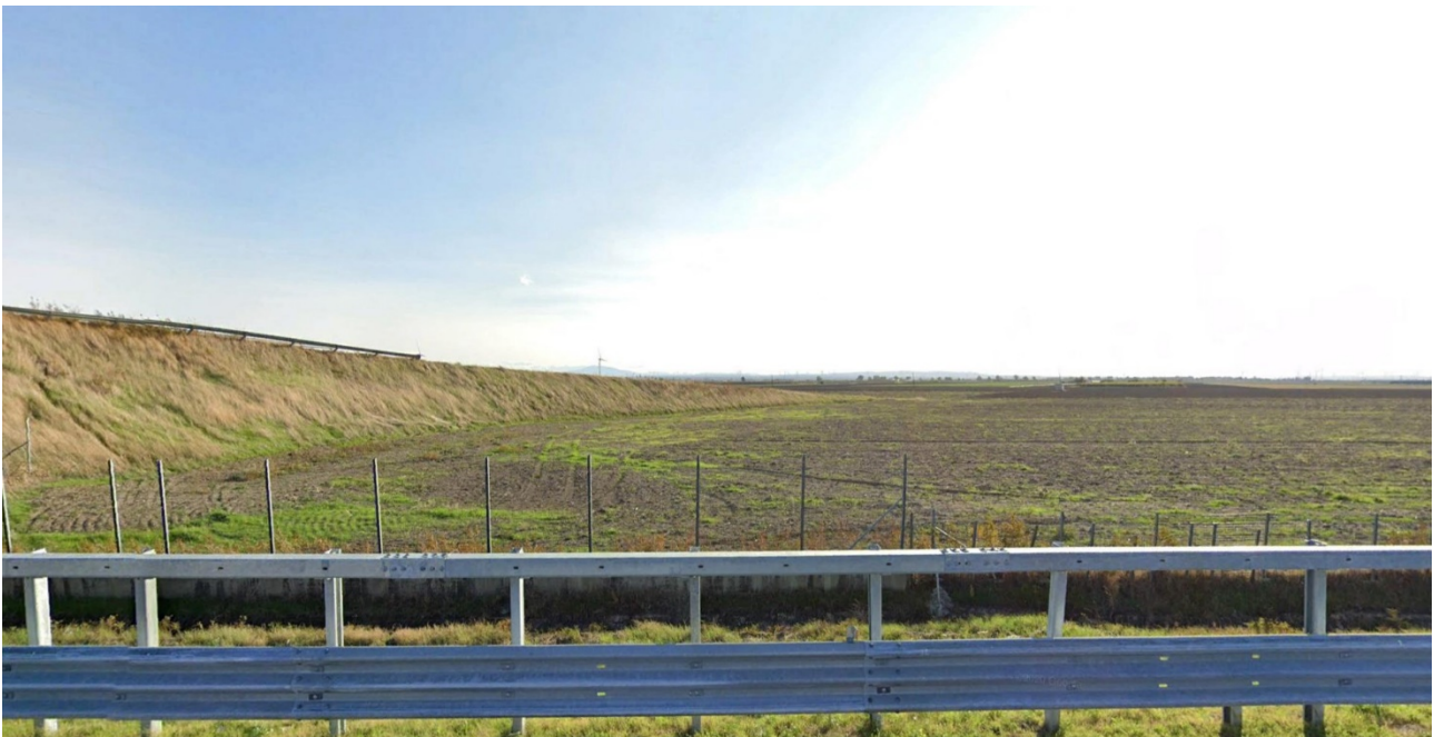
Vista 1 - plot 1 da A14