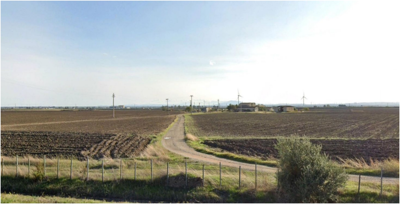
Vista 4 - plot 2 da A14