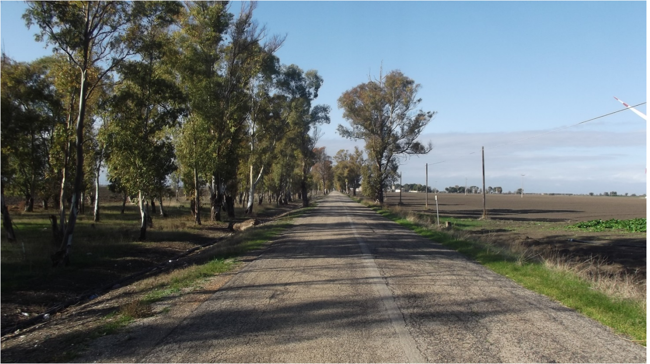
Vista 9 –Strada Provinciale n.70