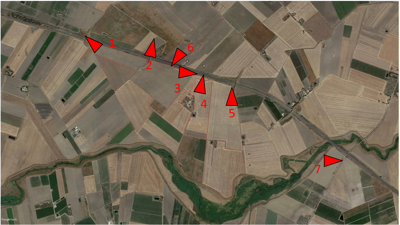
Punti di vista - inquadramento area Impianto