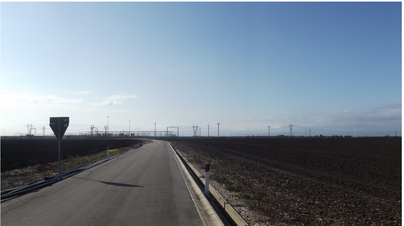
Vista 10 – area S.E. Manfredonia