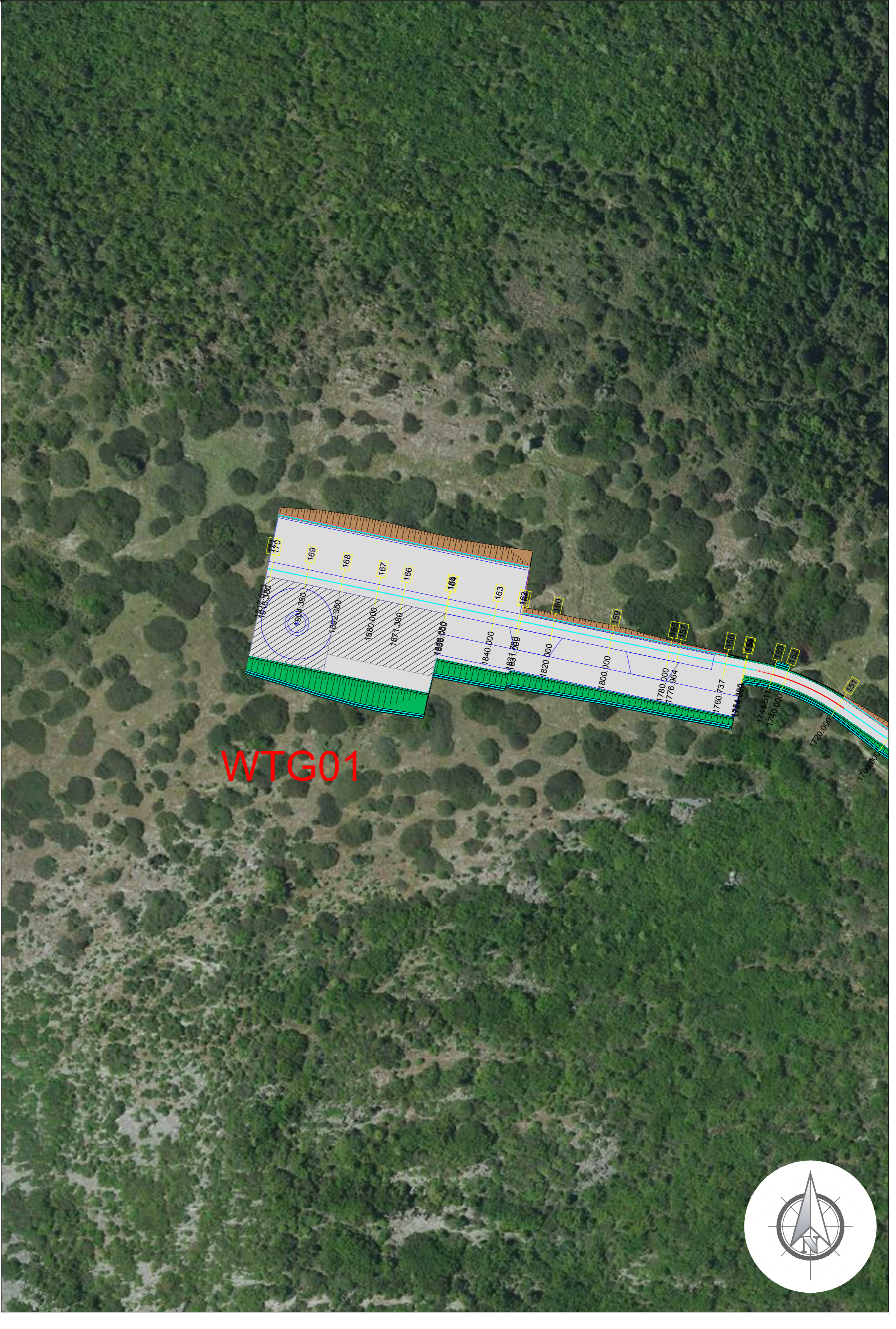
PIAZZOLA DI SERVIZIO AEROGENERATORE WTG01 Scala 1:1'000