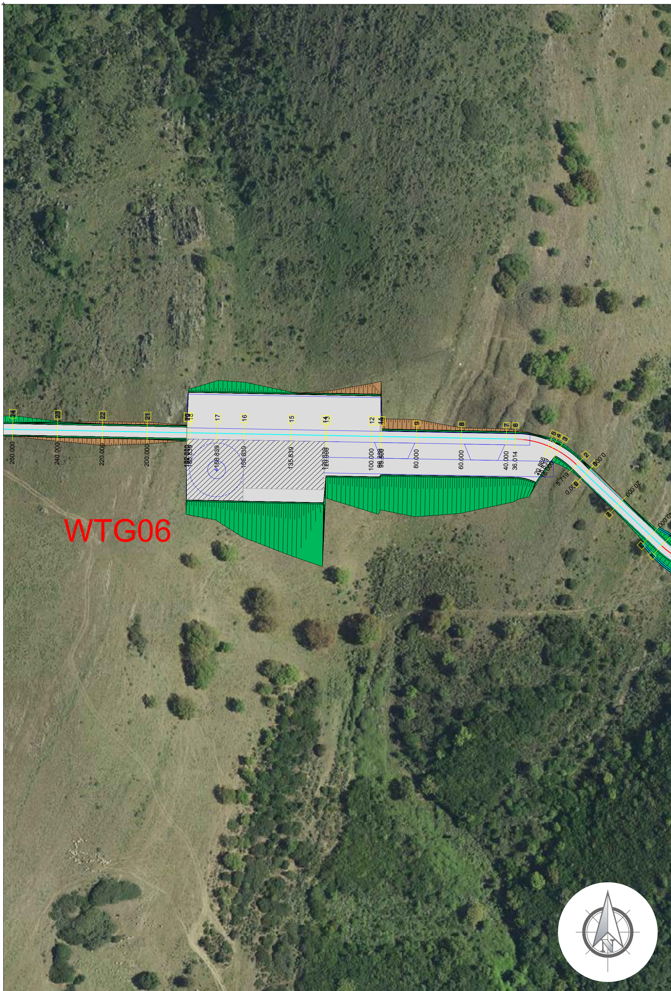
PIAZZOLA DI SERVIZIO AEROGENERATORE WTG06