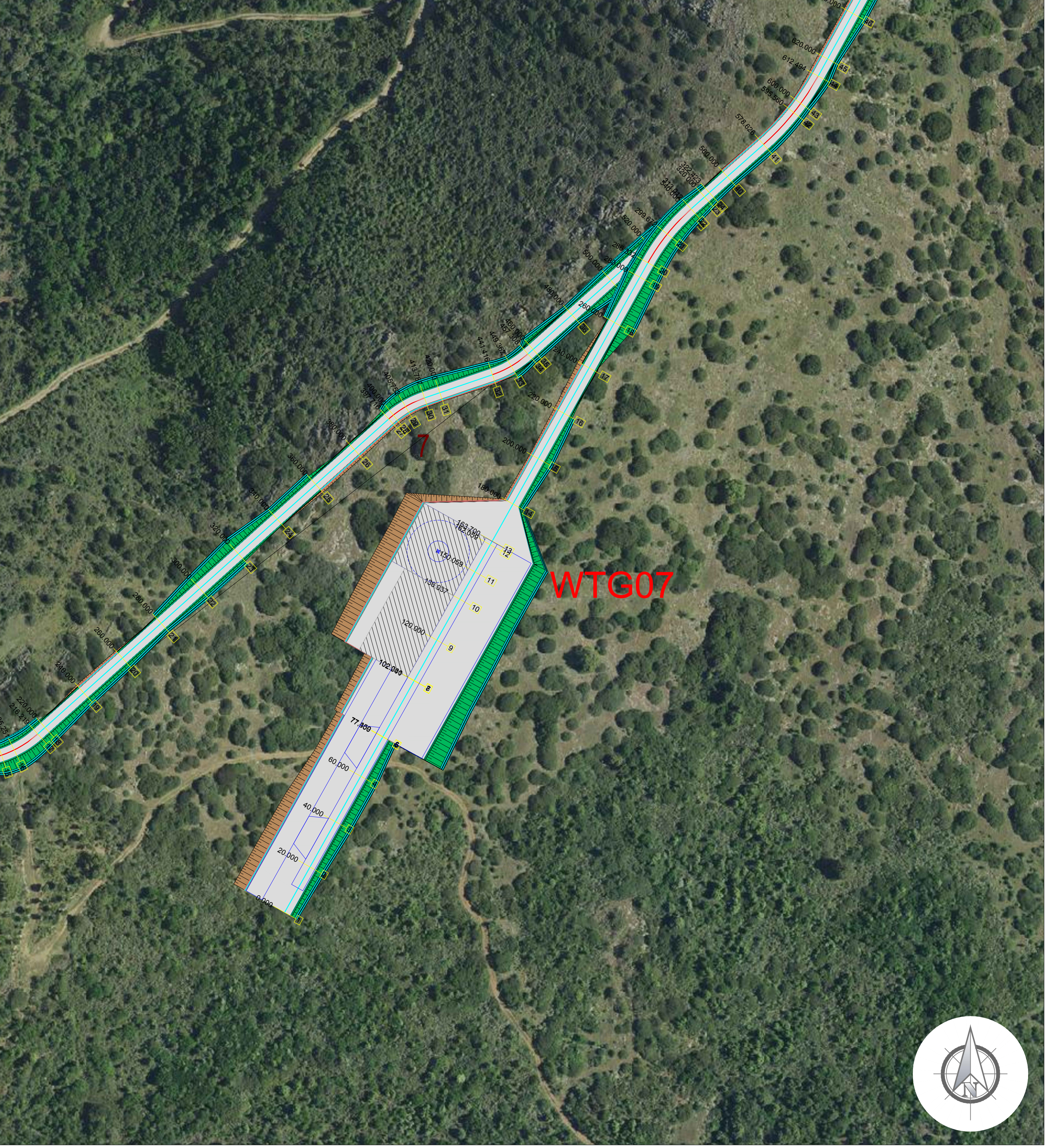
PIAZZOLA DI SERVIZIO AEROGENERATORE WTG07