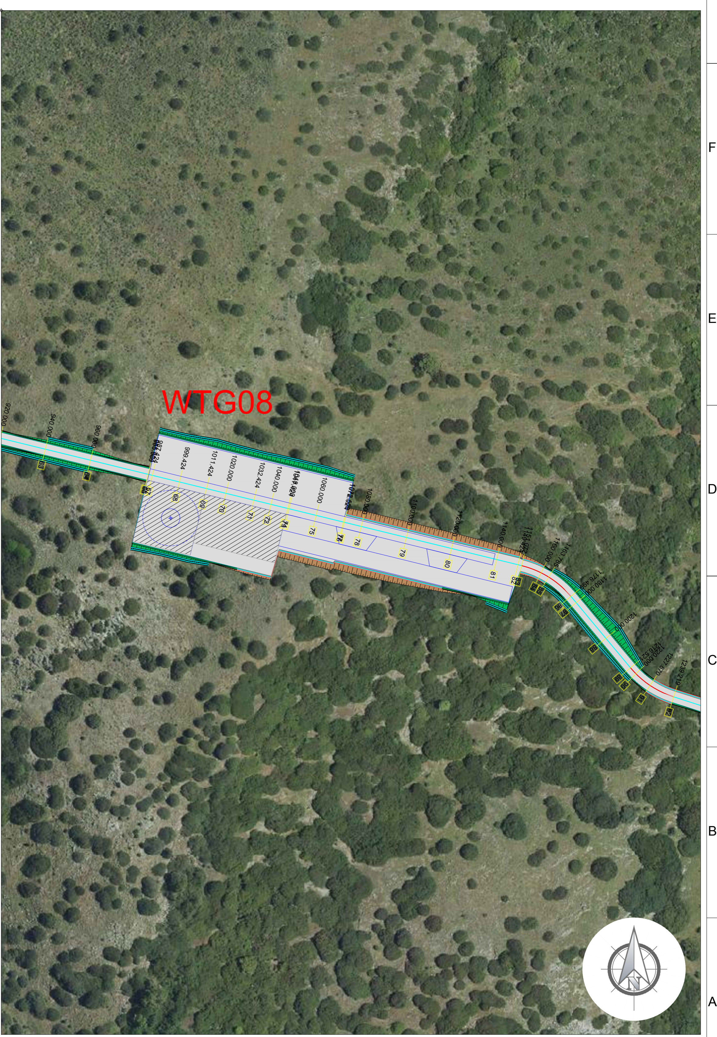
PIAZZOLA DI SERVIZIO AEROGENERATORE WTG08 Scala 1:1'000