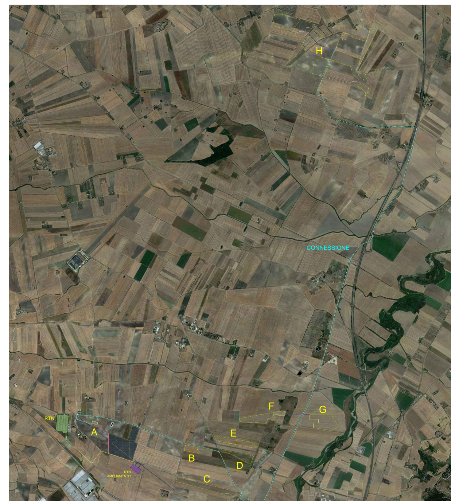
CONNESSIONE IMPIANTO - percorsi MT e AT