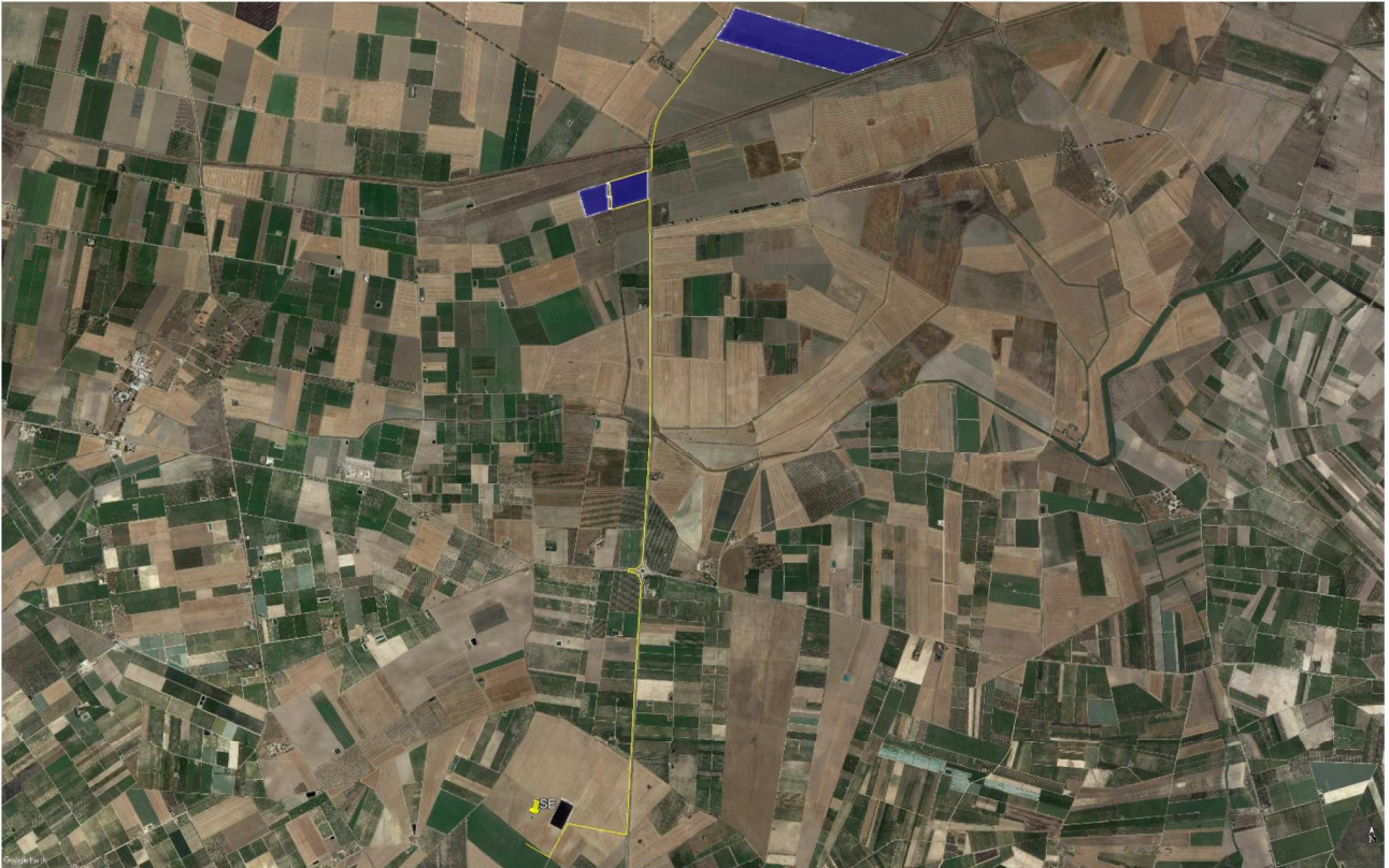
Localizzazione area di intervento, in blu la perimetrazione del sito, in giallo il tracciato della connessione

L'impianto "CER01 – Tressanti/Sette Poste" si trova in Puglia, in territorio del Comune di Cerignola (provincia di Foggia). Il terreno agricolo ricade in zona agricola E ai sensi dello strumento urbanistico vigente per il comune di Cerignola (PRG). L'area di intervento ha una estensione di circa 39 Ha e ricade in agro di Cerignola , in località "Tressanti/Sette Poste" e in adiacenza alla Strada Provinciale 77.