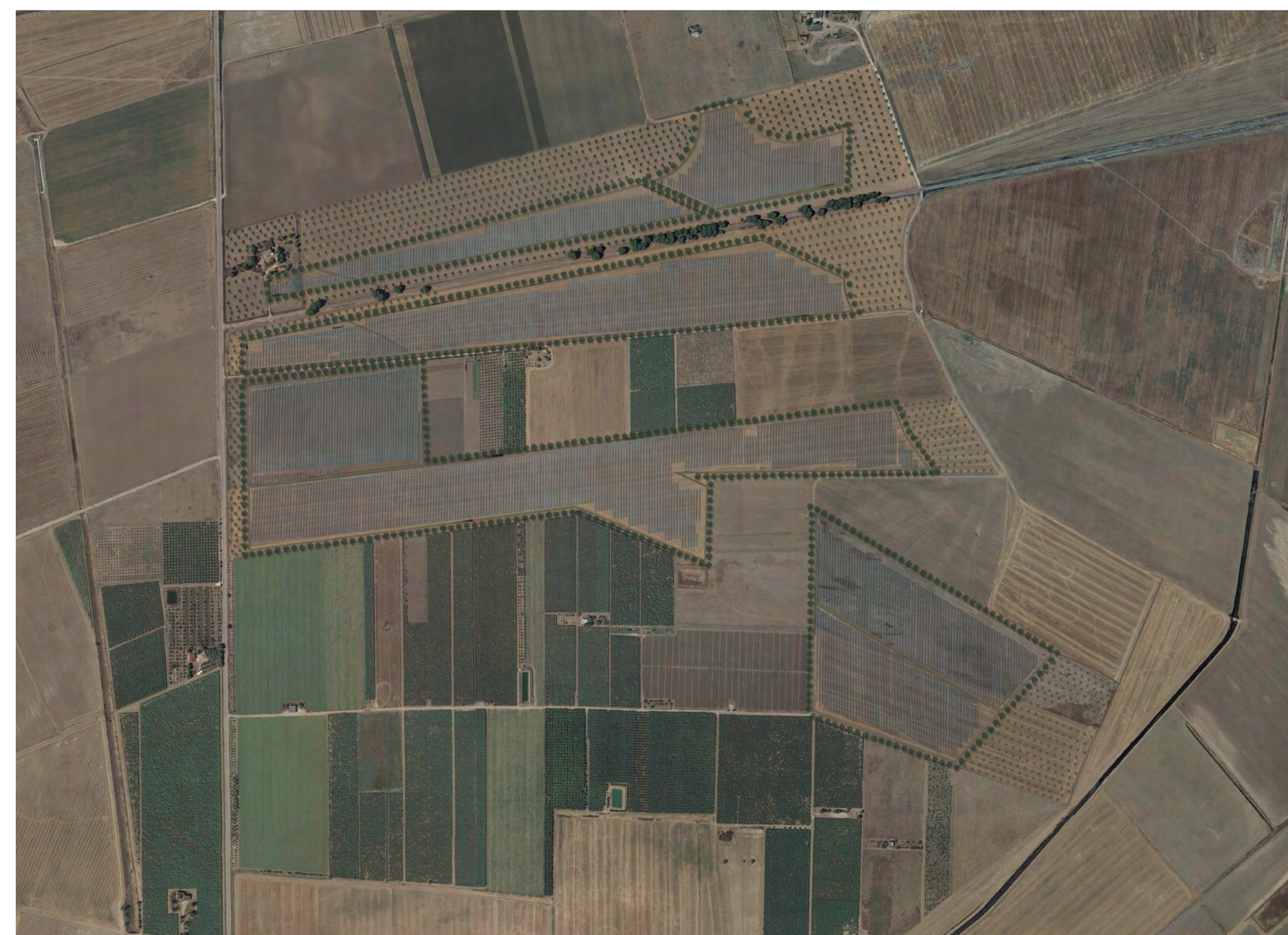
Campo B Vista aerofotogrammetrico stato di progetto