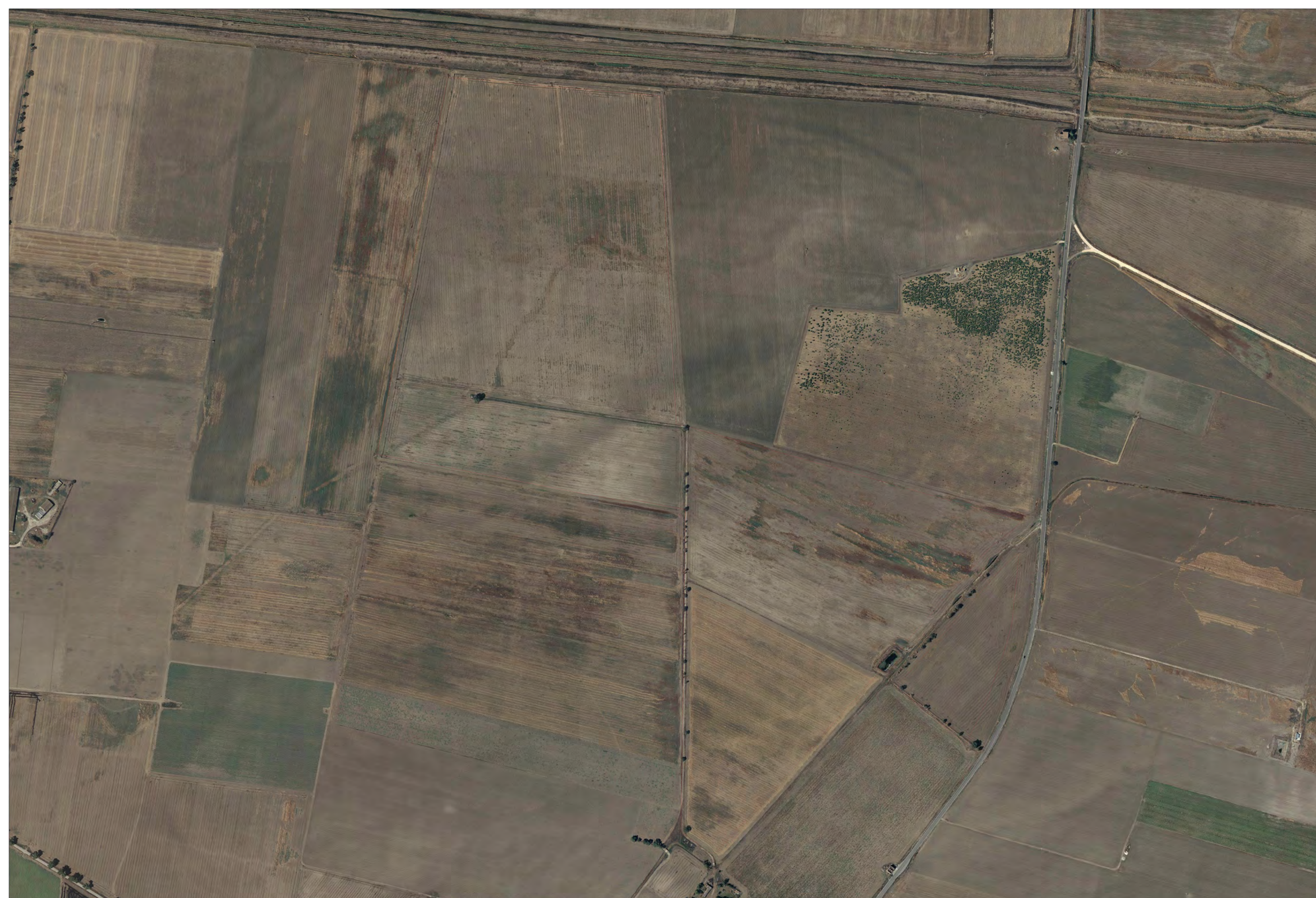
Campo A1 Vista aerofotogrammetrico stato di fatto