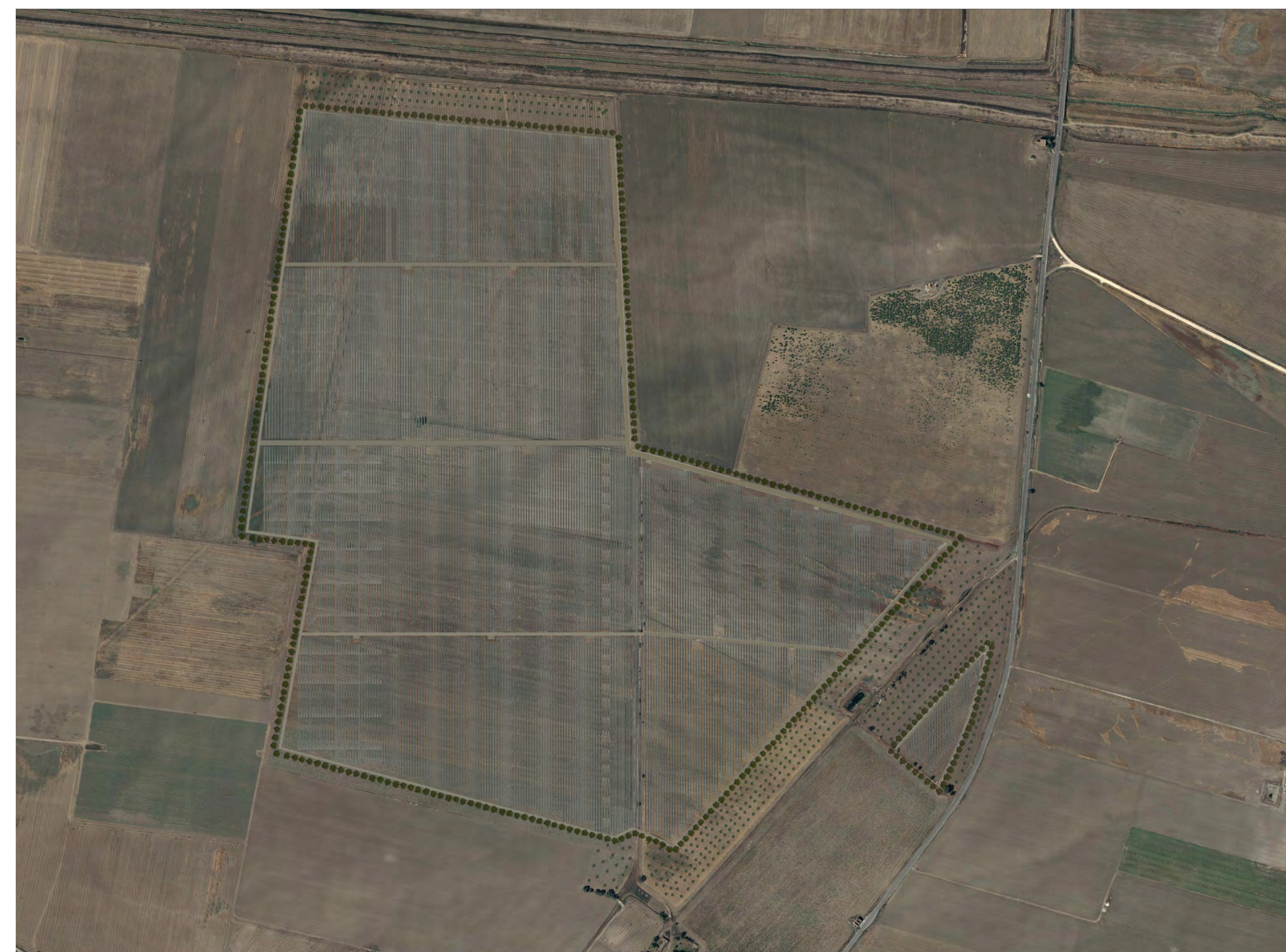
Campo A1 Vista aerofotogrammetrico stato di progetto