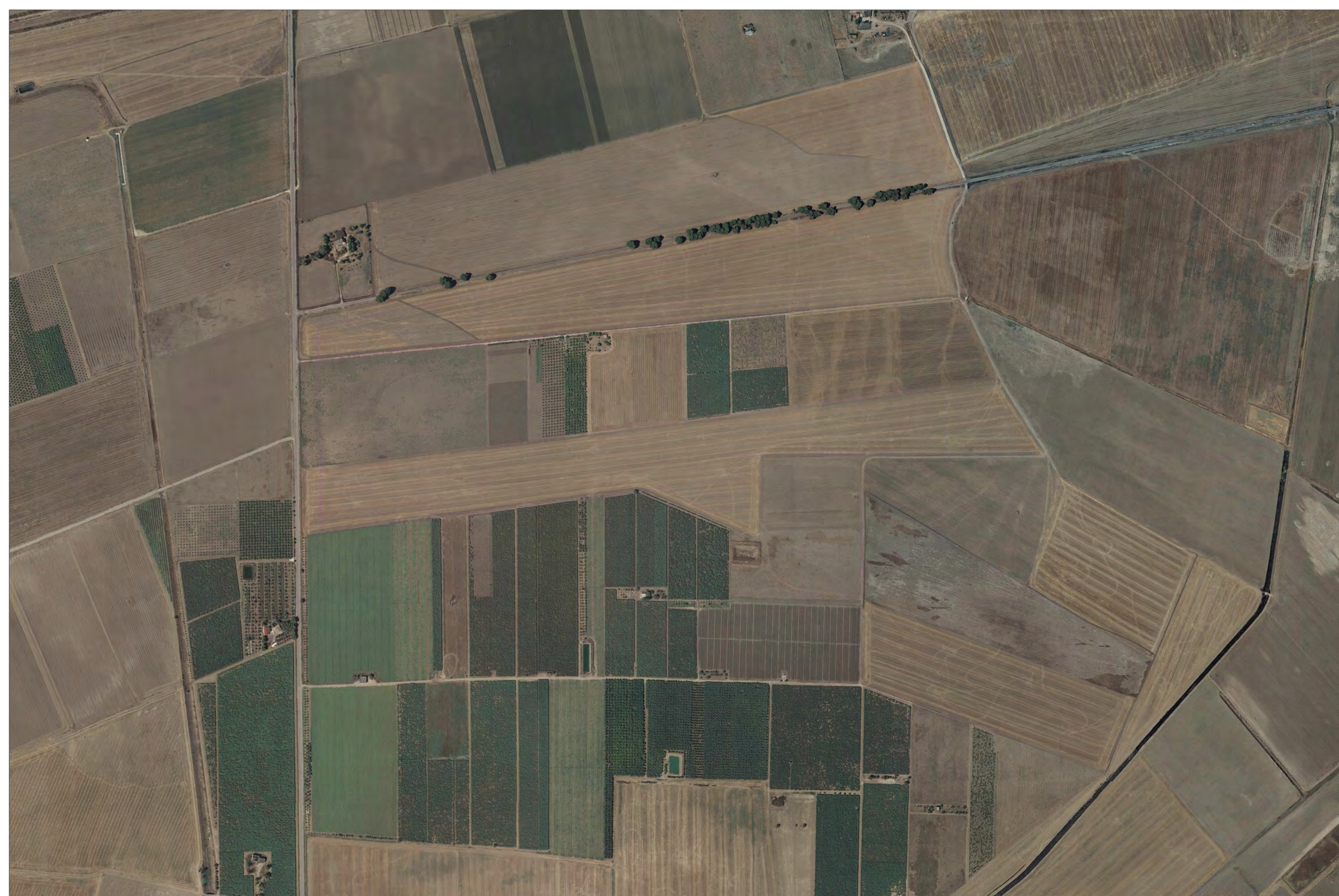
Campo B Vista aerofotogrammetrico stato di fatto