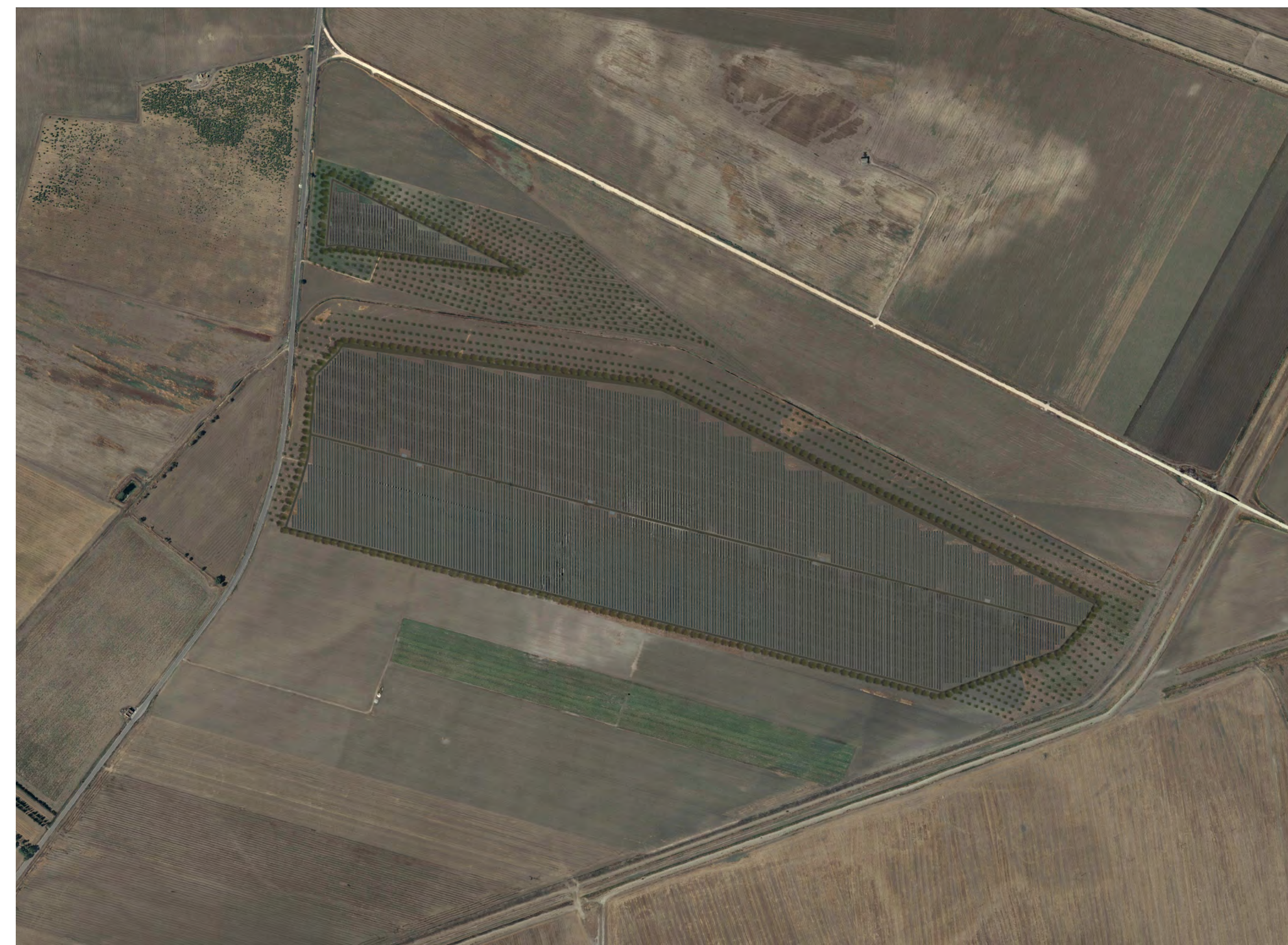
Campo A2 Vista aerofotogrammetrico stato di progetto