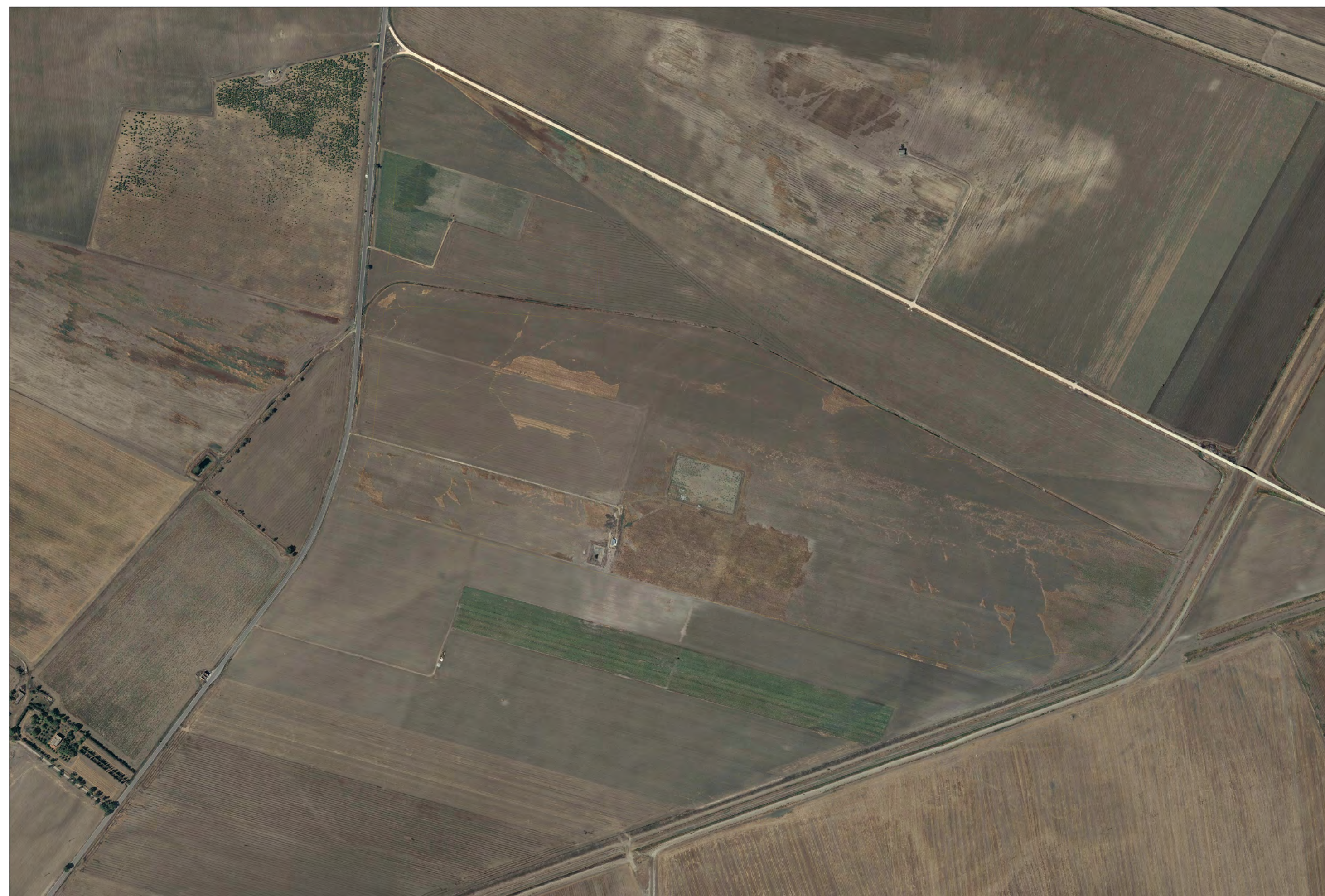
Campo A2 Vista aerofotogrammetrico stato di fatto