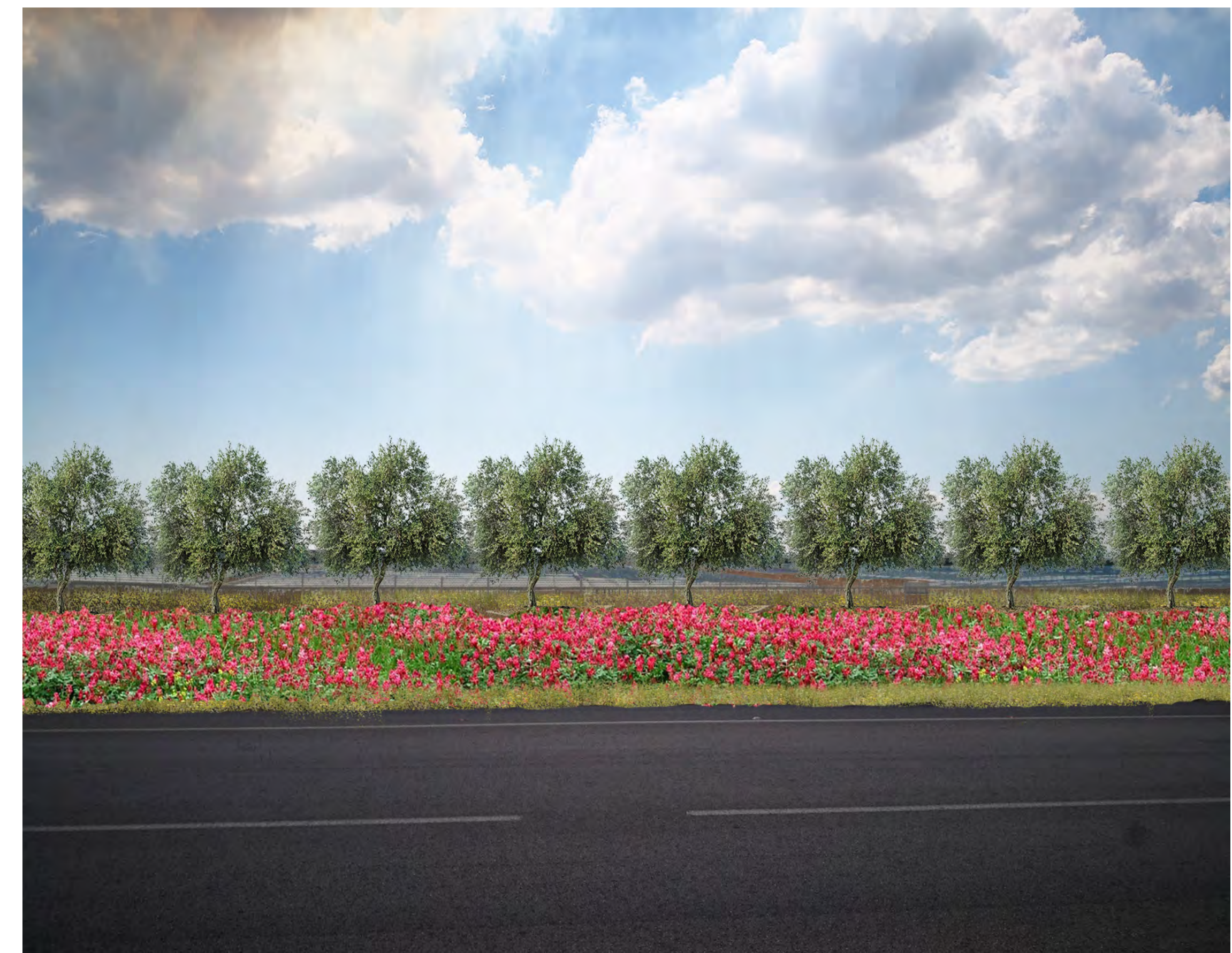
Campo B Vista 7 stato di progetto con mitigazione