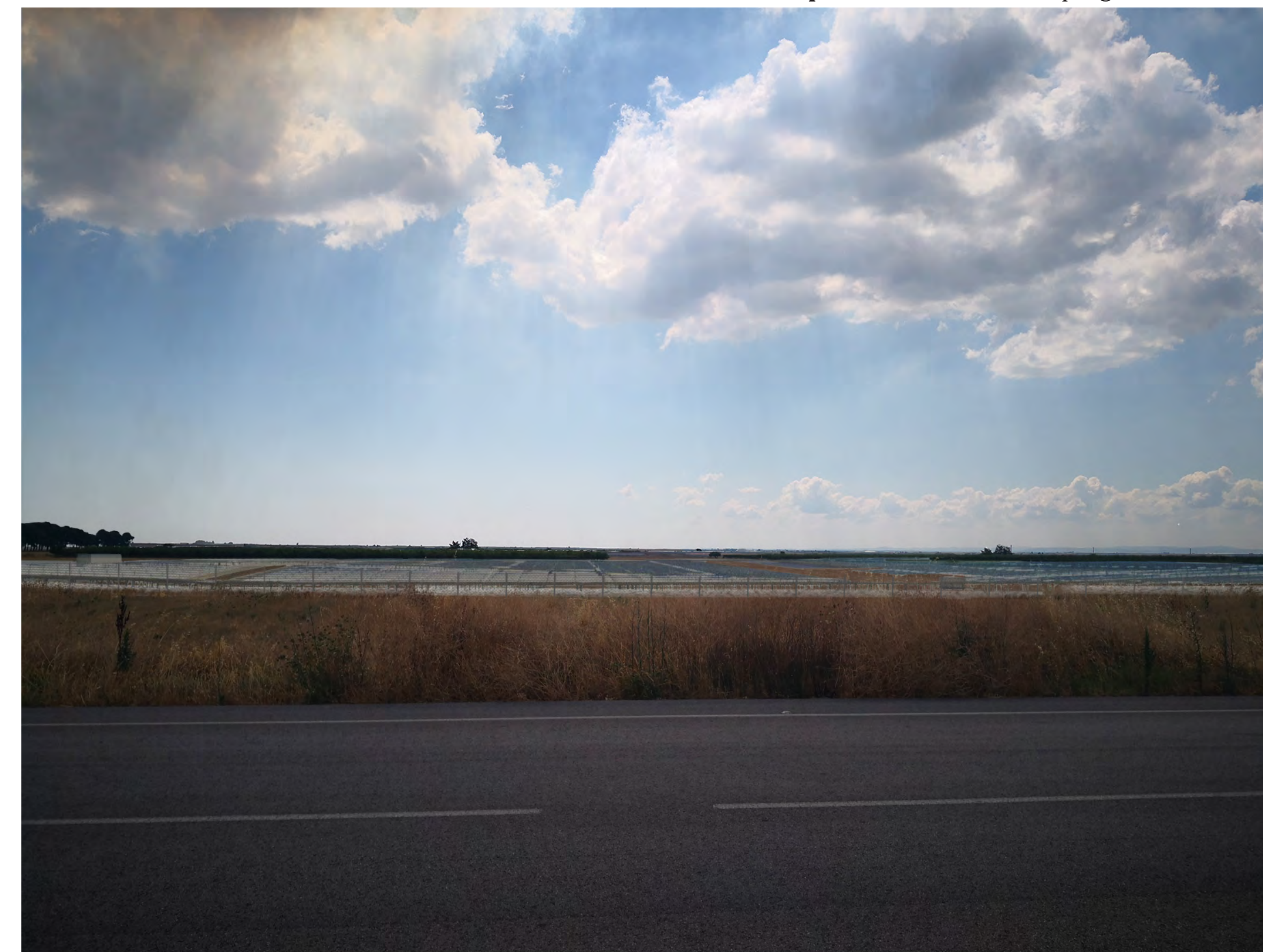
Campo B Vista 7 stato di progetto