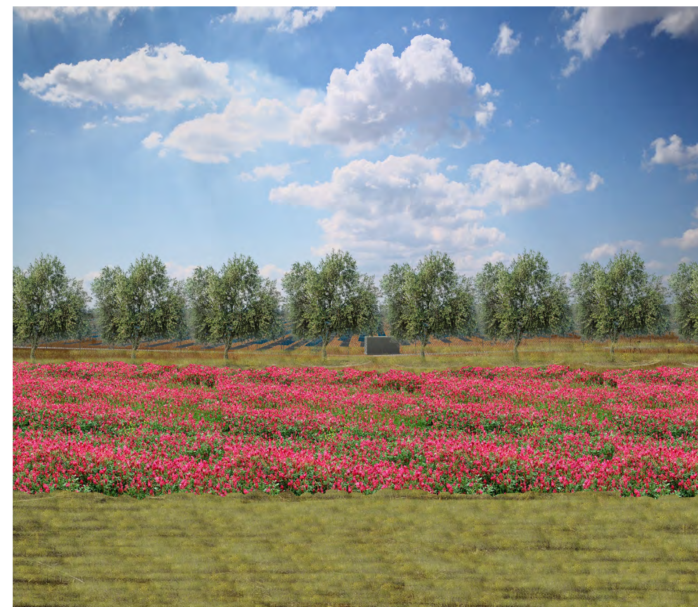
Campo B Vista 6 stato di progetto con mitigazione