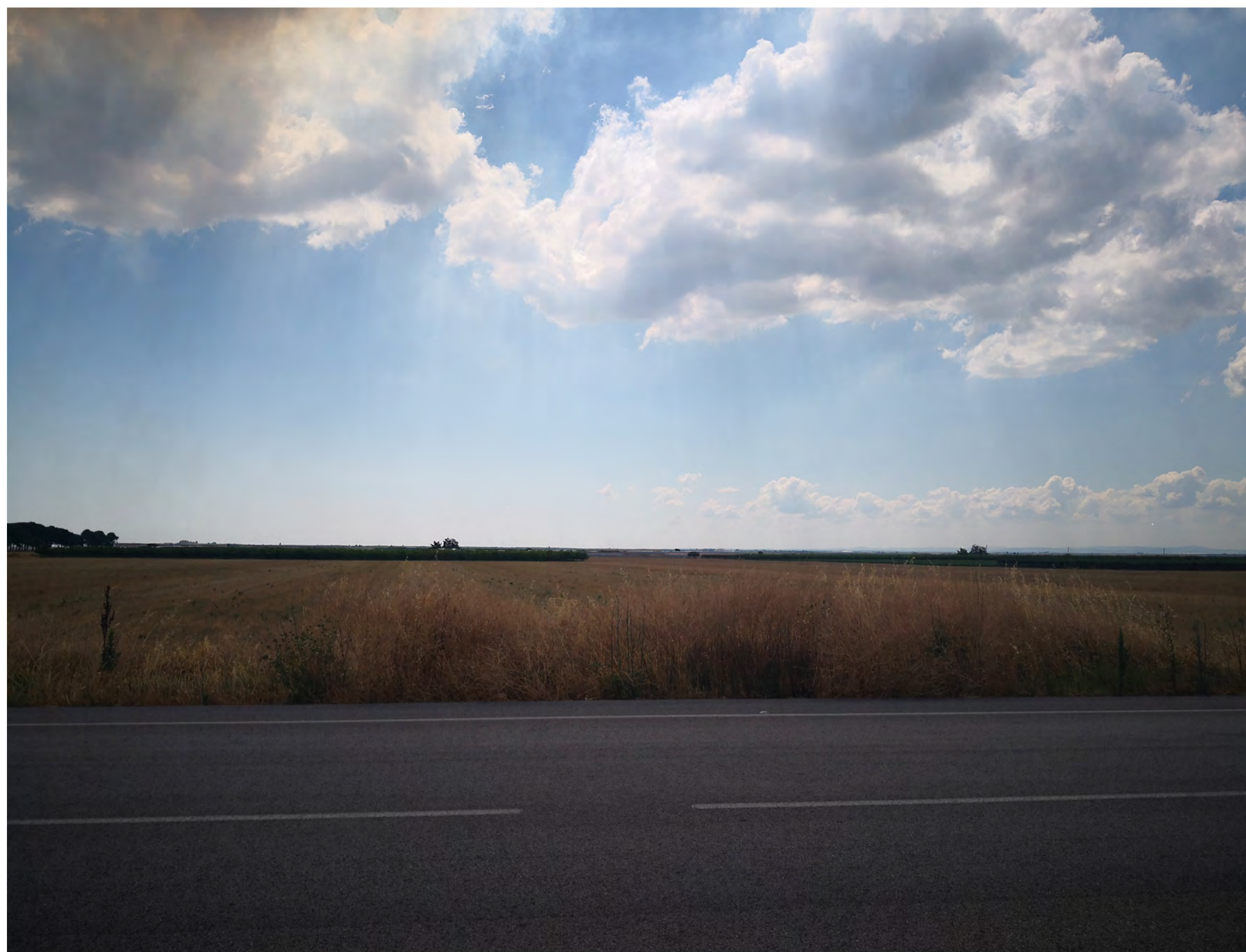
Campo B Vista 7 stato di fatto