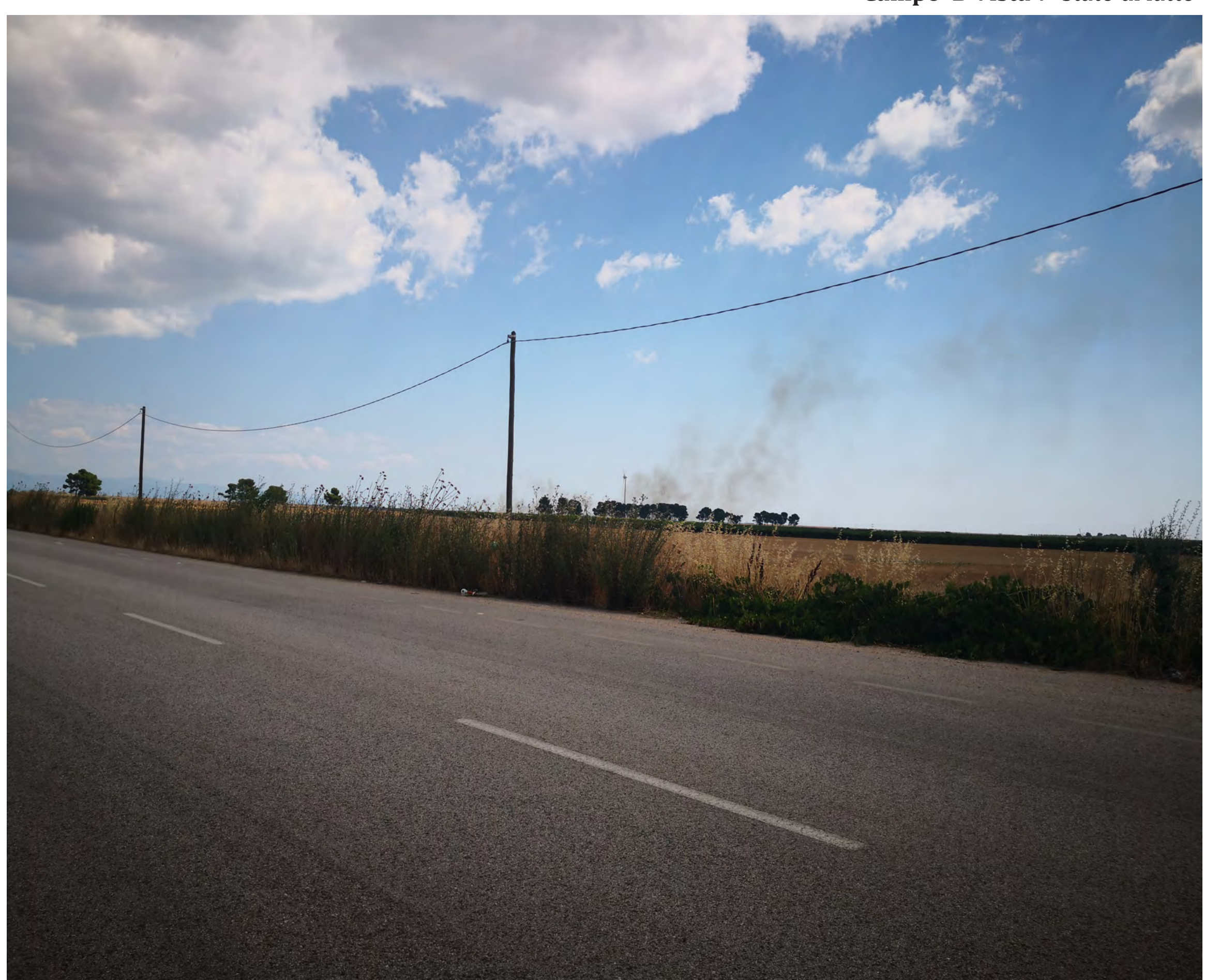
Campo B Vista 8 stato di fatto