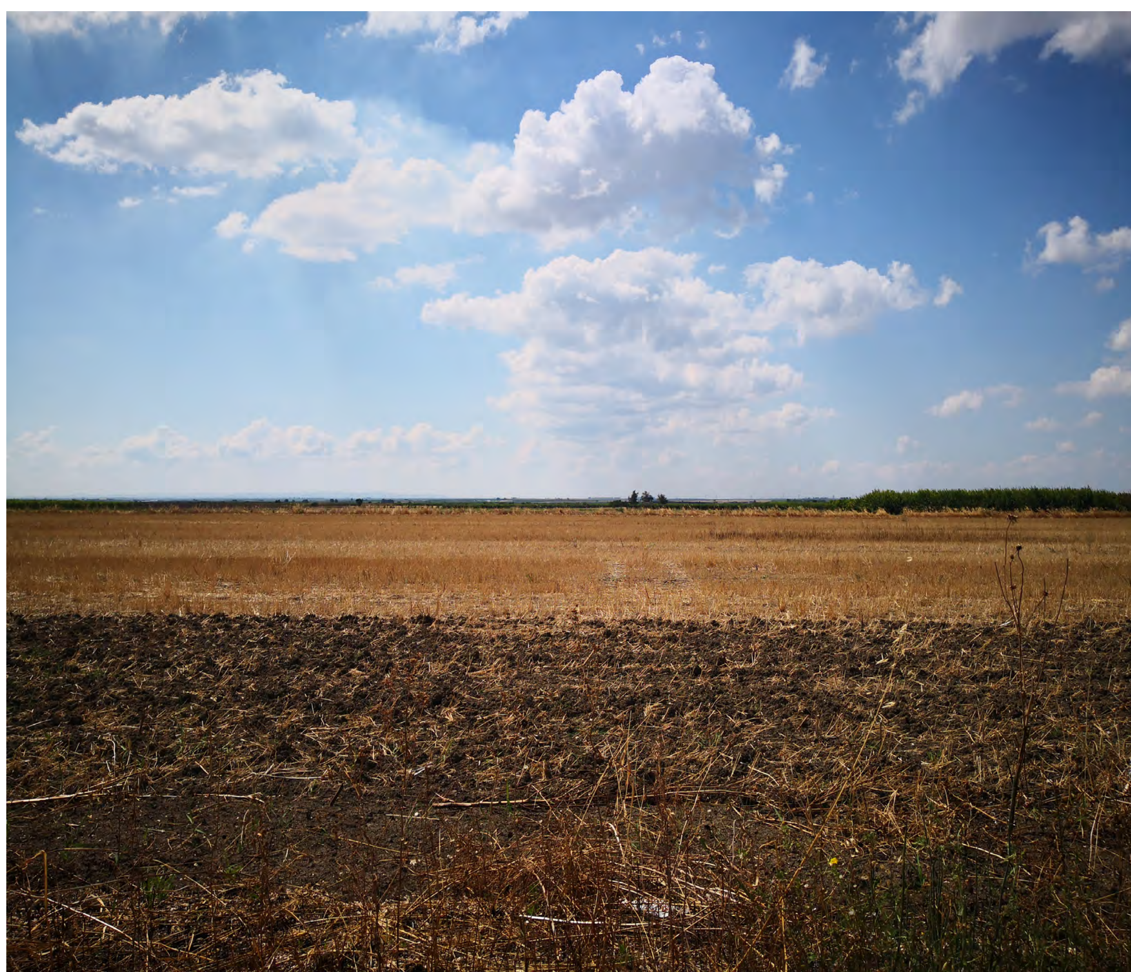
Campo B Vista 6 stato di fatto