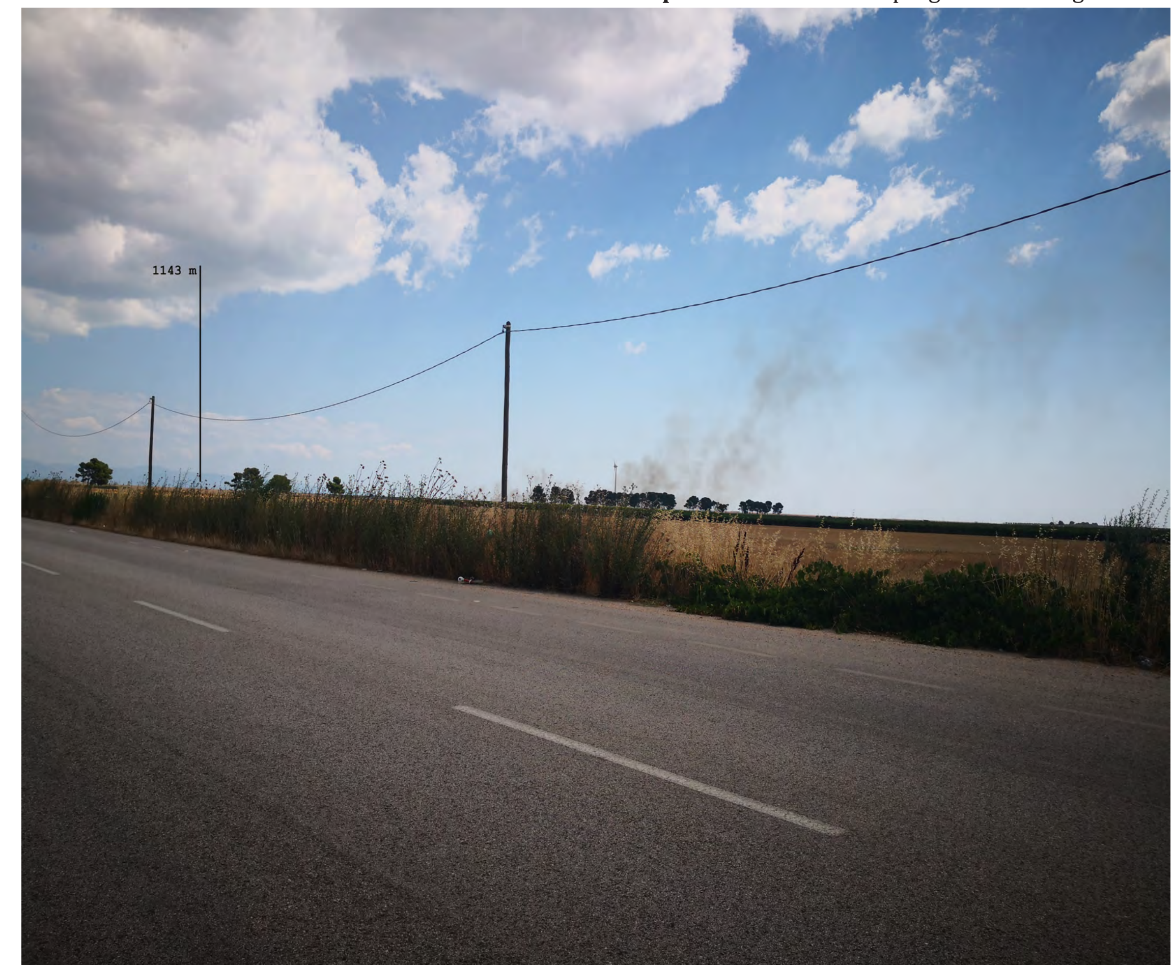
Campo B Vista 8 stato di progetto con mitigazione