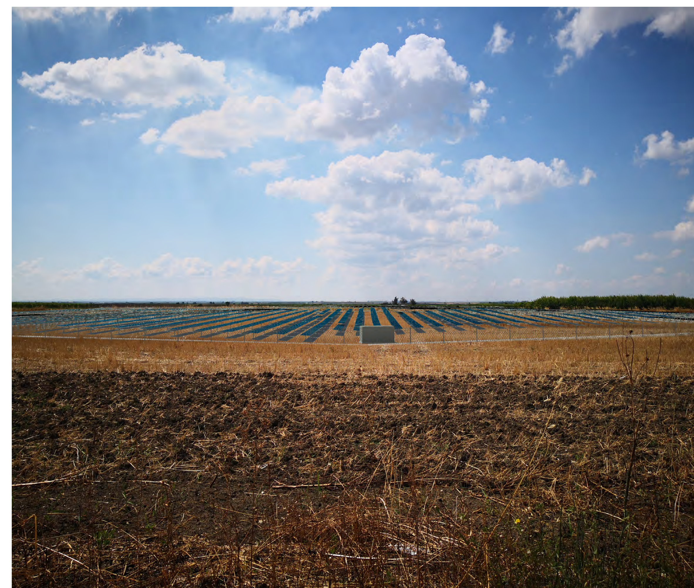
Campo B Vista 6 stato di progetto