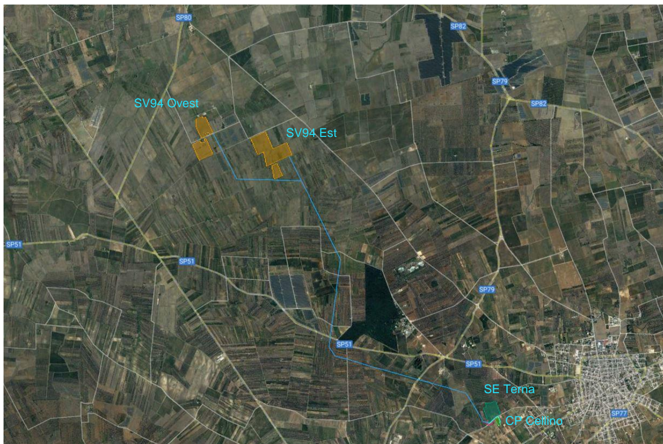
Figura 3-1: Inquadramento territoriale

Il sito di intervento si sviluppa a cavallo tra il territorio del Comune di Brindisi (BR) e il territorio Comune di Cellino San Marco (BR) , al centro del triangolo formato dai Comuni di Mesagne, San Pietro Vernotico e San Pancrazio Salentino. Nel dettaglio l'area di intervento è collocato in località "Lo Specchione" a circa 5,5 Km a nord-est dal centro abitato di Cellino San Marco, raggiungibile tramite la SP80.