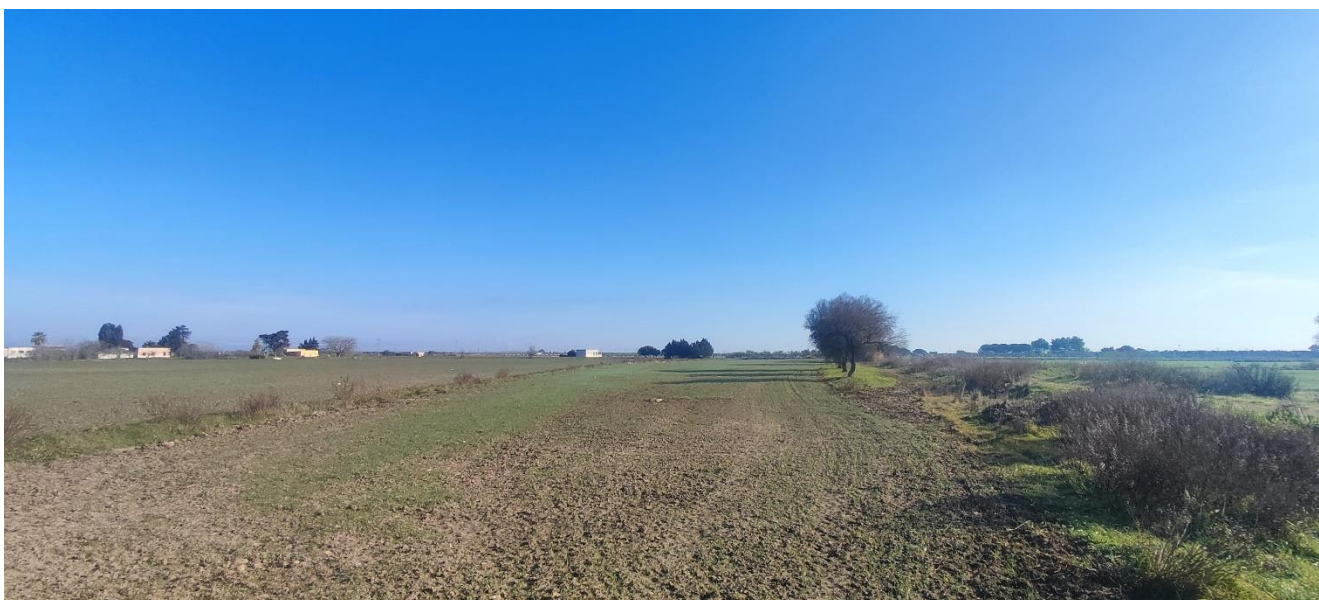
Figura 4-3: Terreno interessato dall'impianto

Generalmente, le specie che si rilevano sono specie ad ecologia plastica, quindi ben diffuse ed adattabili, tutt'altro che in pericolo, quali, nel caso degli uccelli, alcuni Passeriformi come la Cornacchia grigia, lo Storno, la Passera mattugia e la Passera domestica, molto comuni nell'ambiente agrario. È presente anche l'Allodola, il Fringuello, il Regolo e la Cince. Anche tra i mammiferi troviamo le specie più comuni quali ad esempio il Riccio, la lepore, la volpe e il topo comune.