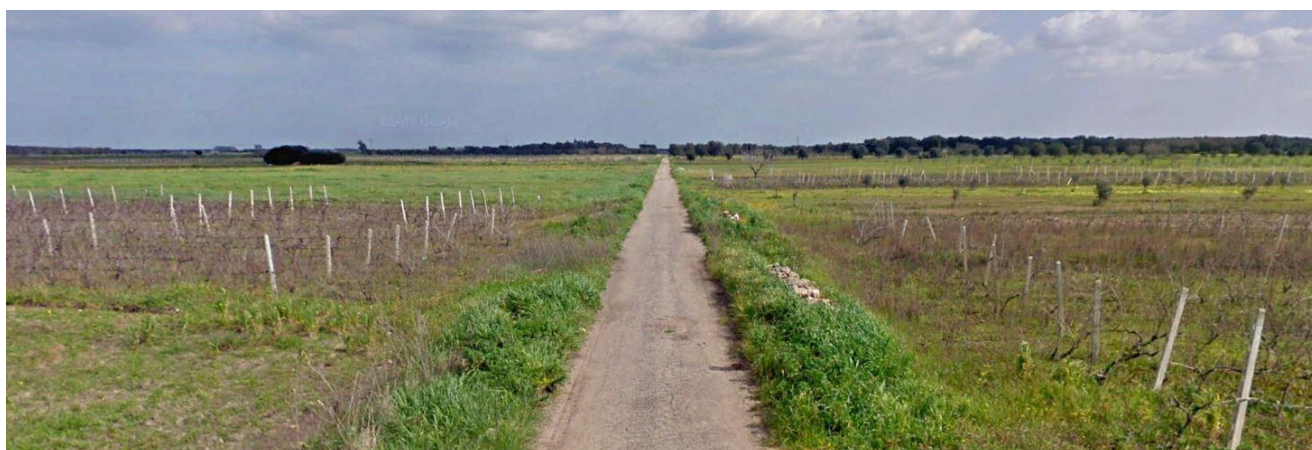
Figura 4-1: Viabilità locale di accesso all'impianto

Nello specifico sulle aree tra le strutture di sostegno dei pannelli fotovoltaici sarà piantumato un prato permanente polifita di leguminose adatto alle caratteristiche pedoclimatiche della superficie di progetto.