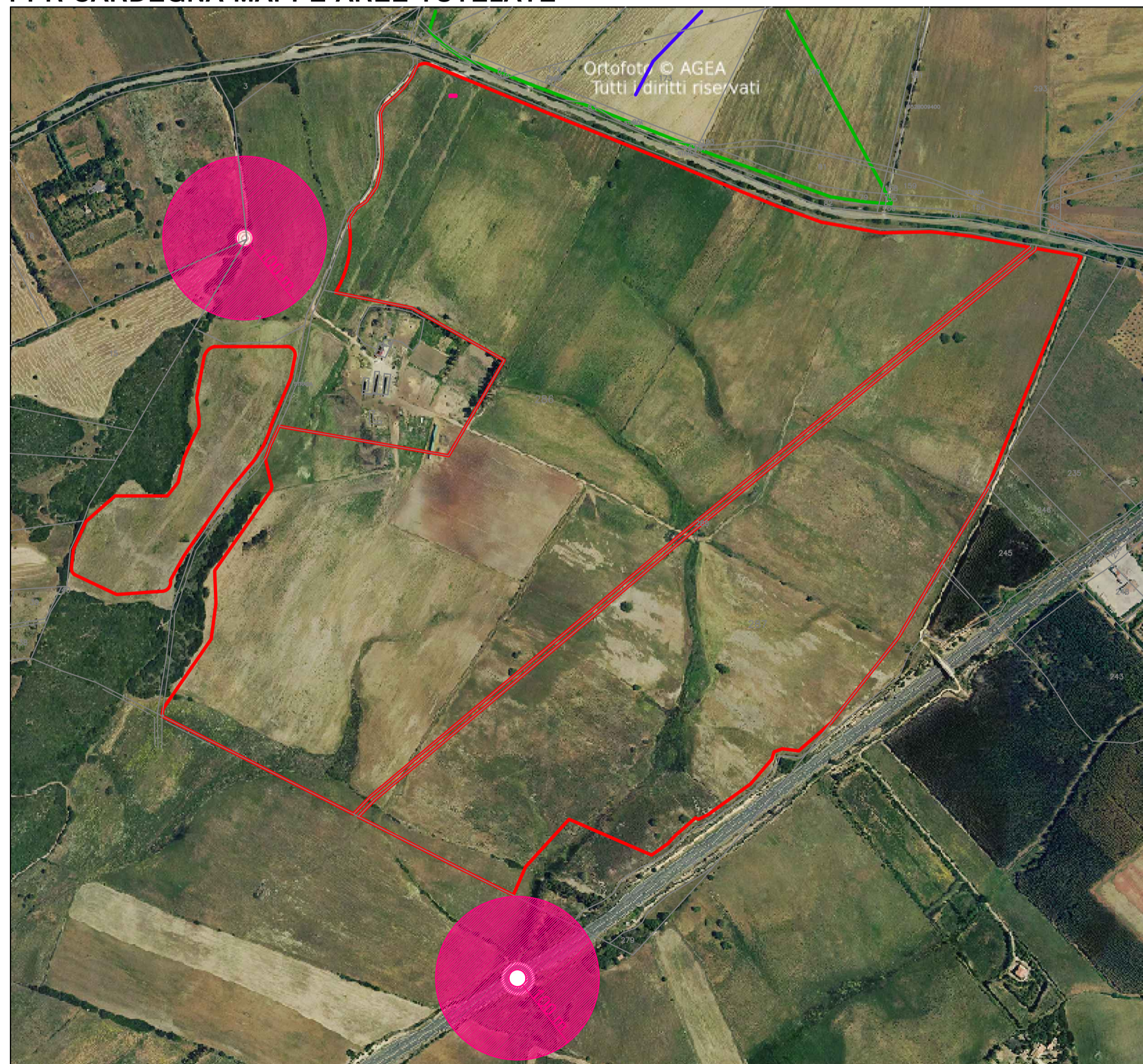
DETTAGLIO PPR SARDEGNA MAPPE AREE TULATE CON SOVRAPPONIMENTO CATASTALE SCALA 1:100