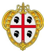
REGIONE AUTONOMA DELLA SARDEGNA