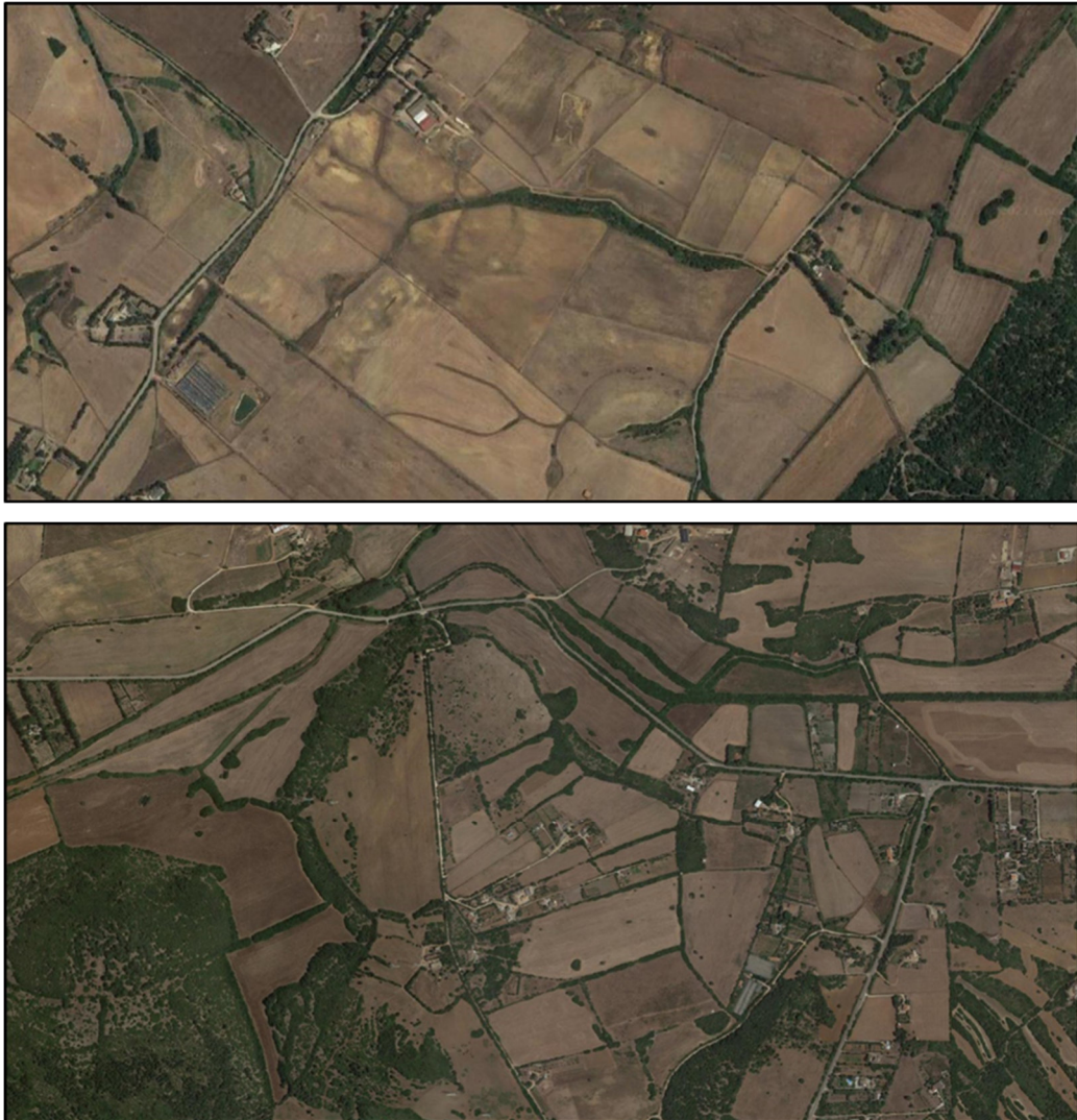
Figura 1. Stralcio Ortofoto – Area oggetto di studio

L'area proposta per la realizzazione del parco agrivoltaico è individuabile dalle seguenti coordinate geografiche: Lat. 40°47'56'' N; Long. 8°16'30'' E; Alt. 50 m circa sul livello del mare.