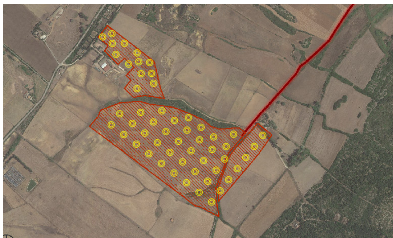
Figura 2. Stralcio Ortofoto – Punti di monitoraggio

Nel caso degli scavi derivanti dalla connessione dell'impianto, essendo previsti ogni 500 m lineari,