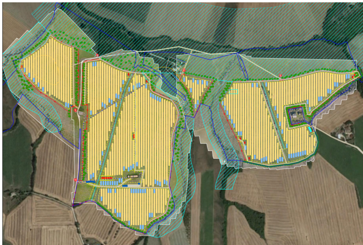
Figura 2.2: Layout area impianto

In riferimento al Catasto Terreni del Comune di Appignano (MC), l'impianto occupa le aree di cui ai Fogli 1,6,7 sulle particelle indicate nella tabella seguente: