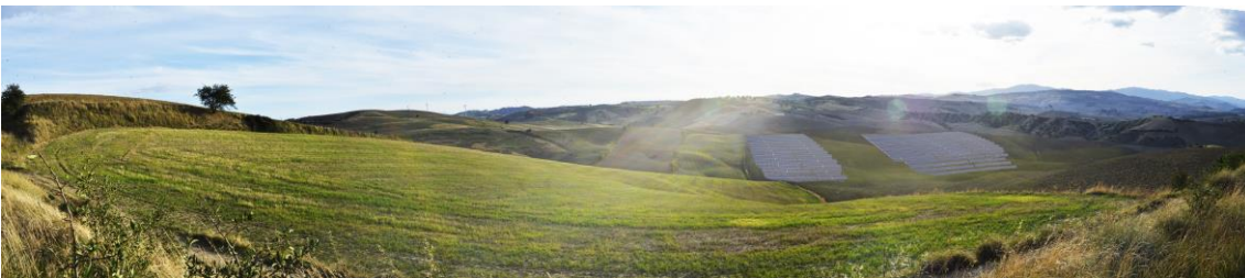
Panoramica ante operam