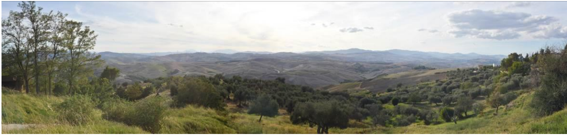
Impianto non visibile