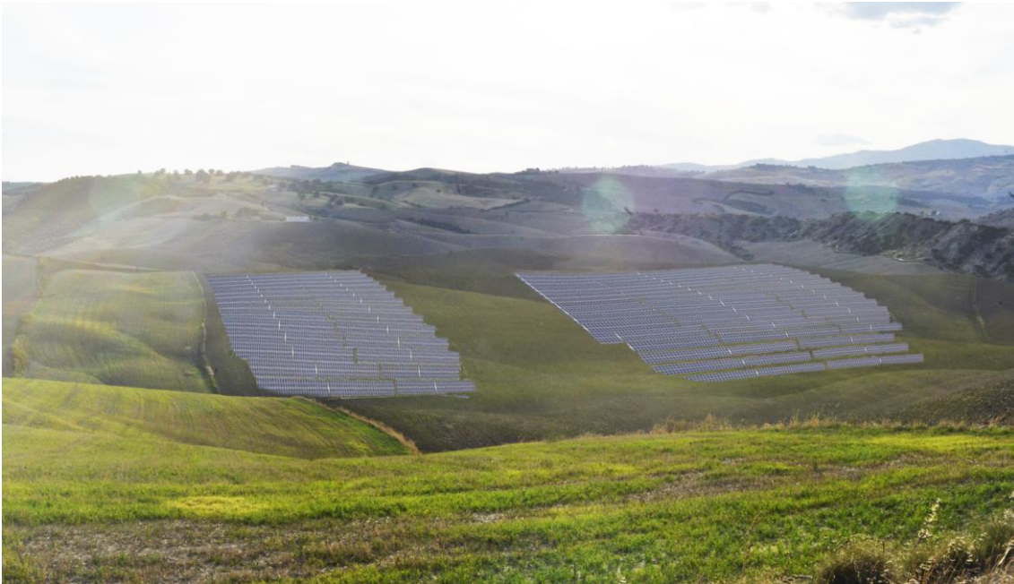
Dettaglio area di progetto visibile dalla viabilità prossima all'impianto