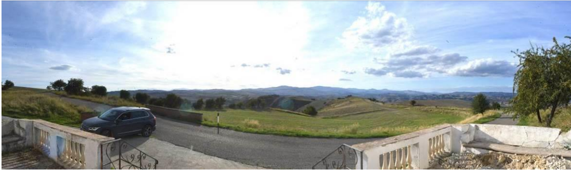
Impianto non visibile