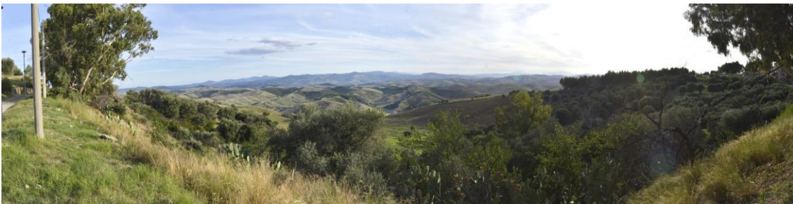
Impianto non visibile