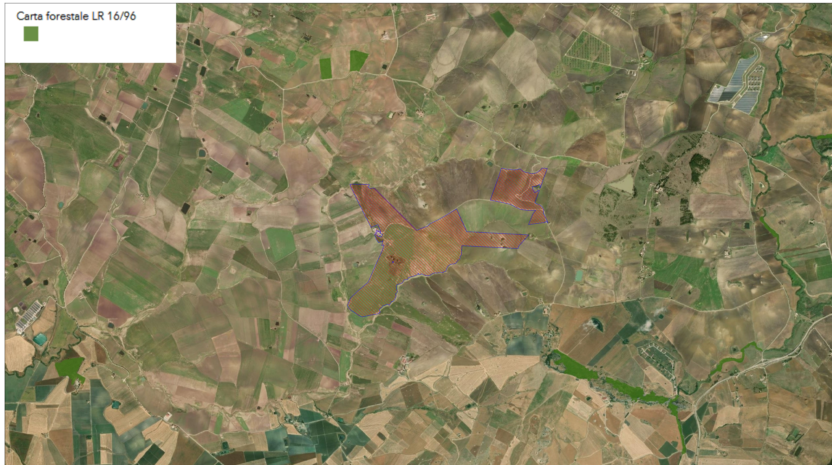
STRALCIO CARTA FORESTALE L.R. 16/96 SCALA 1:25.000