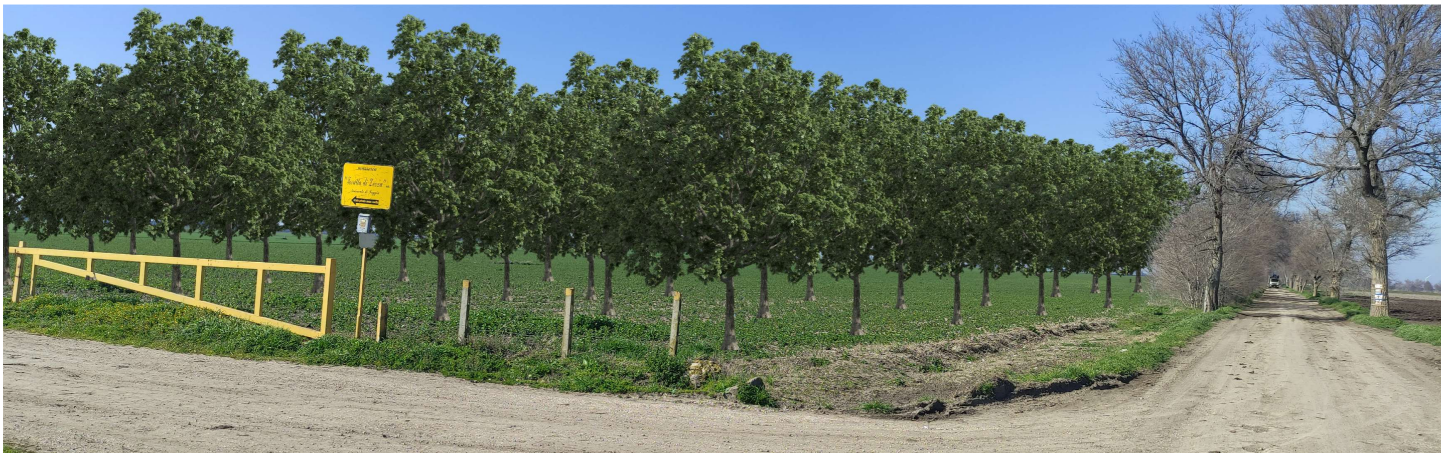
FOTO N. 2B – VISTA DELL'INTERSEZIONE TRA LA STRADA D'ACCESSO AL SITO INTERESSATO DAL PROGETTO DELL'IMPIANTO AGROVOLTAICO E LA SP24 (TRATTURELLO FOGGIA-SANNICANDRO) – POST OPERAM