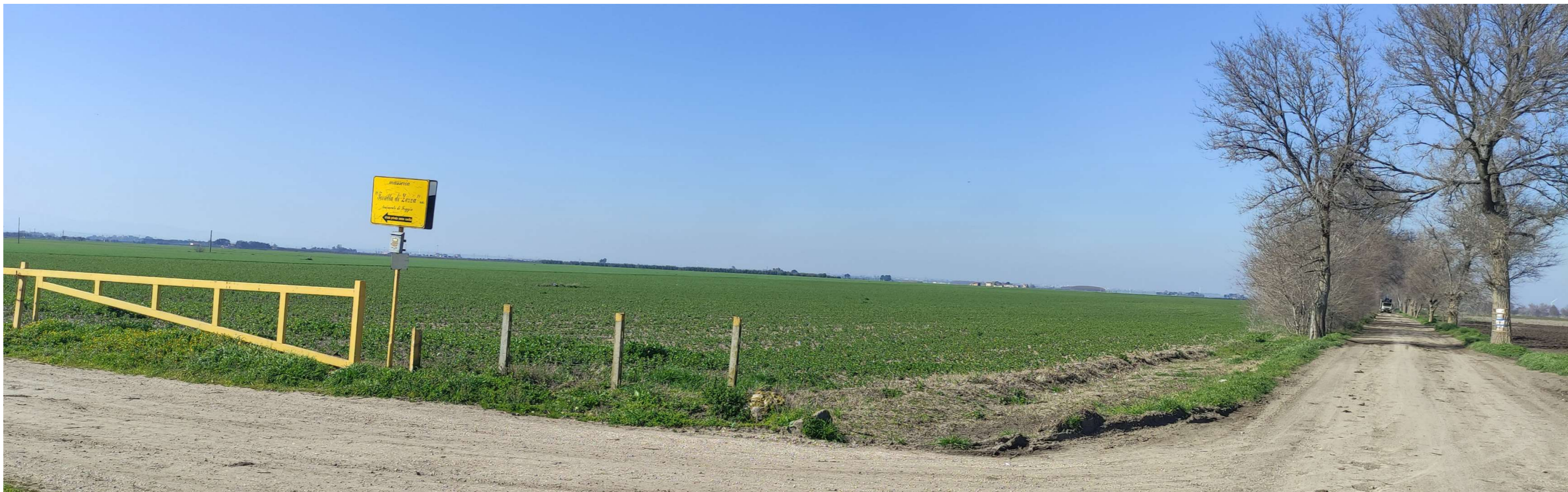
FOTO N. 2A – VISTA DELL'INTERSEZIONE TRA LA STRADA D'ACCESSO AL SITO INTERESSATO DAL PROGETTO DELL'IMPIANTO AGROVOLTAICO E LA SP24 (TRATTURELLO FOGGIA-SANNICANDRO) – ANTE OPERAM