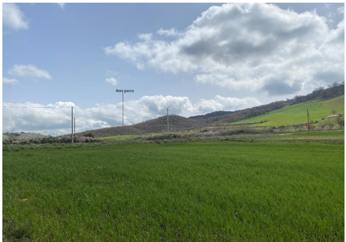
Figura 27- Ripresa fotografica Area Parchi FVT dal punto 16, uno dei punti percettivi sensibili ai sensi dell'art. 10 del D.Lgs. 42/2004