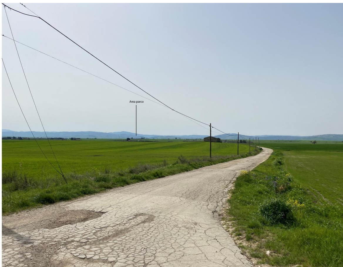
Figura 3 - Ripresa fotografica Area Parchi FVT dal punto 5, uno dei punti percettivi sensibili ai sensi dell'art. 10 del D.Lgs. 42/2004