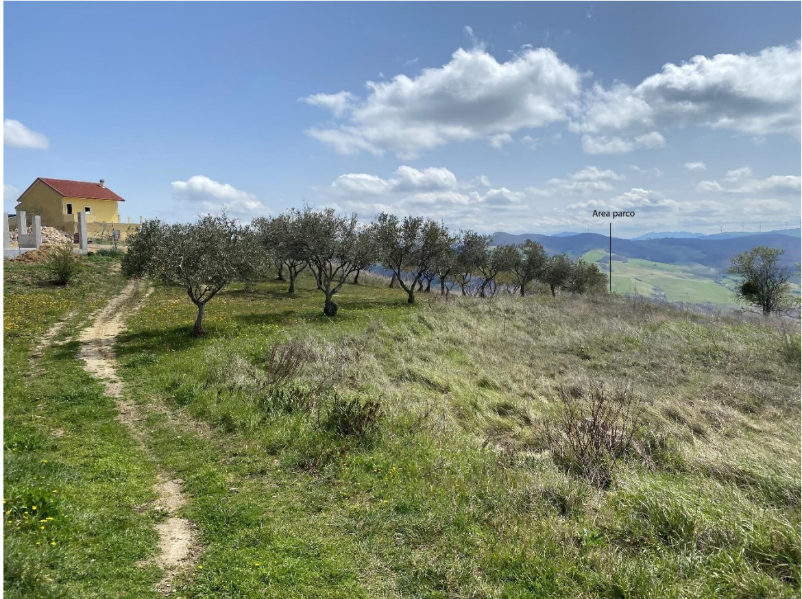
Figura 9- Ripresa fotografica Area Parchi FVT dal punto 25 dal Comune di Oppido Lucano