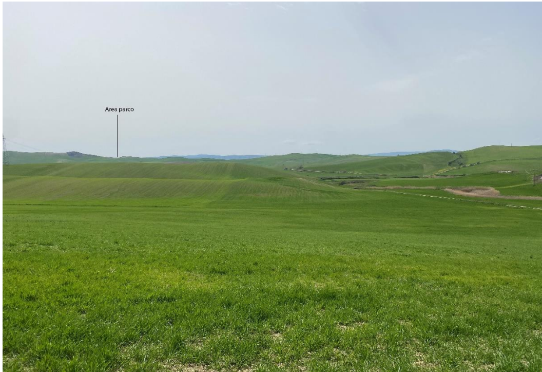
Figura 7- Ripresa fotografica Area Parchi FVT dal punto 7, uno dei punti percettivi sensibili ai sensi dell'art. 10 del D.Lgs. 42/2004