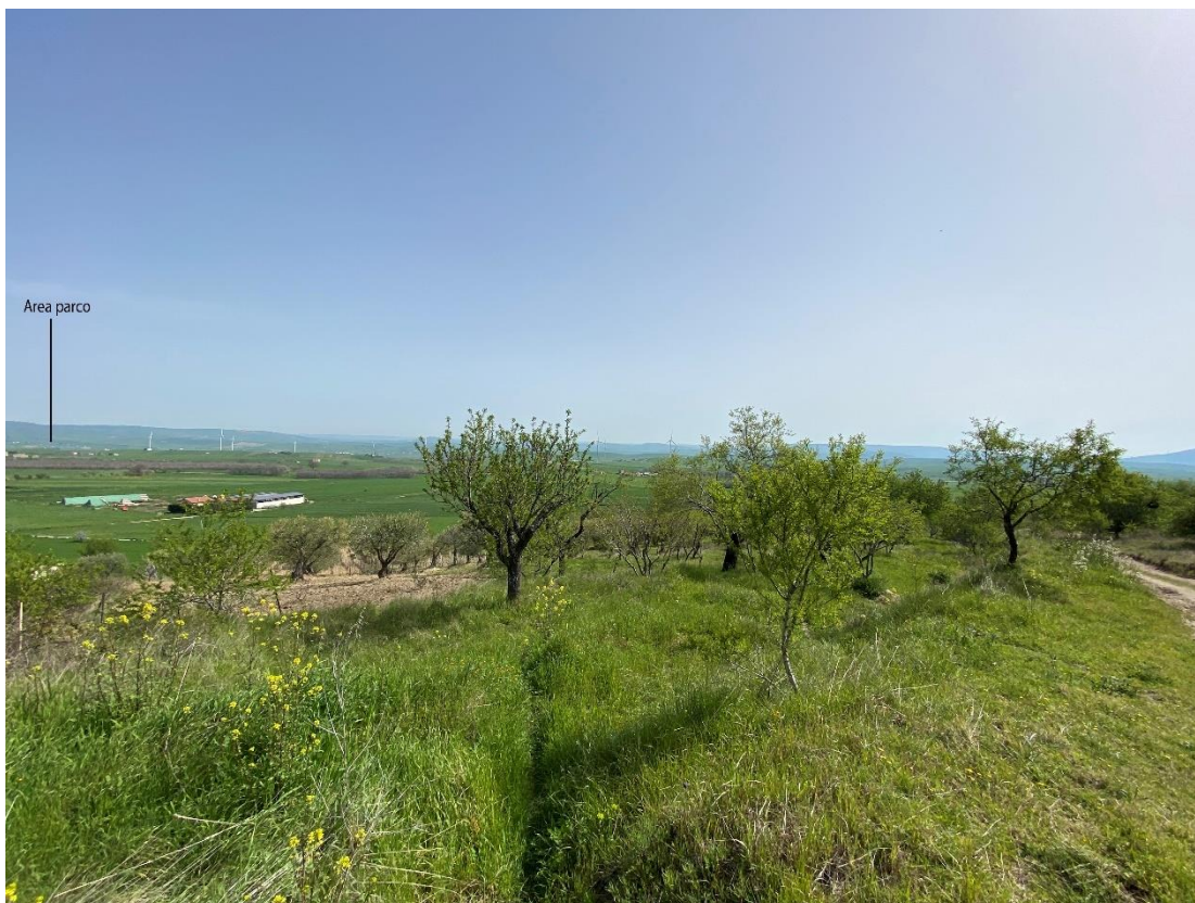
Figura 18 - Ripresa fotografica Area Parchi FVT dal punto 30