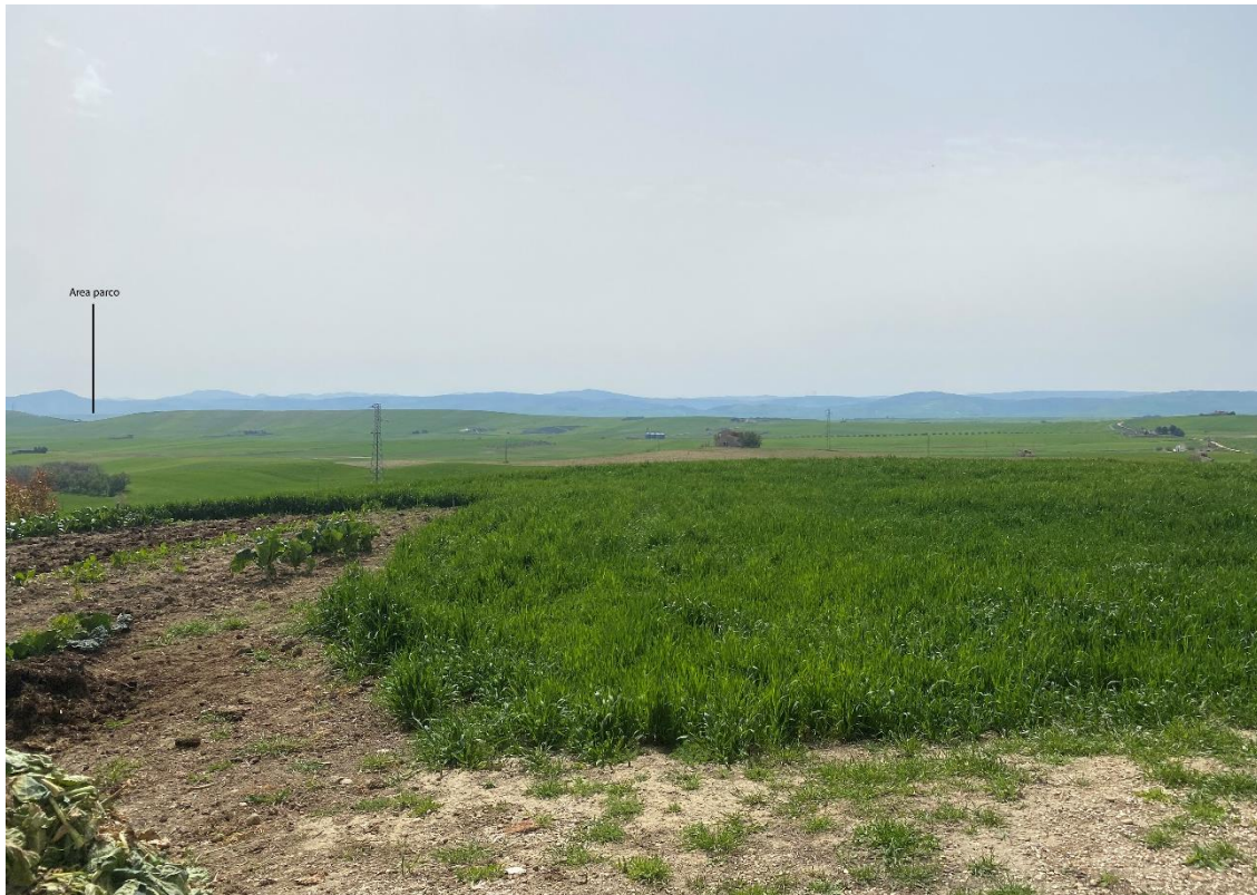
Figura 5 - Ripresa fotografica Area Parchi FVT dal punto 2, uno dei punti percettivi sensibili ai sensi dell'art. 10 del D.Lgs. 42/2004