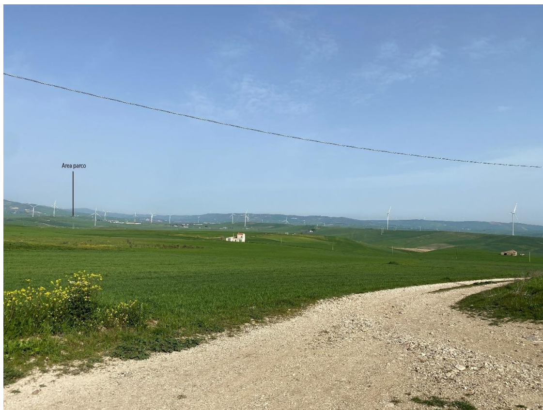
Figura 14- Ripresa fotografica Area Parchi FVT dal punto 13, uno dei punti percettivi sensibili ai sensi dell'art. 10 del D.Lgs. 42/2004