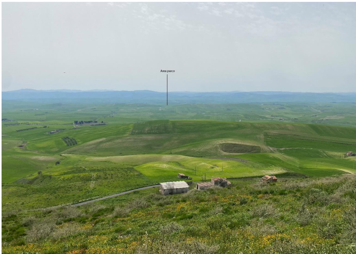
Figura 6- Ripresa fotografica Area Parchi FVT dal punto 1 dal Castello di Monteserico