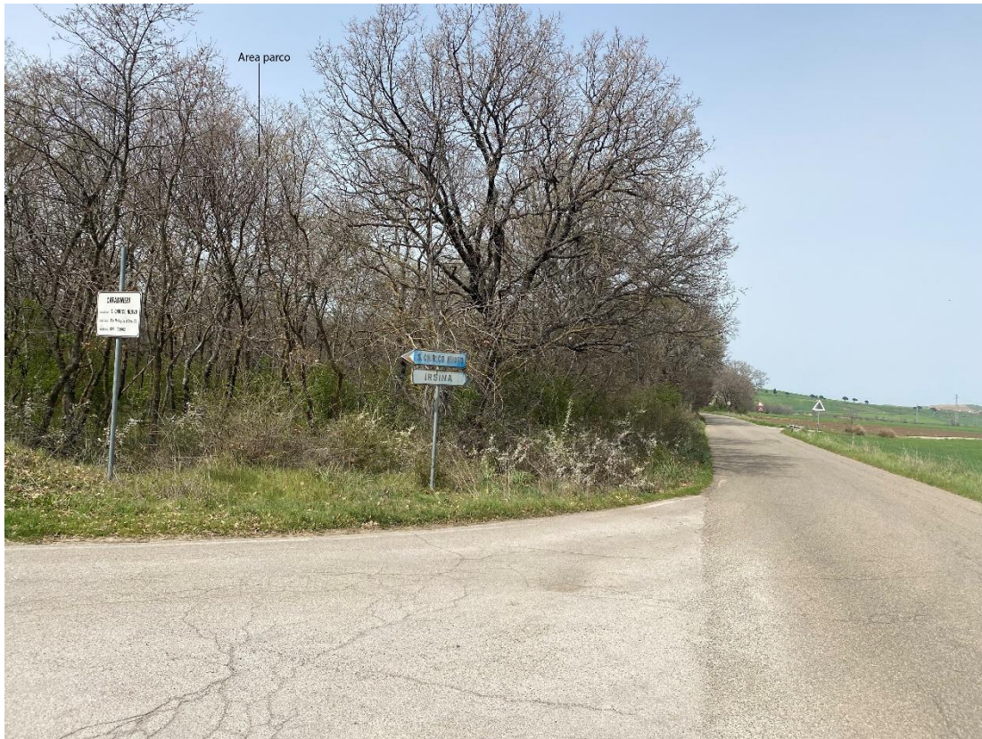
Figura 22- Ripresa fotografica Area Parchi FVT dal punto 11