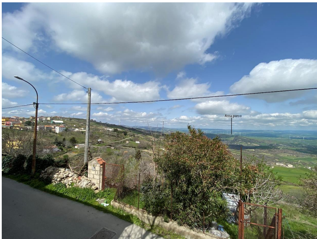
Figura 25- Ripresa fotografica Area Parchi FVT dal punto 15 dal Comune di San Chirico Nuovo