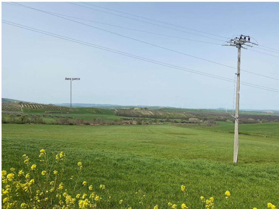
Figura 23- Ripresa fotografica Area Parchi FVT dal punto 12, uno dei punti percettivi sensibili ai sensi dell'art. 10 del D.Lgs. 42/2004