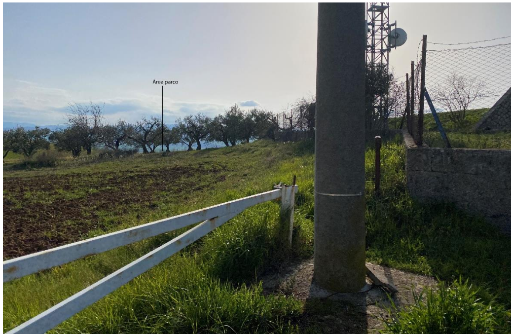
Figura 32- Ripresa fotografica Area Parchi FVT dal punto 8 "Territorio Comunale di Irsina D.M. 07/03/2011"