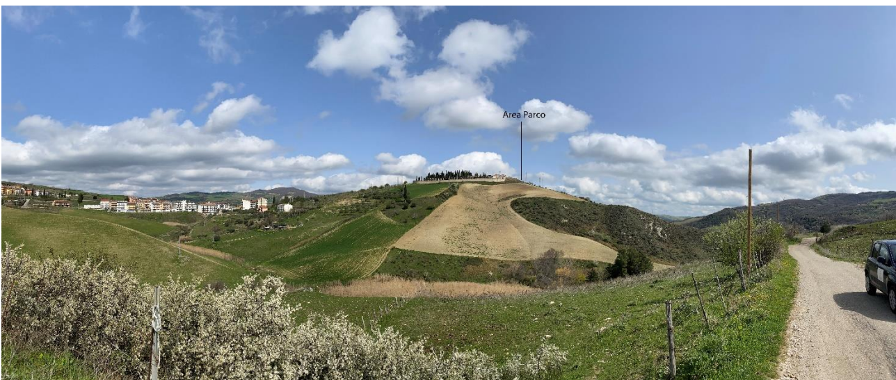
Figura 30- Ripresa fotografica Area Parchi FVT dal punto 22 dal Comune di Tolve