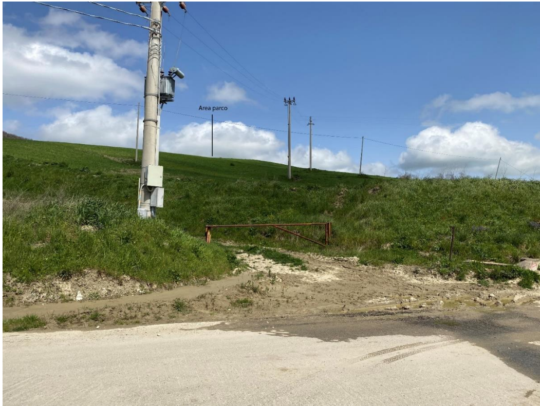
Figura 31- Ripresa fotografica Area Parchi FVT dal punto 24 "Moltone (Tolve) – D.M. 30/04/1973"