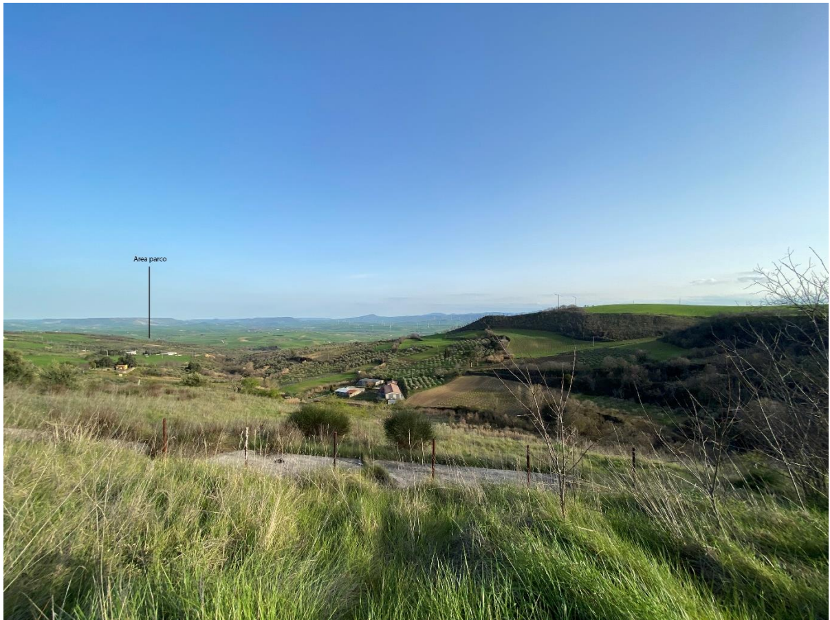
Figura 2 - Ripresa fotografica Area Parchi FVT dal punto 3 dal Comune di Genzano di Lucania