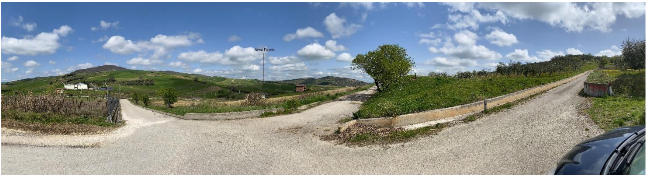
Figura 29- Ripresa fotografica Area Parchi FVT dal punto 23 dal Comune di Tolve