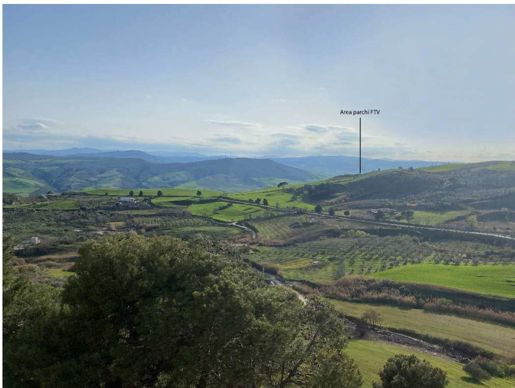
Figura 8 - Ripresa fotografica Area Parchi FVT dal punto 9 "Territorio Comunale di Irsina D.M. 07/03/2011"