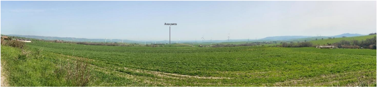
Figura 16- Ripresa fotografica Area Parchi FVT dal punto 31