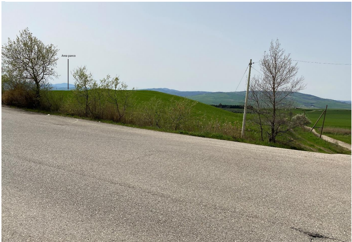
Figura 1 - Ripresa fotografica Area Parchi FVT dal punto 6, uno dei punti percettivi sensibili ai sensi dell'art. 10 del D.Lgs. 42/2004