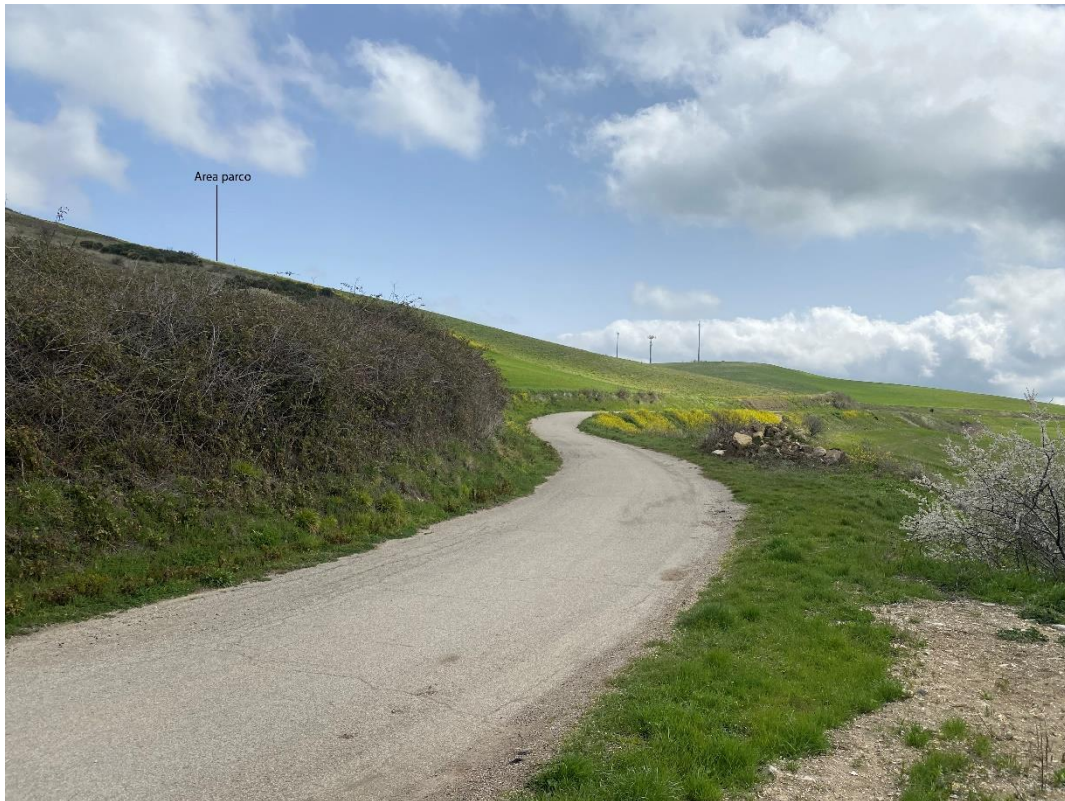
Figura 24- Ripresa fotografica Area Parchi FVT dal punto 17, uno dei punti percettivi sensibili ai sensi dell'art. 10 del D.Lgs. 42/2004