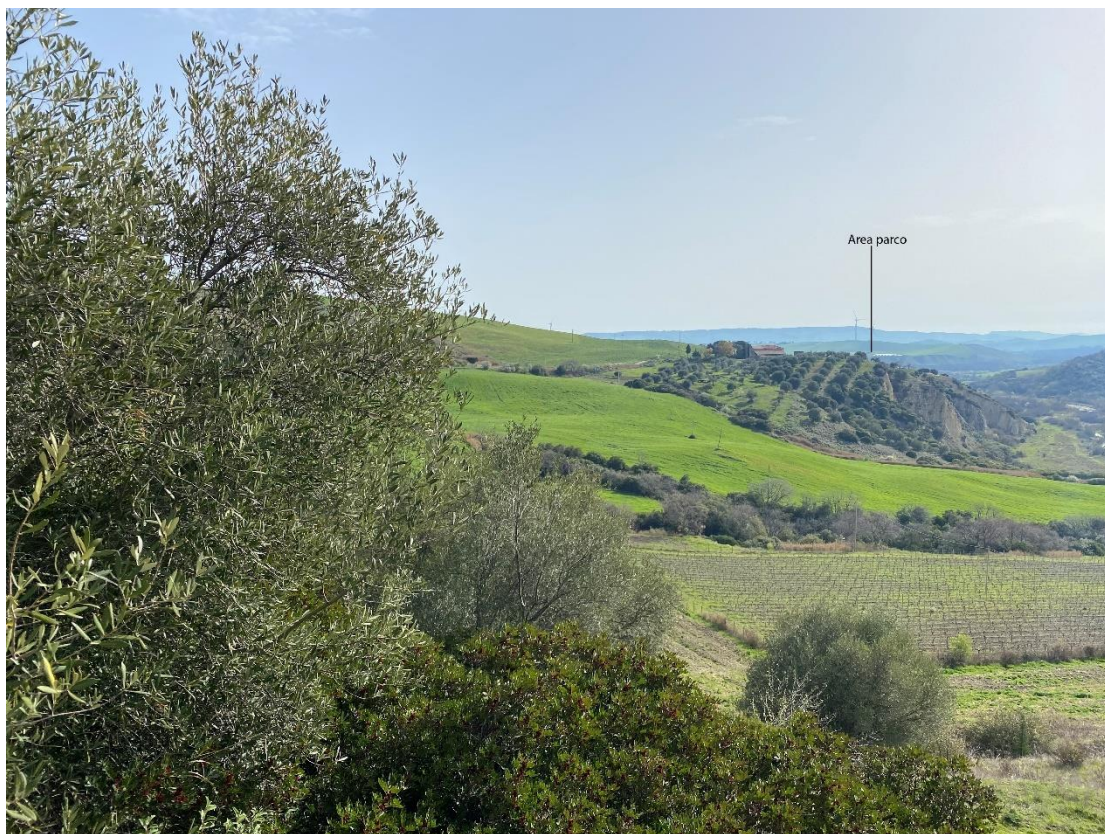
Figura 20 - Ripresa fotografica Area Parchi FVT dal punto 20 "Masseria Moles già Mancuso – D.M. 15/09/1990