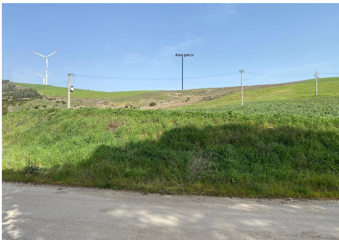
Figura 19- Ripresa fotografica Area Parchi FVT dal punto 19 "Masseria Linchinchi Caporale (Tolve) - D.S.R n.22 del 23/03/2016