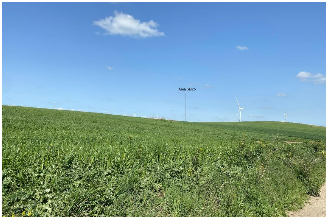
Figura 12- Ripresa fotografica Area Parchi FVT dal punto 32, uno dei punti percettivi sensibili ai sensi dell'art. 136 e 142 del D.Lgs. 42/2004