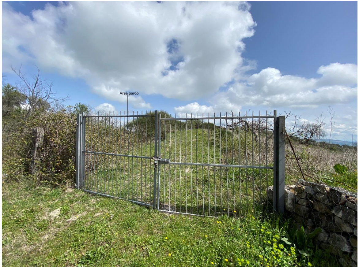
Figura 26- Ripresa fotografica Area Parchi FVT dal punto 14 dal Comune di San Chirico Nuovo