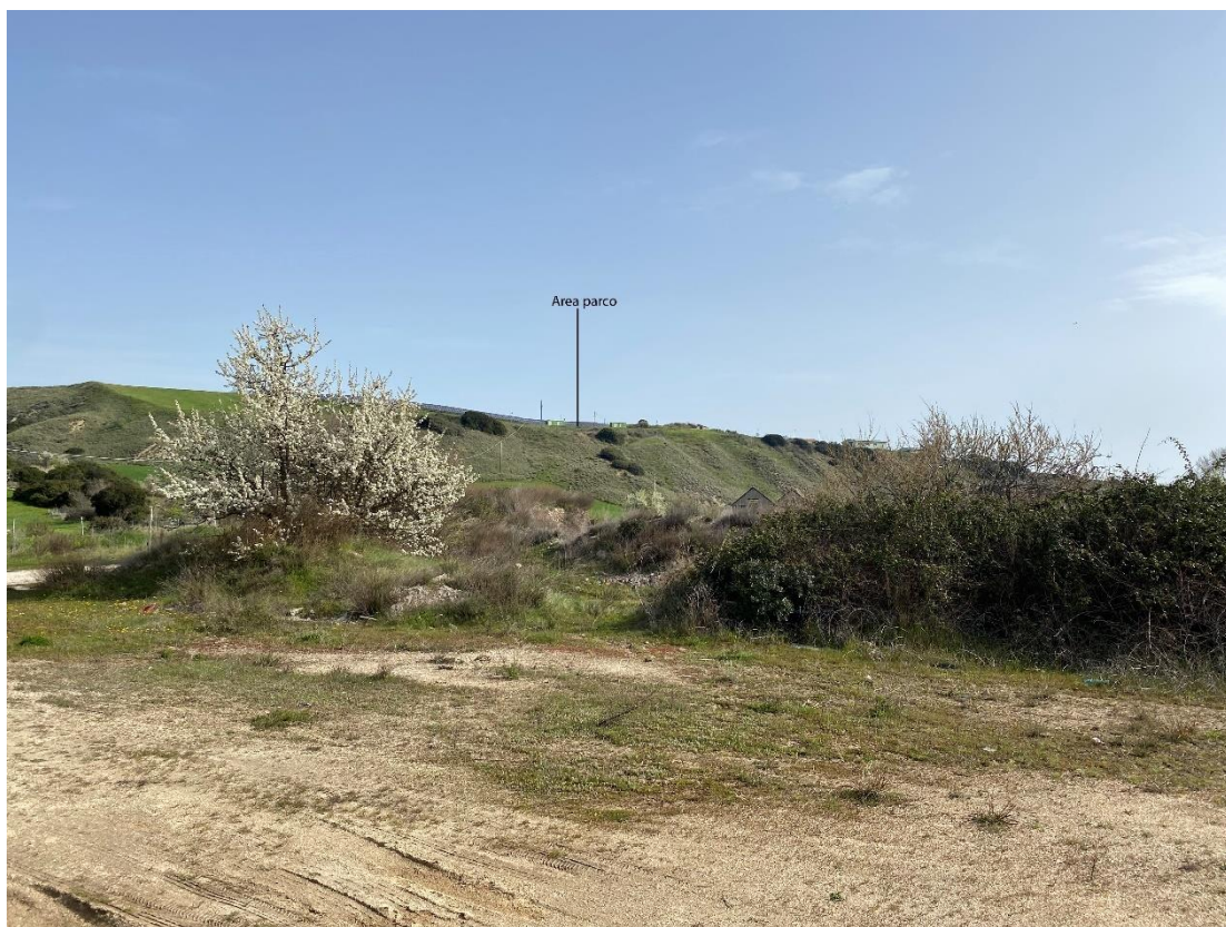
Figura 21 - Ripresa fotografica Area Parchi FVT dal punto 18