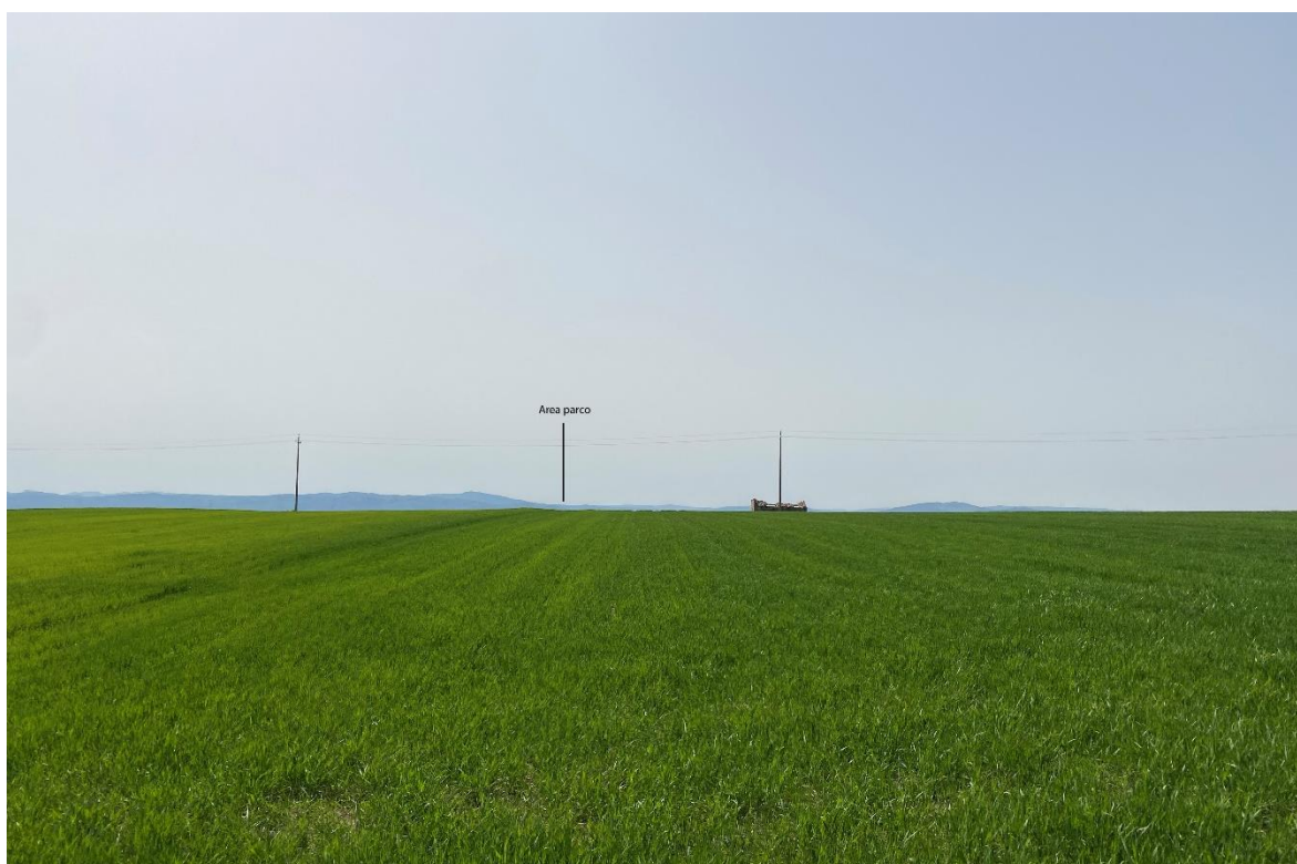
Figura 4 - Ripresa fotografica Area Parchi FVT dal punto 4, uno dei punti percettivi sensibili ai sensi dell'art. 10 del D.Lgs. 42/2004