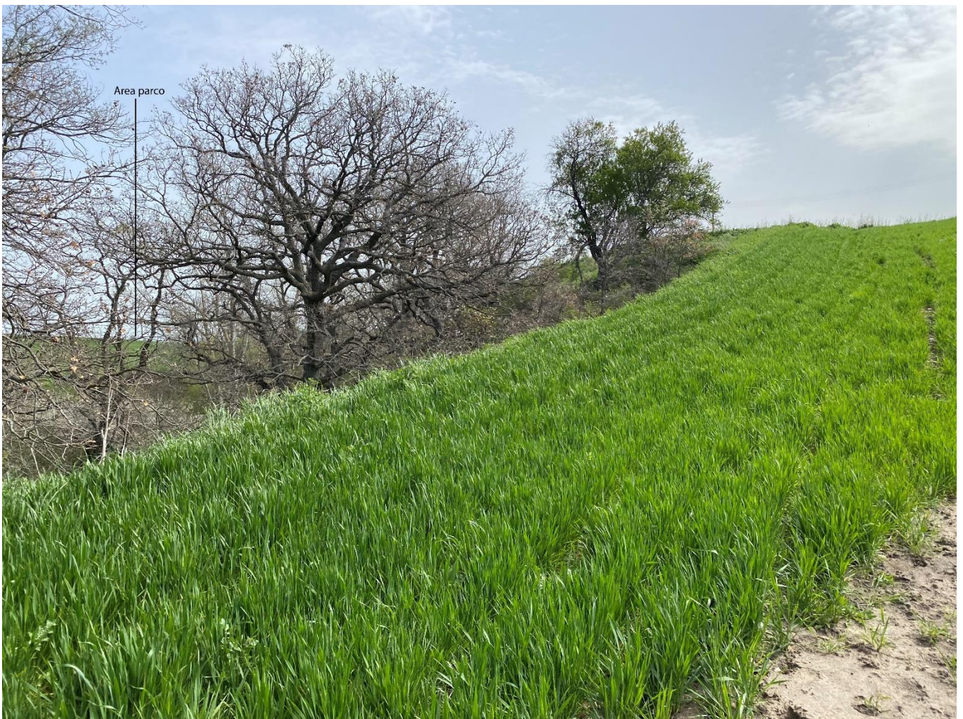
Figura 17 - Ripresa fotografica Area Parchi FVT dal punto 29