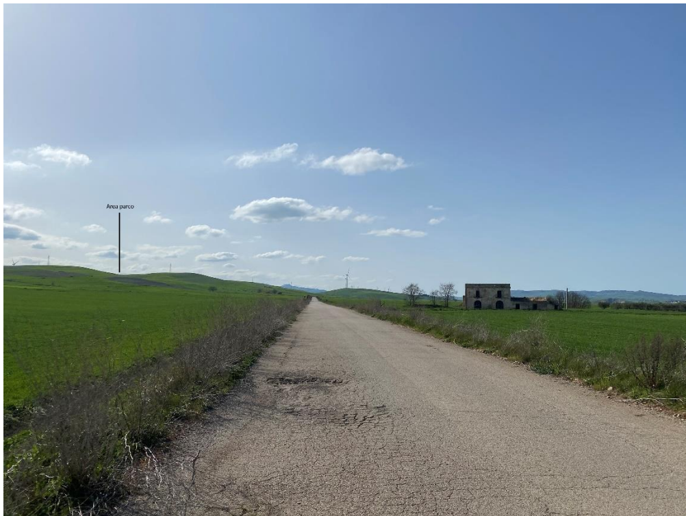
Figura 17 Ripresa fotografica Area Parchi FVT dal punto 10, uno dei punti percettivi sensibili ai sensi dell'art. 10 del D.Lgs. 42/2004