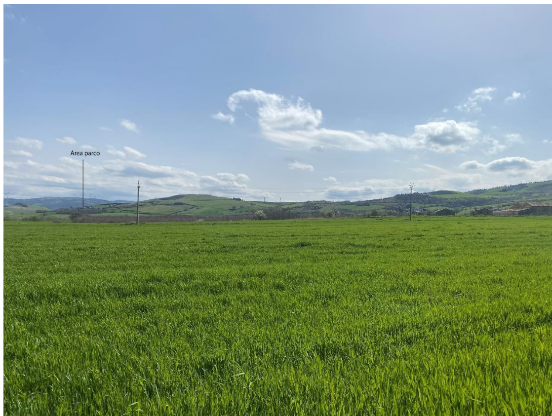
Figura 13- Ripresa fotografica Area Parchi FVT dal punto 28 "S. Anastasia Tirolo (Oppido Lucano) – D.M. 22/06/1991"