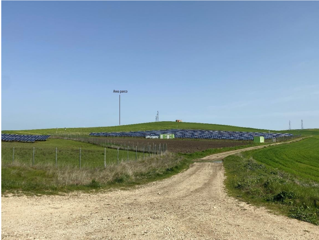
Figura 15- Ripresa fotografica Area Parchi FVT dal punto 33, uno dei punti percettivi sensibili ai sensi dell'art. 10 del D.Lgs. 42/2004