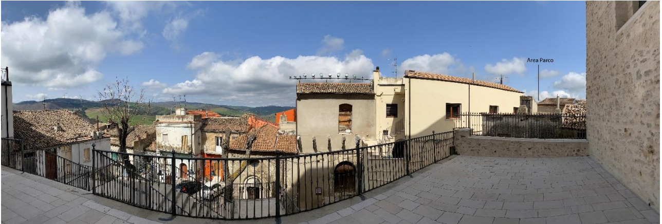
Figura 28- Ripresa fotografica Area Parchi FVT dal punto 21 "S. Pietro (Tolve) – D.M. 17/10/1989"