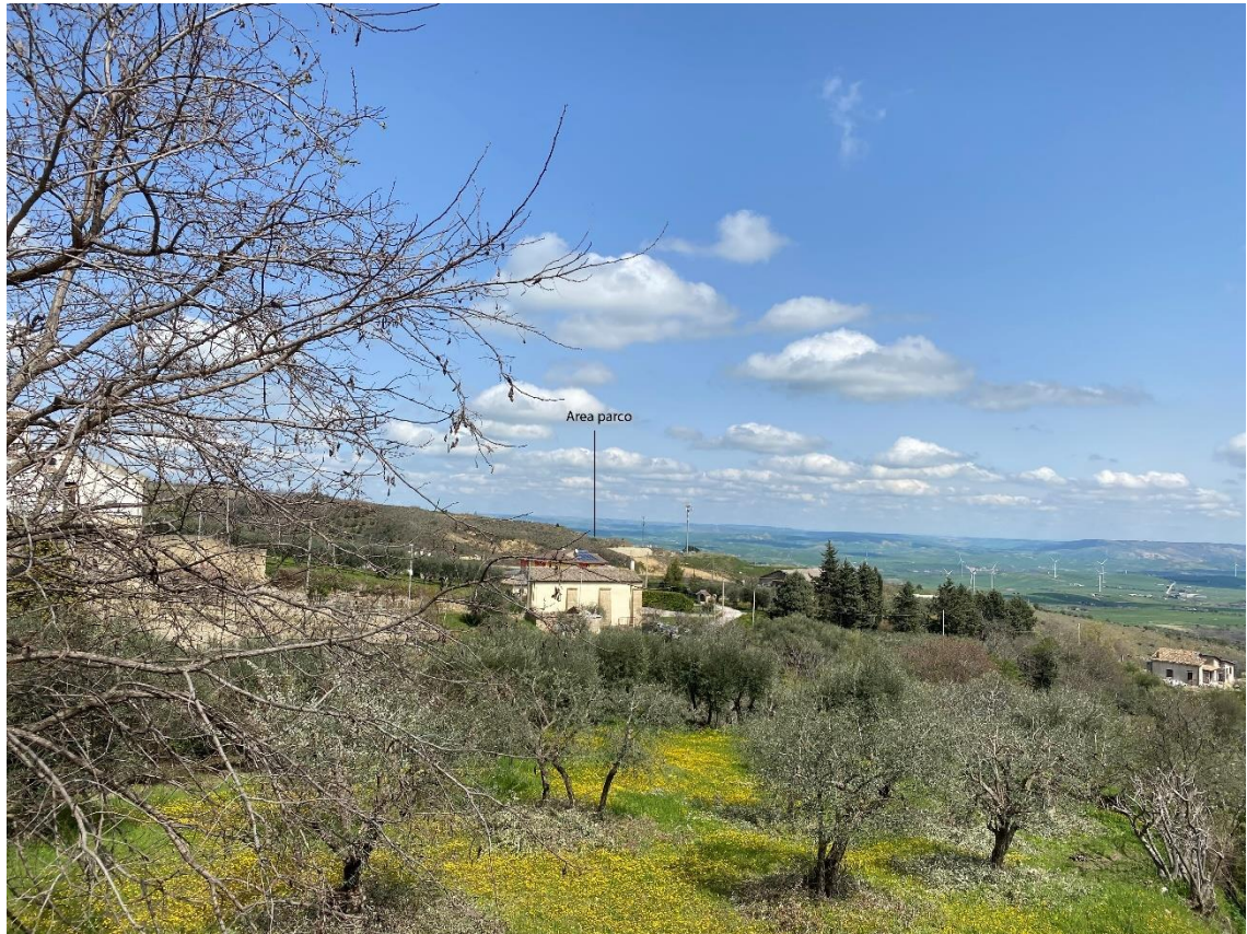
Figura 11- Ripresa fotografica Area Parchi FVT dal punto 26 “Formazioni igrofile (BP142g 008) nel Comune di Oppido “