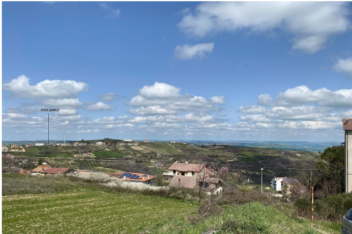
Figura 10 - Ripresa fotografica Area Parchi FVT dal punto 27 "Montrone (Oppido Lucano) – D.M. 06/07/1973 e D.M. 29/12/1994