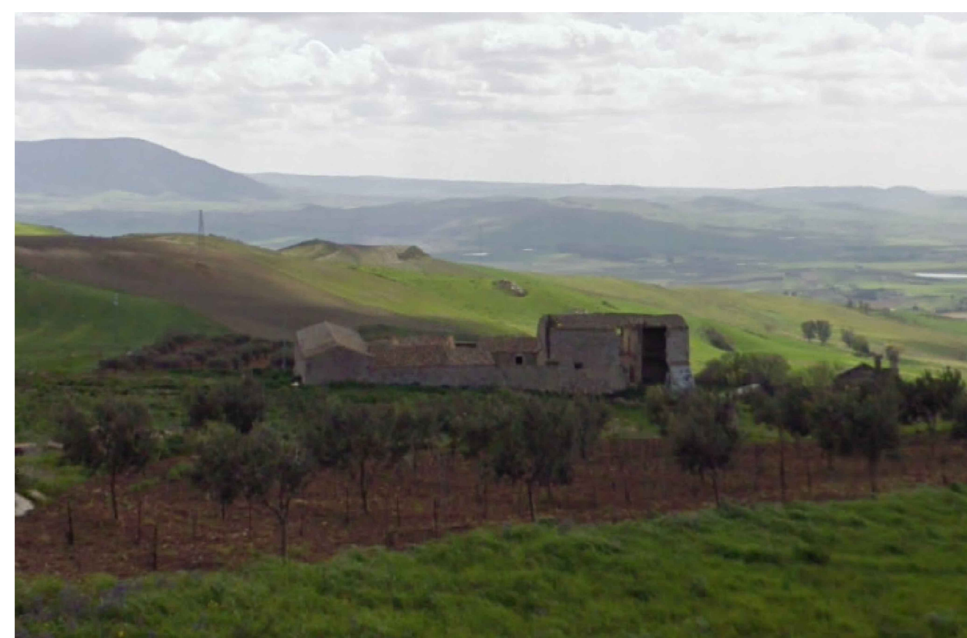
Vista da posizione 2