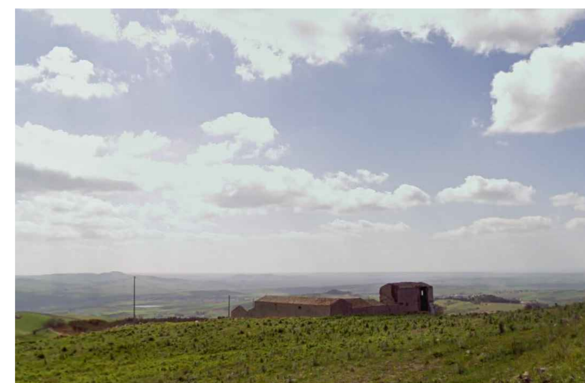
Vista da posizione 3

Il tracciato sebbene su viabilità esistente, fiancheggia il bene archeologico "Baglio Murfi" tutelato dall' art.10 D.Lgs n. 42-04. Qualora l'elettrodotto comprometta l'integrità dell'Area in esame, lo stesso può essere modificato.