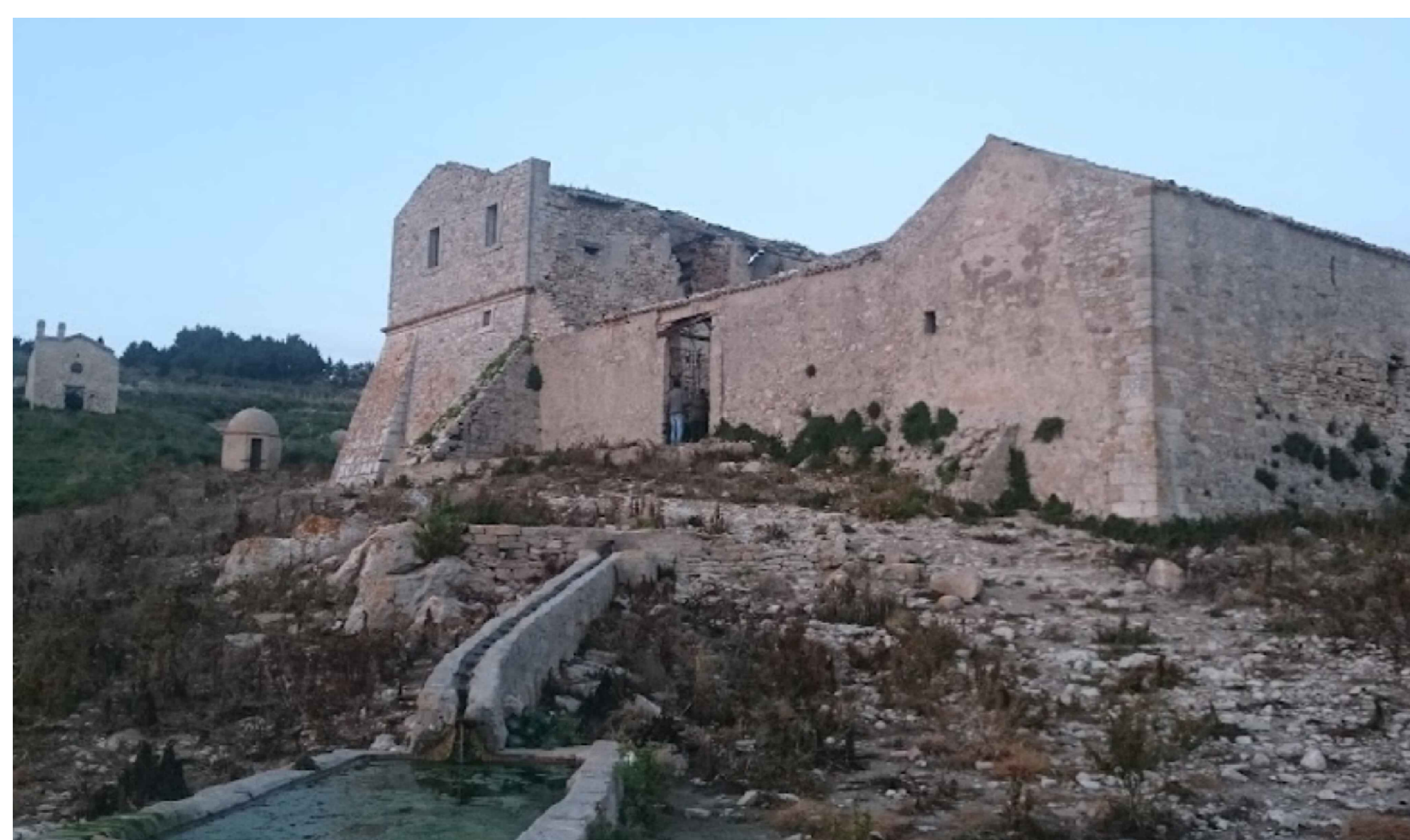
Vista da posizione 1