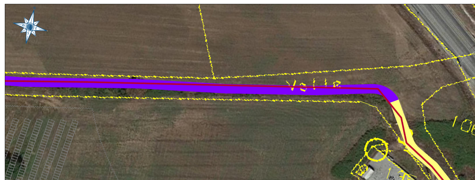
ZOOM 3 Scala 1:1.000