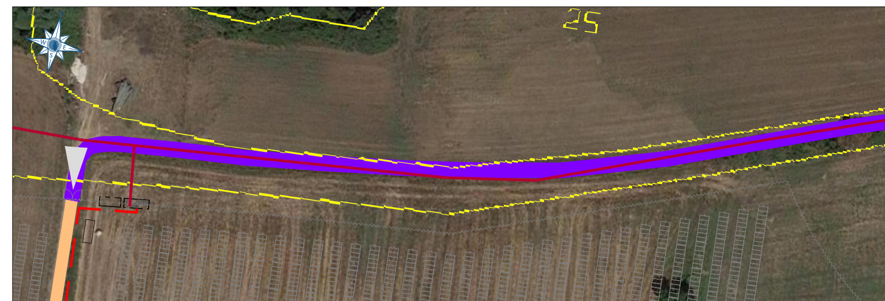
ZOOM 2 Scala 1:1.000