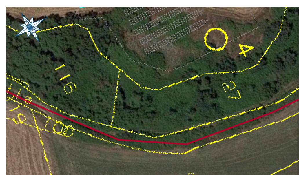
ZOOM 6 Scala 1:1.000