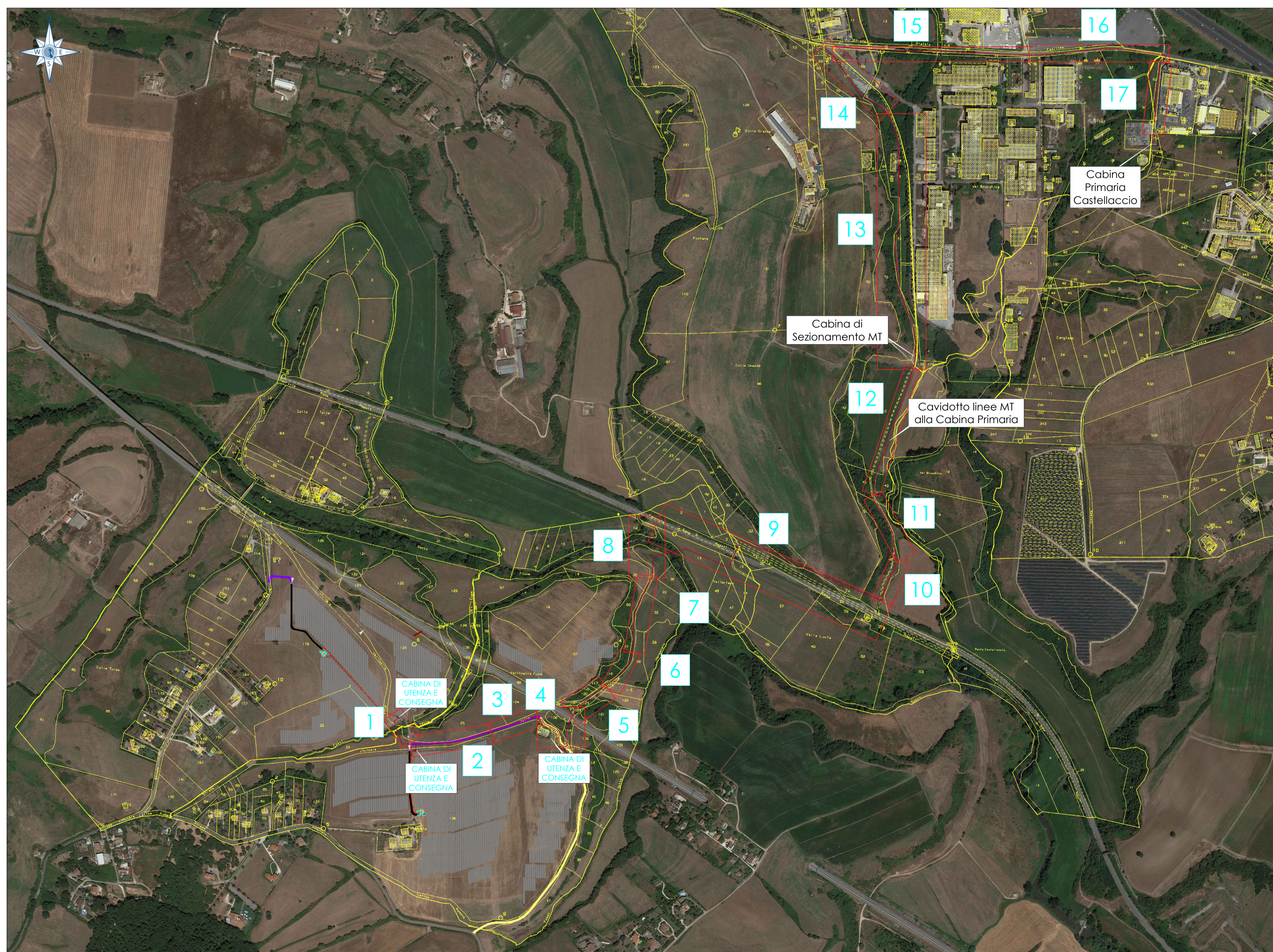
Connessione alla Cabina Primaria Scala 1:5.000