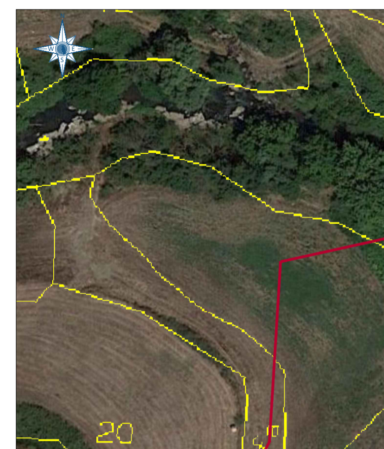
ZOOM 8 Scala 1:1.000