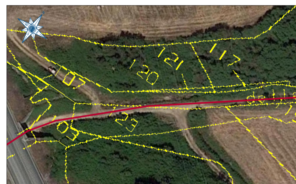
ZOOM 5 Scala 1:1.000