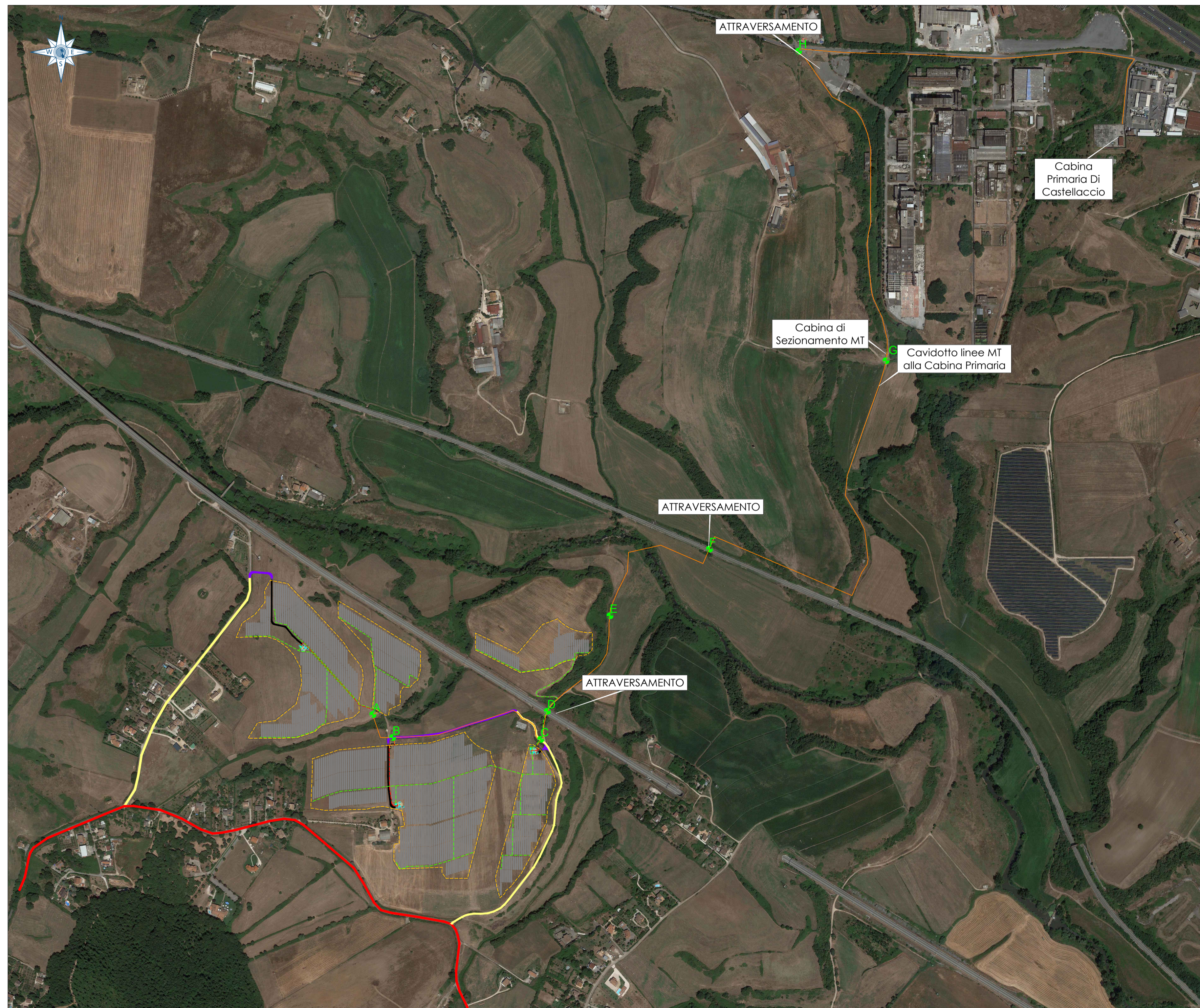
Connessione alla Cabina Primaria Scala 1:6.000

NOTA: I dettagli degli scavi possono variare in funzione della progettazione esecutiva delle opere