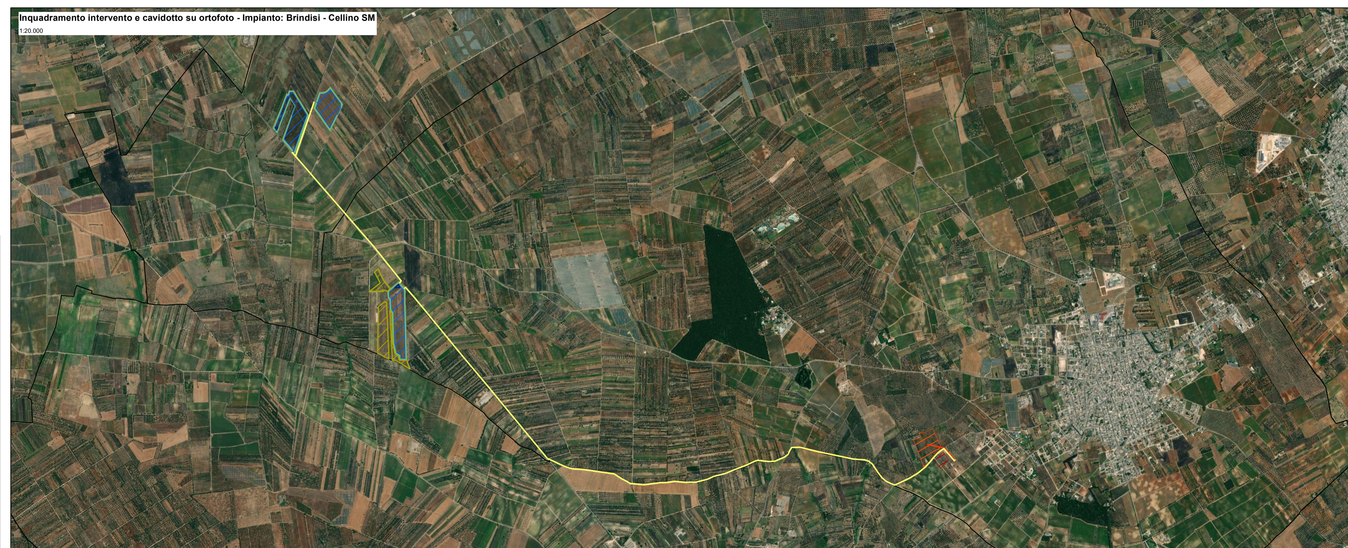
Inquadramento intervento e cavidotto su ortofoto - Impianto: Brindisi - Cellino SM 1:20.000