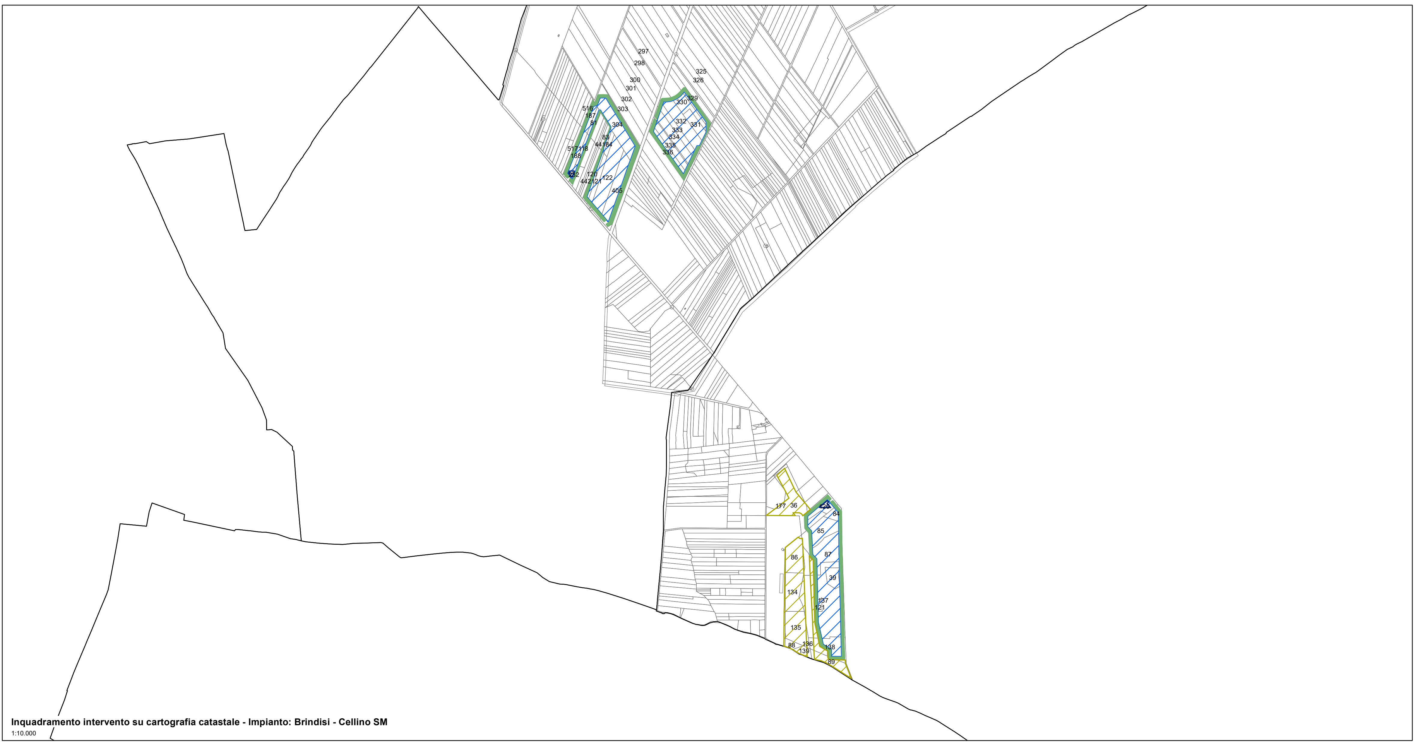
Inquadramento intervento su cartografia catastale - Impianto: Brindisi - Cellino SM 1:10.000