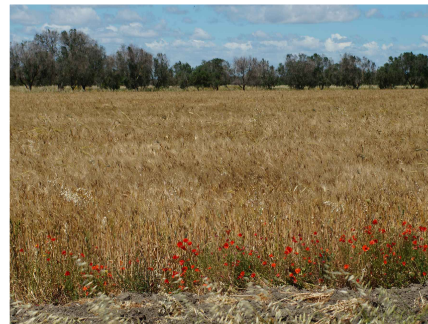
Inquadratura 5: Stato di fatto.