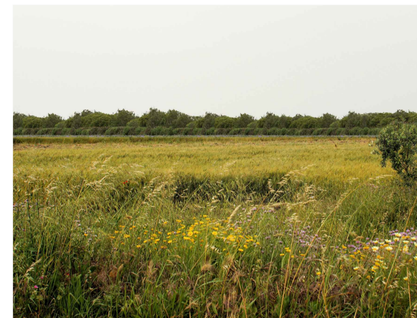
Inquadratura 4: Stato di progetto.