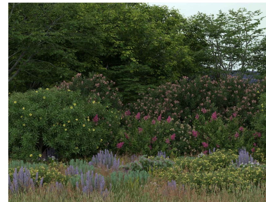
Inquadratura 5: Stato di fatto