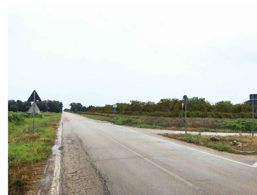
Inquadratura 6: Stato di progetto.