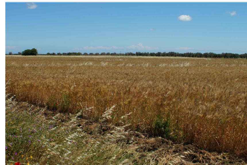
Inquadratura 3: Stato di fatto.