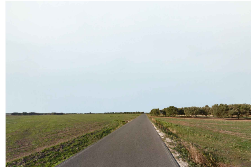
Inquadratura 2: Stato di fatto.