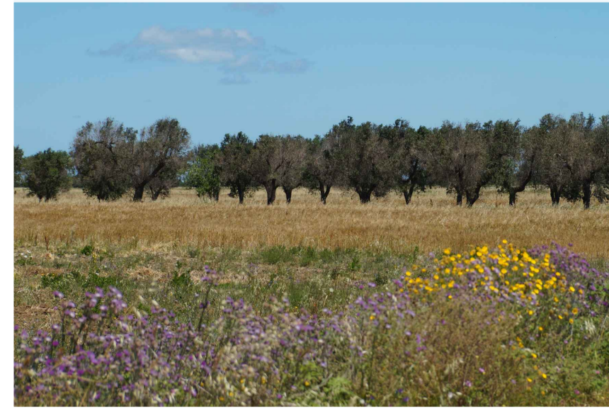
Inquadratura 1: Stato di fatto.