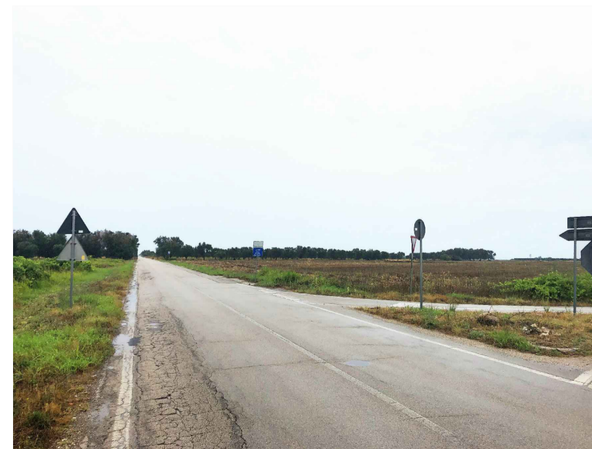
Inquadratura 6: Stato di fatto.