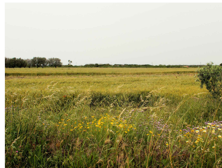
Inquadratura 4: Stato di fatto.