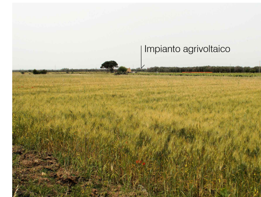
Inquadratura 4: Stato di progetto.