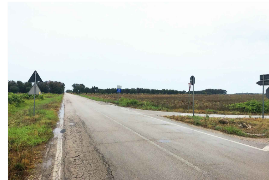
Inquadratura 3: Stato di fatto.