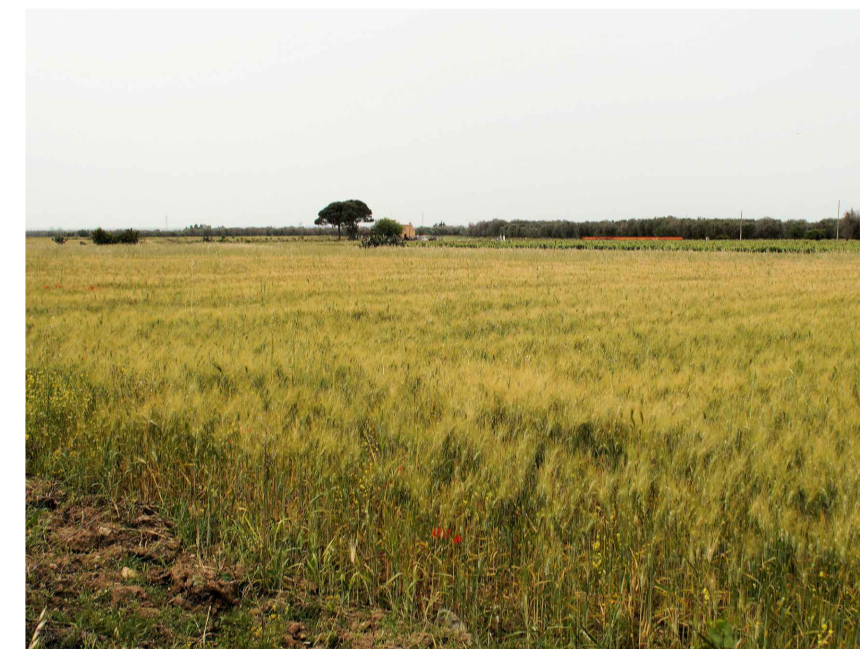
Inquadratura 4: Stato di fatto.