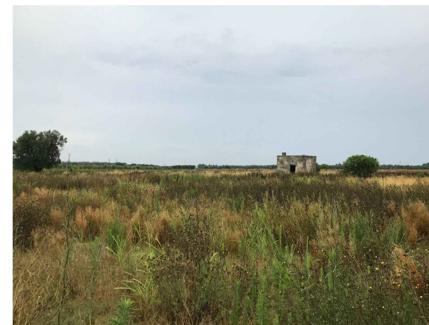
Inquadratura 6: Stato di fatto.