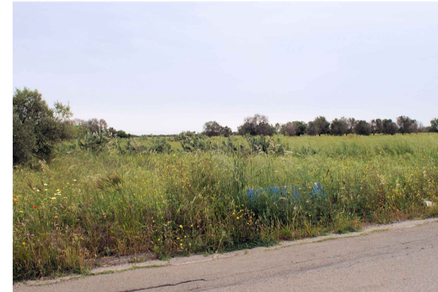
Inquadratura 2: Stato di fatto.