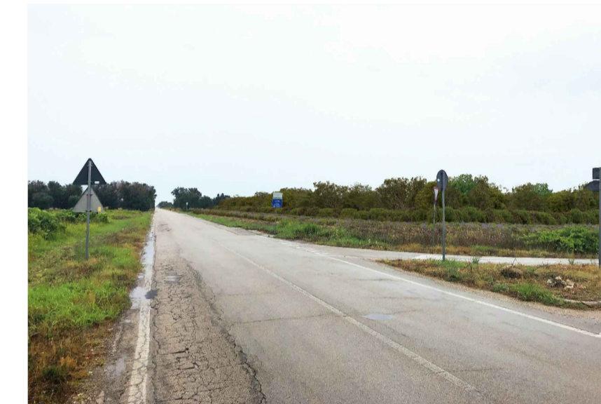
Inquadratura 3: Stato di progetto.