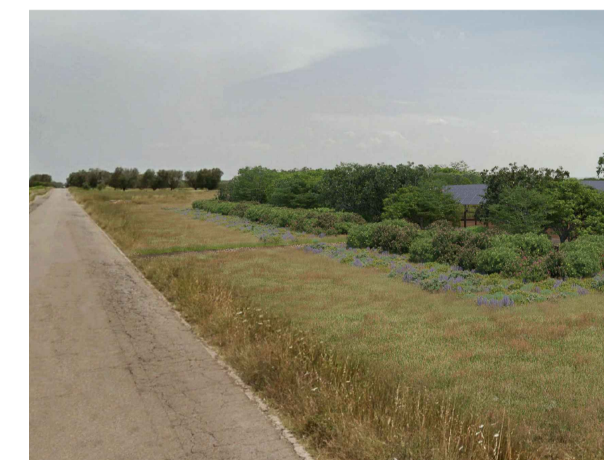
Inquadratura 5: Stato di fatto