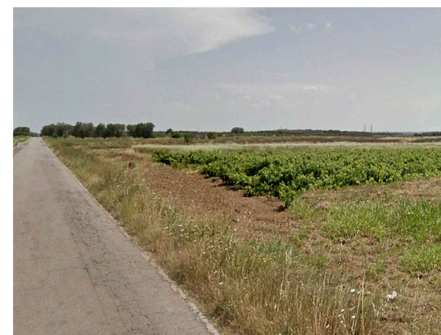
Inquadratura 5: Stato di fatto.