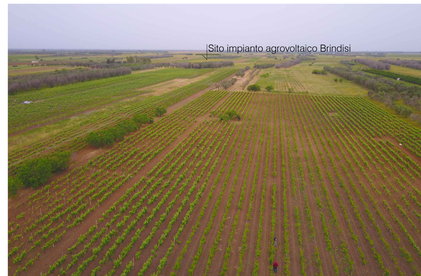
Sito 2: Masseria Esperti Nuovi. Stato di Progetto