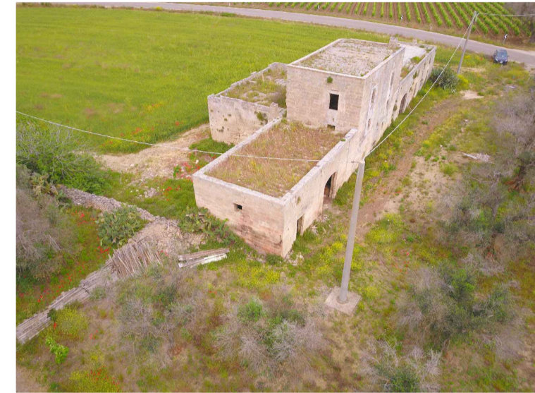
Sito 1: Masseria Camardella Vista 2