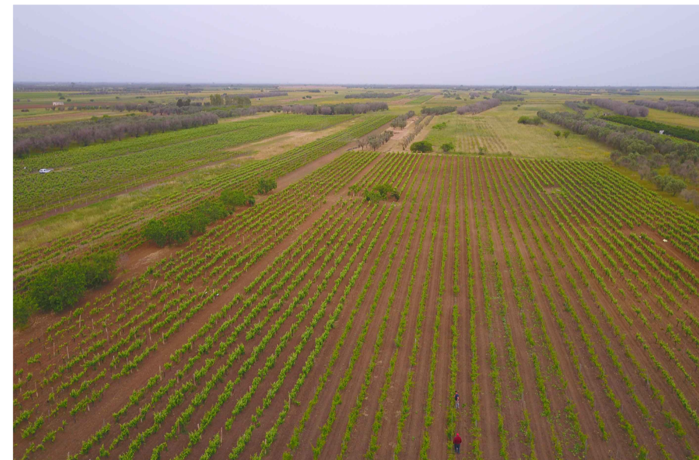
Sito 2: Masseria Esperti Nuovi. Stato di Fatto