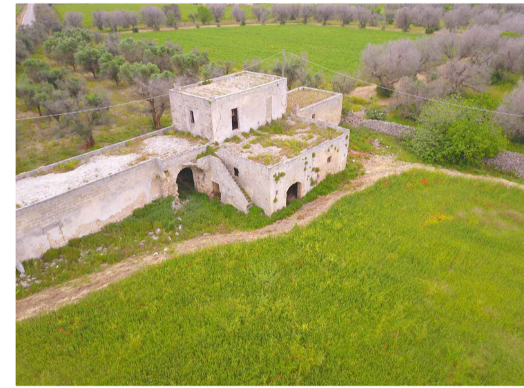
Sito 1: Masseria Camardella Vista 3