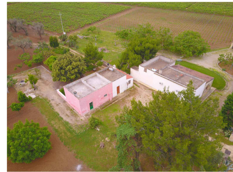
Sito 2: Masseria Esperti Nuovi Vista 2