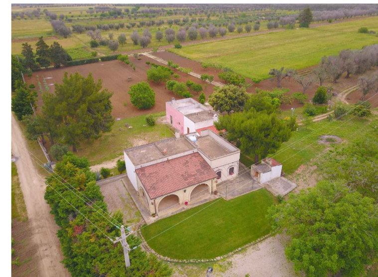
Sito 2: Masseria Esperti Nuovi Vista 3