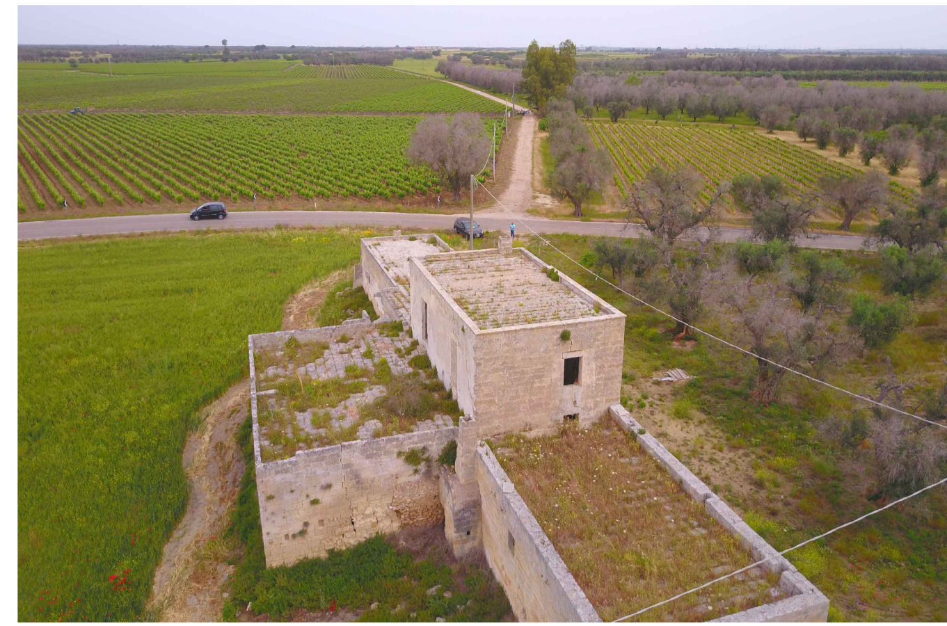
Sito 1: Masseria Camardella. Stato di Fatto