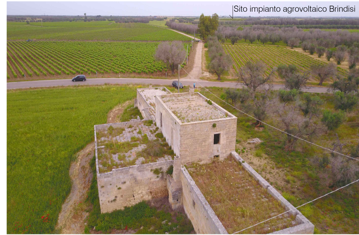
Sito 1: Masseria Camardella. Stato di Progetto