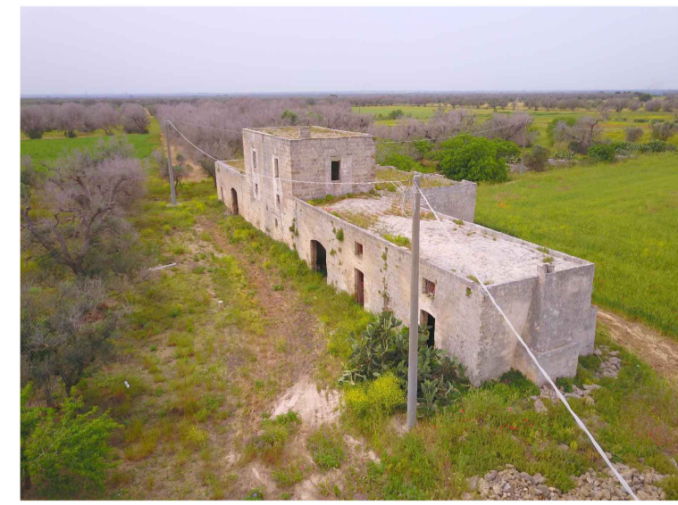
Sito 1: Masseria Camardella Vista 1