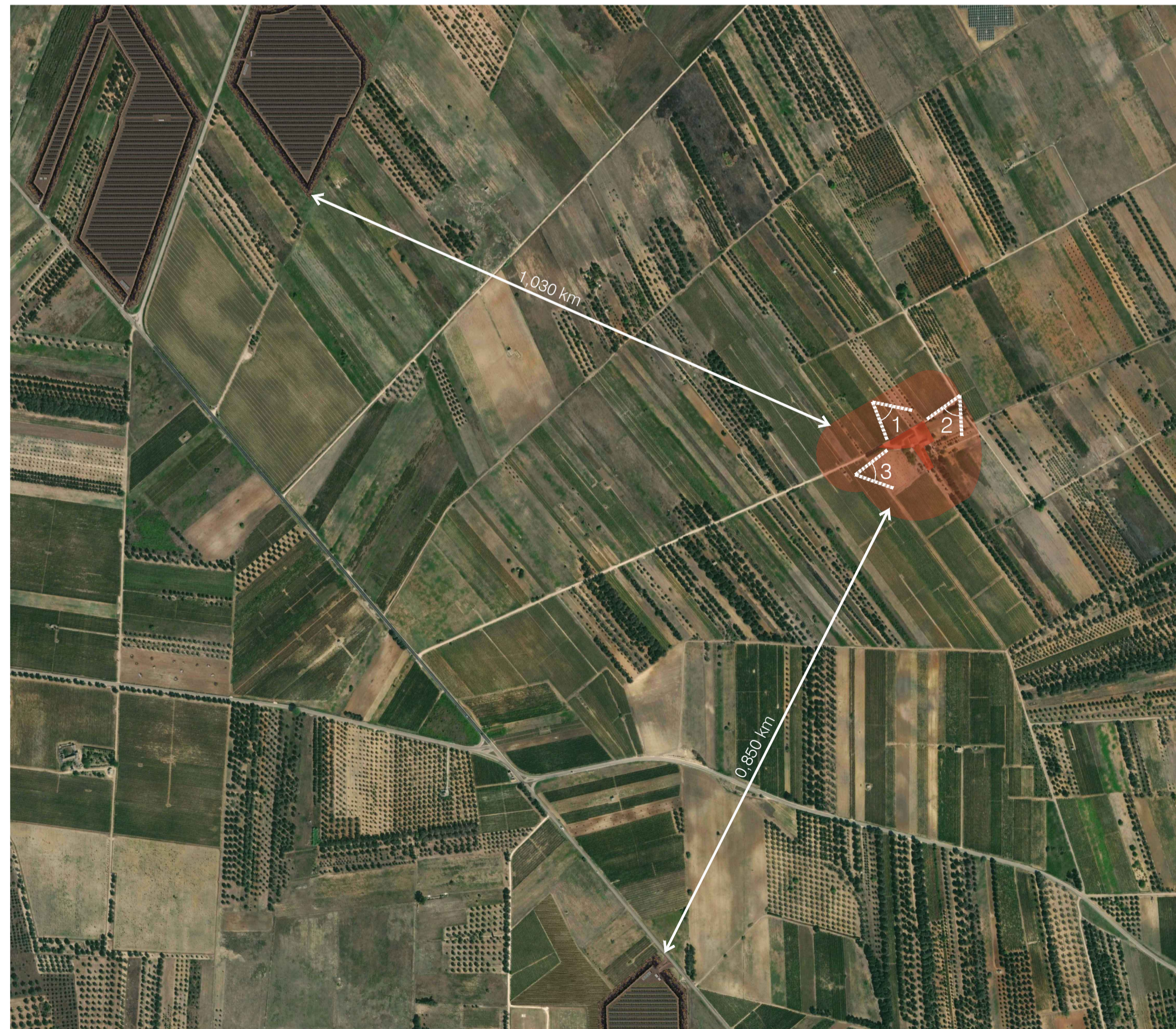
Ortotofo Sito 2: Masseria Esperti Nuovi