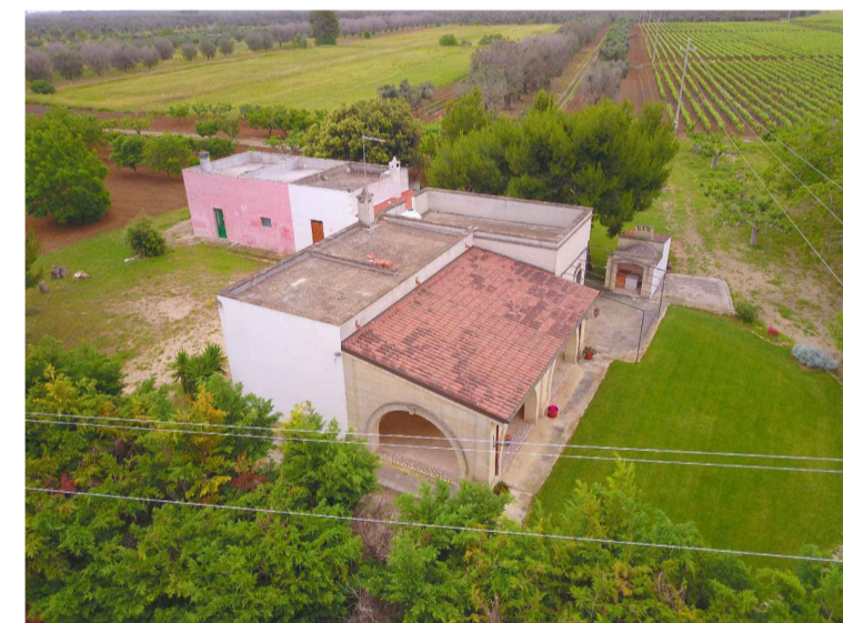
Sito 2: Masseria Esperti Nuovi Vista 1