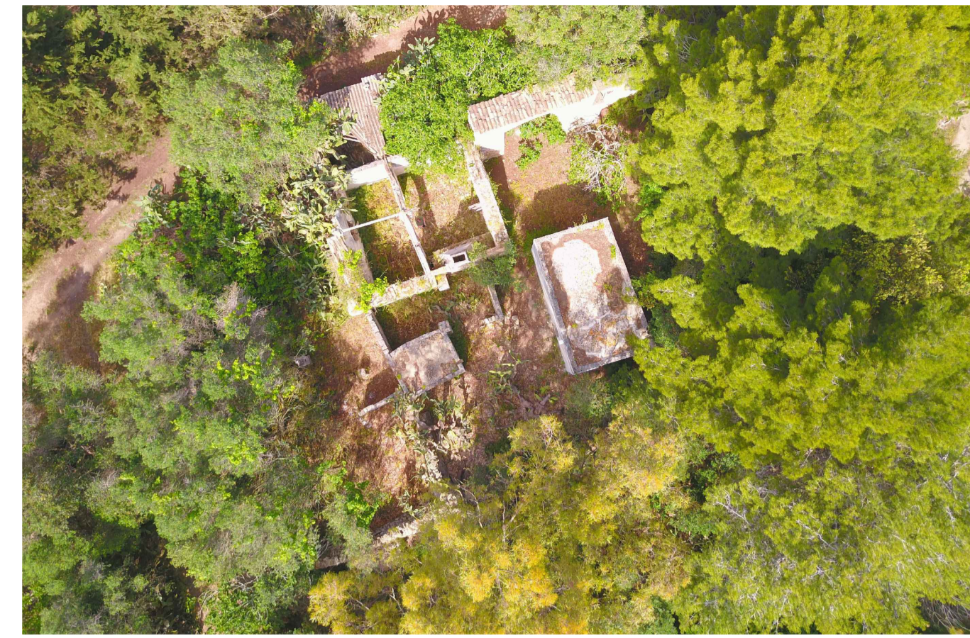
Sito 3: Masseria Annano. Stato di Fatto

Non è presente il foto-inserimento di progetto in quanto dal bene non è traguardabile l'impianto agro-voltaico a causa della fitta vegetazione.