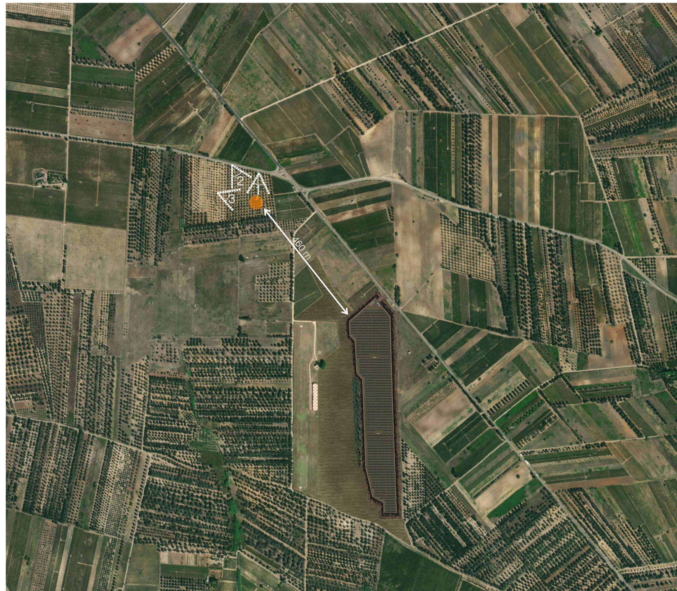
Ortofoto Sito 4: Masseria Esperti