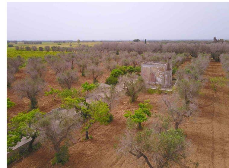
Sito 4: Masseria Esperti Vista 2