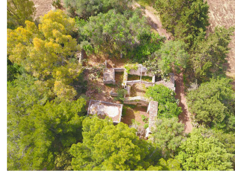
Sito 3: Masseria Annano Vista 2