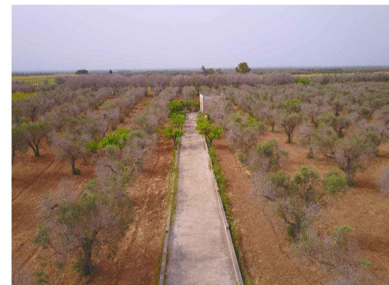
Sito 4: Masseria Esperti Vista 1