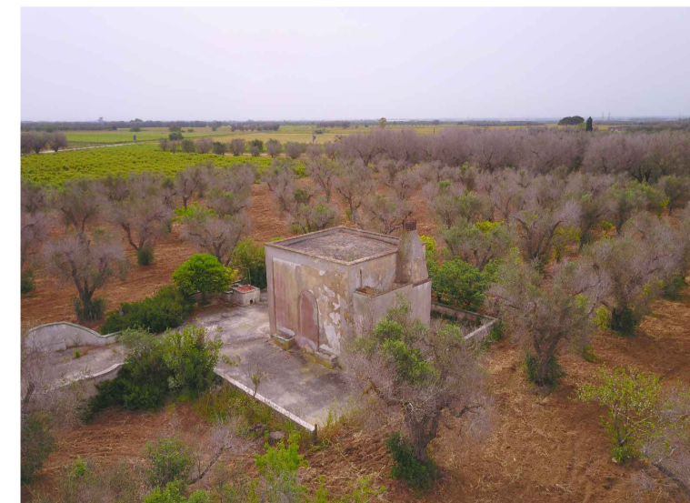
Sito 4: Masseria Esperti Vista 3