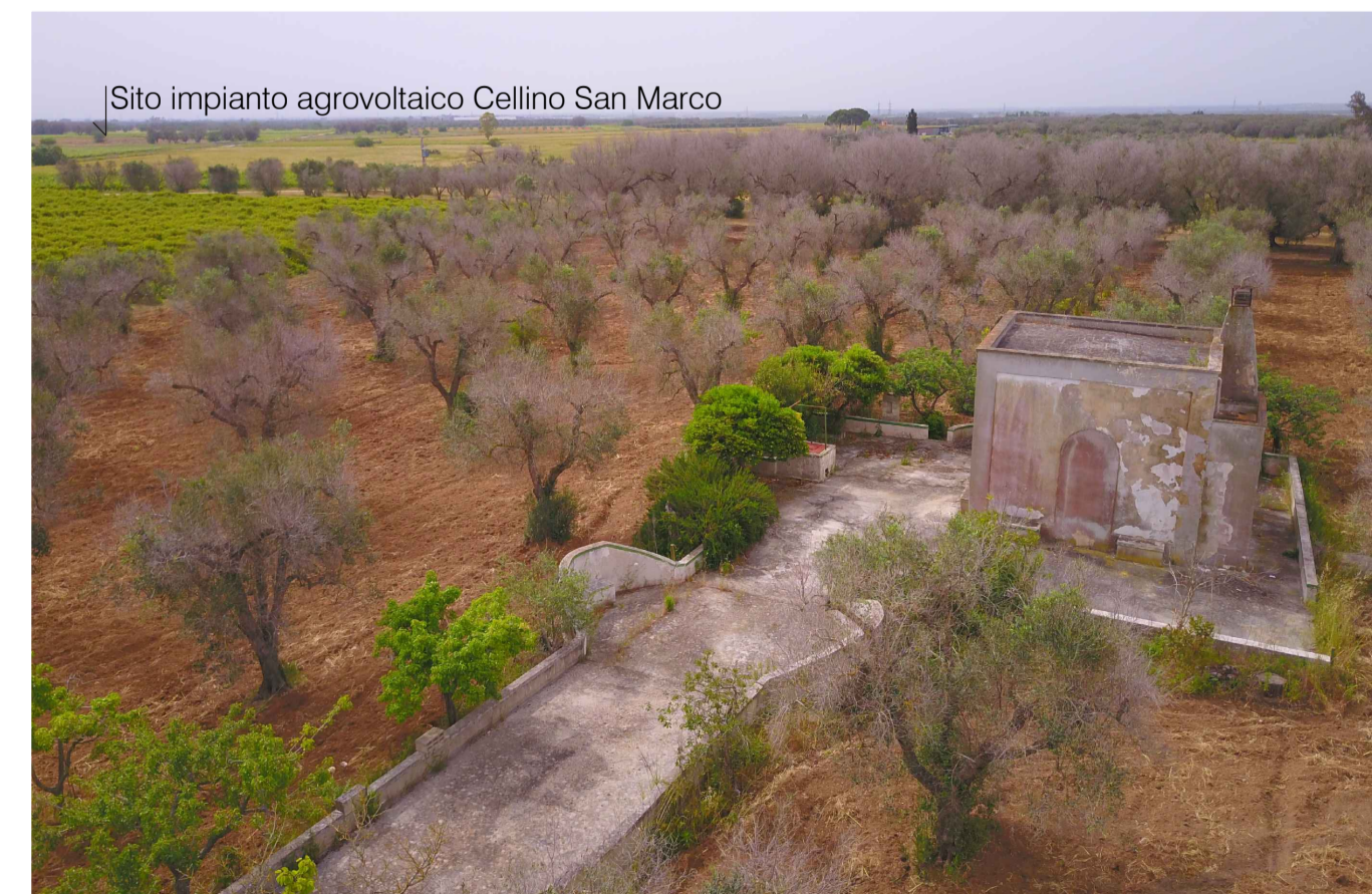
Sito 4: Masseria Esperti. Stato di Progetto