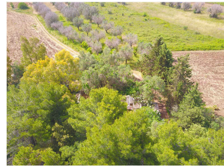
Sito 3: Masseria Annano Vista 1