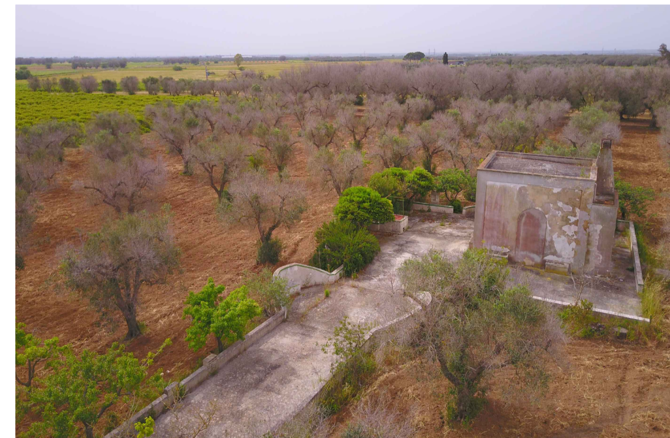
Sito 4: Masseria Esperti. Stato di Fatto