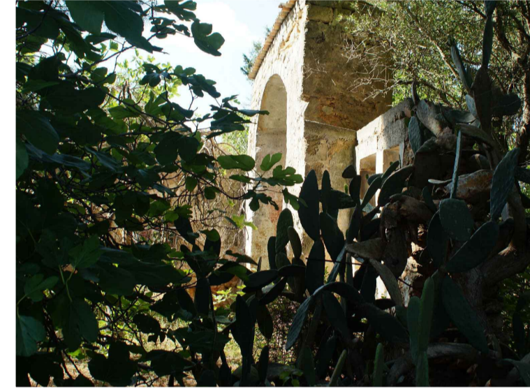
Sito 3: Masseria Annano Vista 3