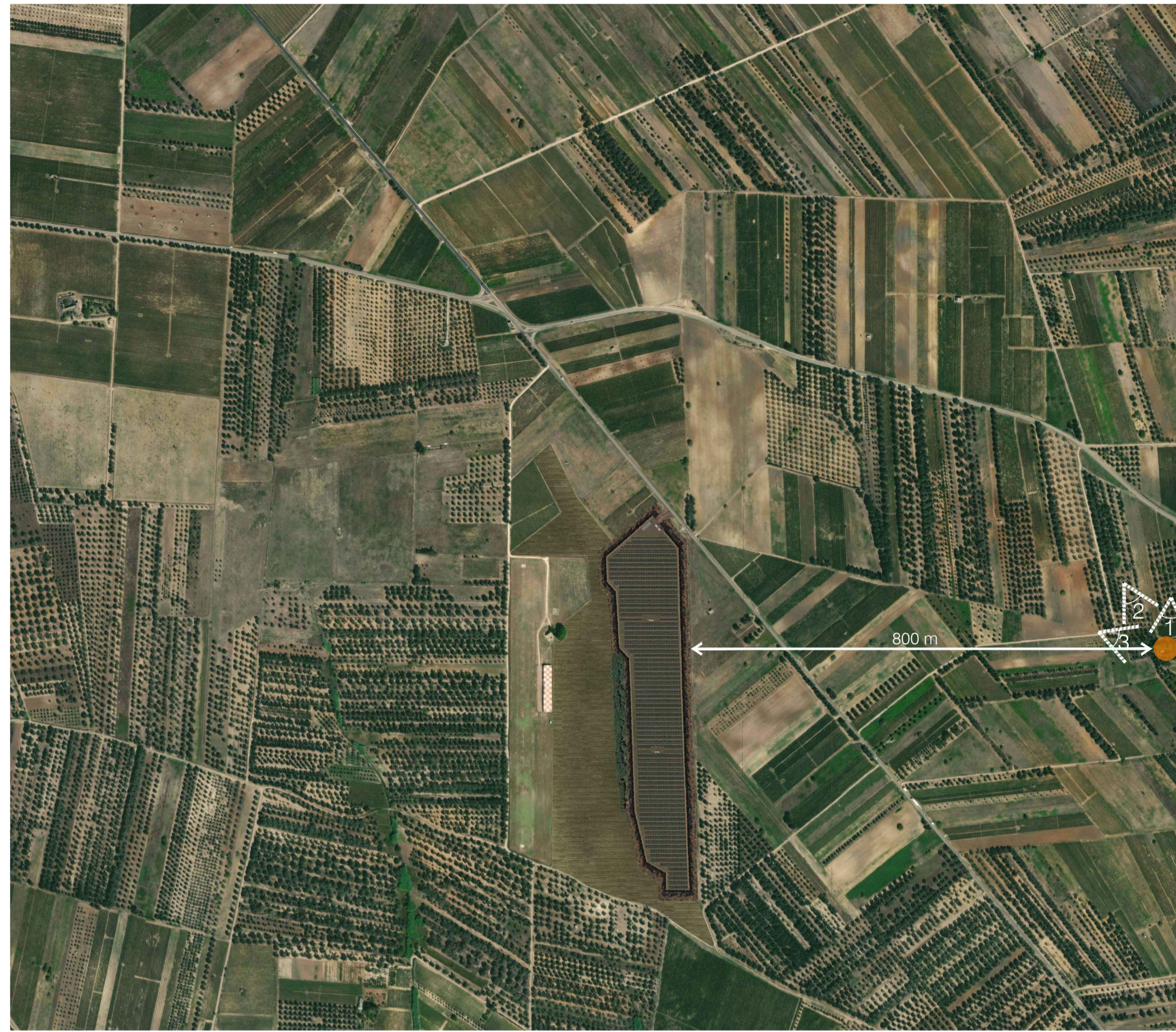
Ortofoto Sito 3: Masseria Annano