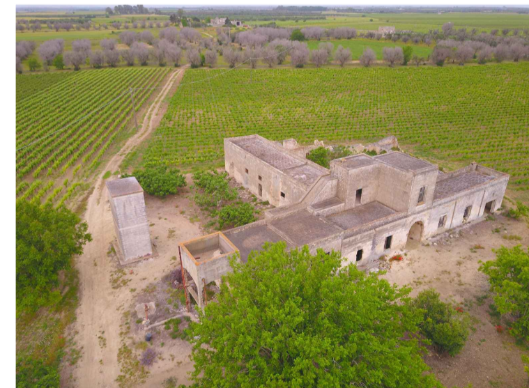
Sito 5: Masseria Camarda Vista 2