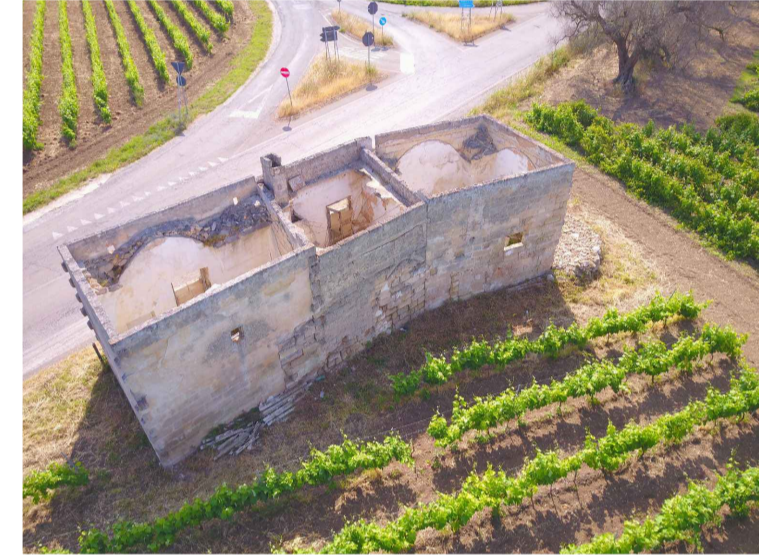
Sito 4Bis: Masseria Esperti Vecchi Vista 3