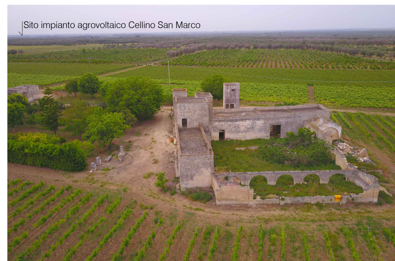
Sito 5: Masseria Camarda. Stato di Progetto