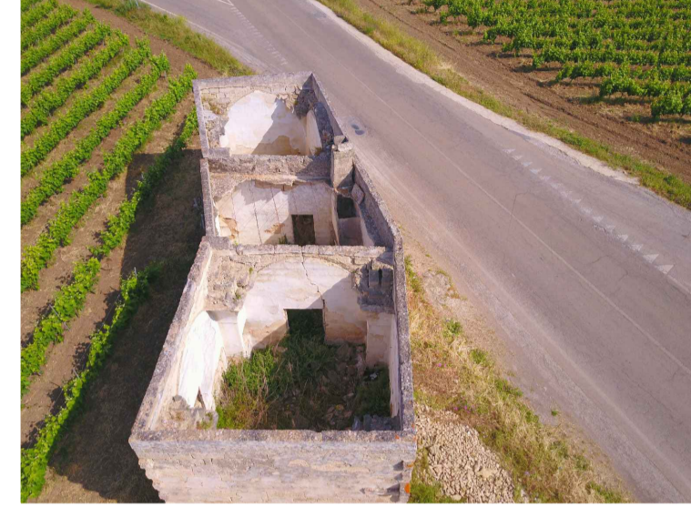
Sito 4Bis: Masseria Esperti Vecchi Vista 2