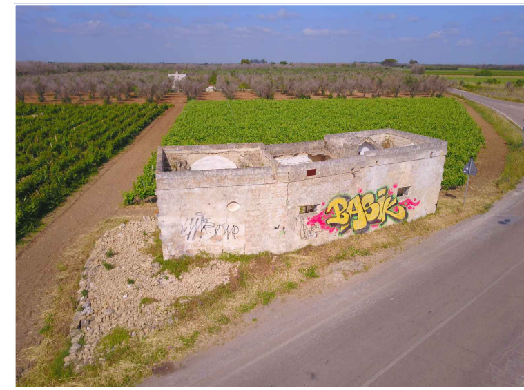
Sito 4Bis: Masseria Esperti Vecchi Vista 1