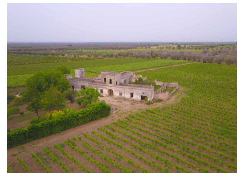
Sito 5: Masseria Camarda Vista 1