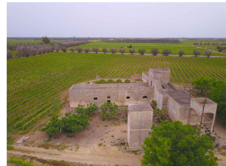
Sito 5: Masseria Camarda Vista 3