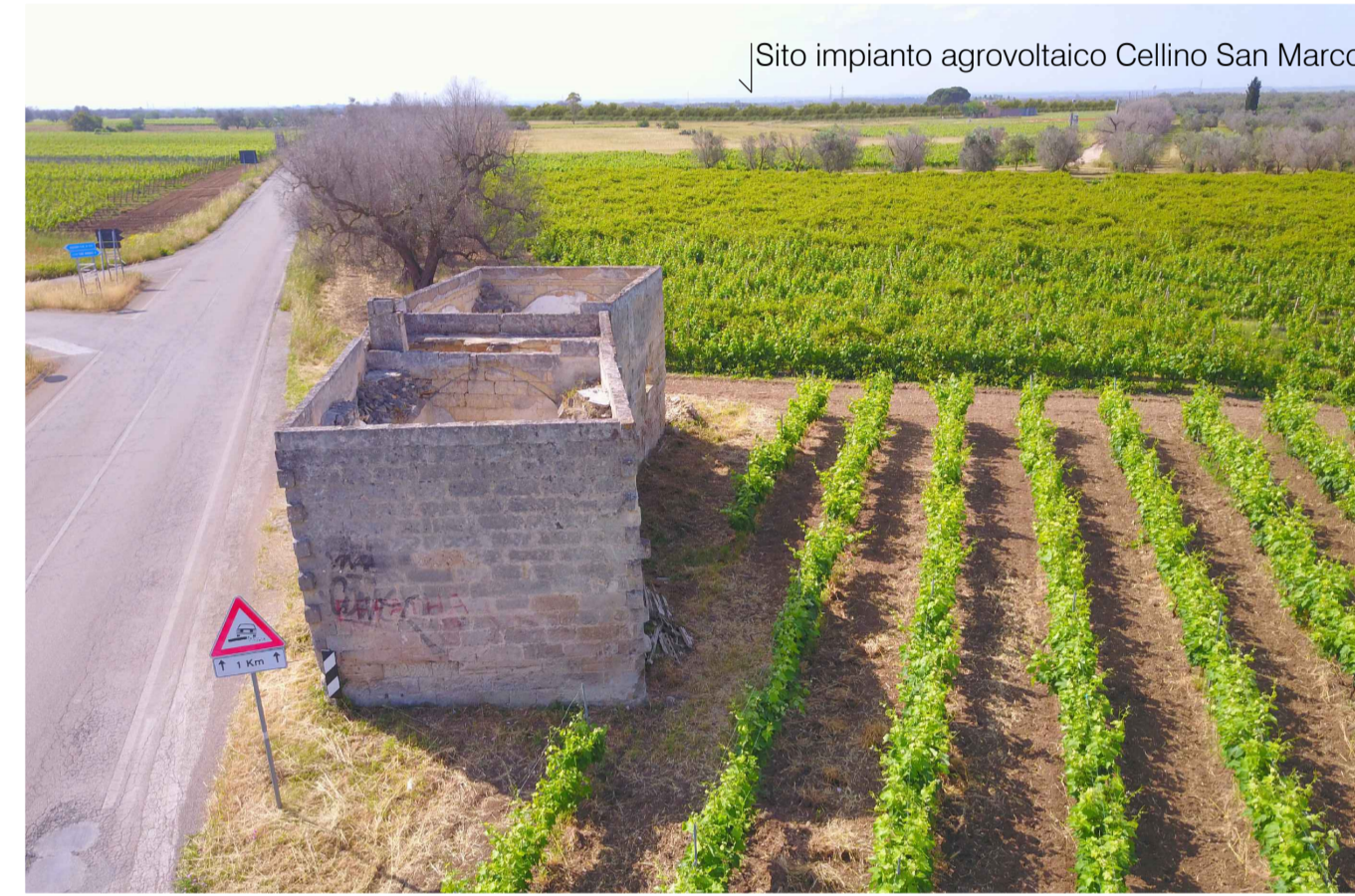
Sito 4Bis: Masseria Esperti Vecchi. Stato di Progetto