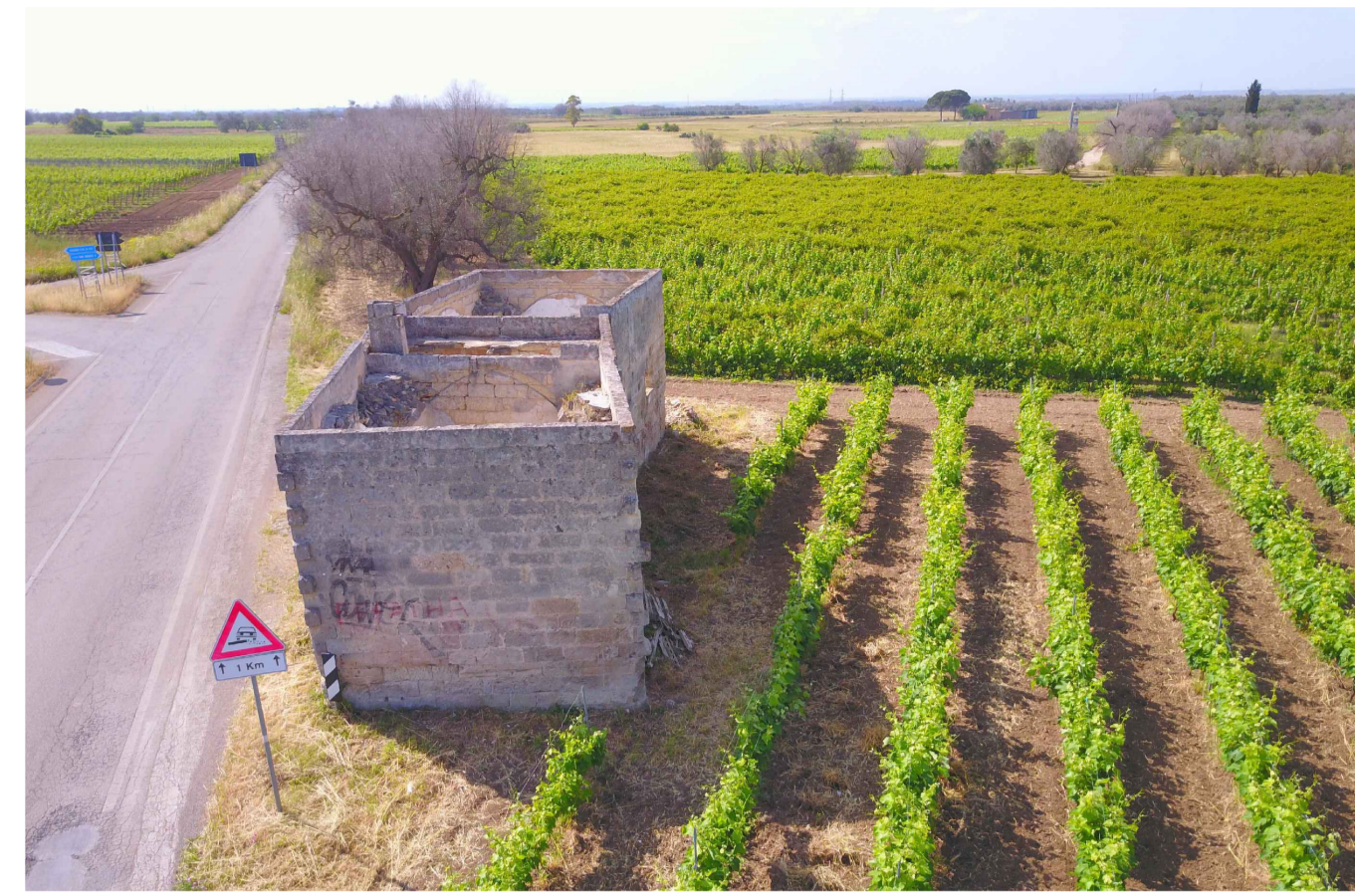
Sito 4Bis: Masseria Esperti Vecchi. Stato di Fatto