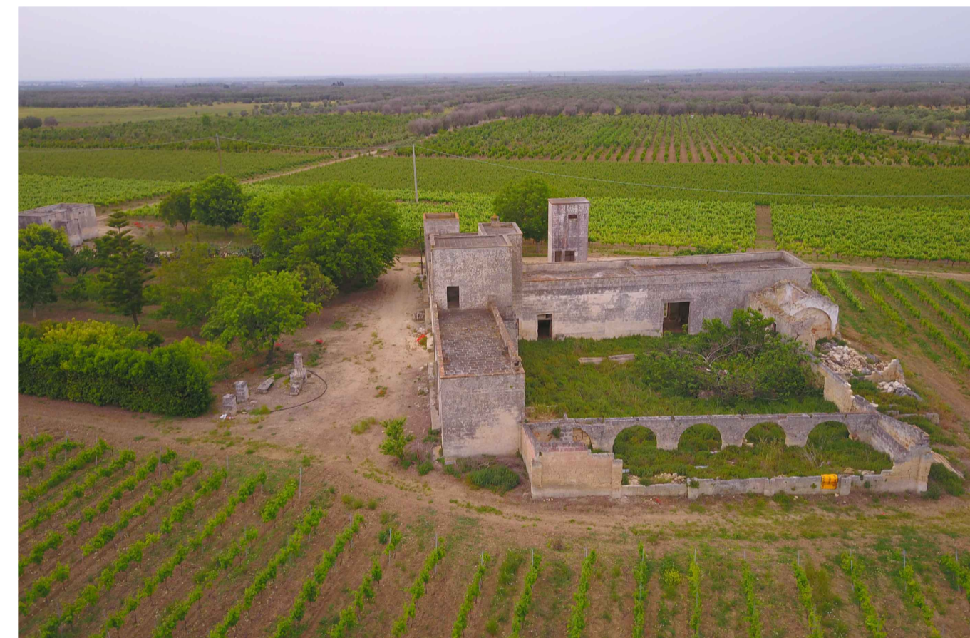
Sito 5: Masseria Camarda. Stato di Fatto