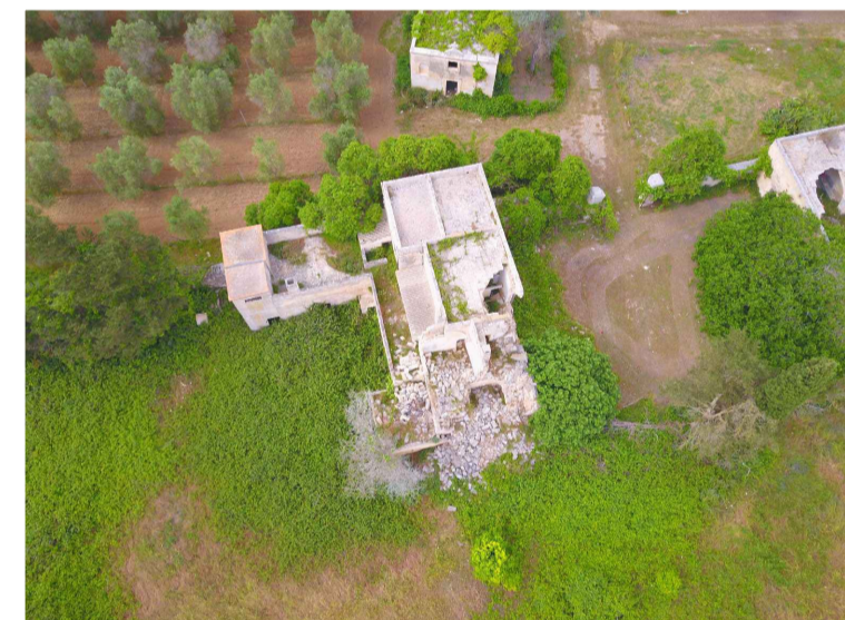
Sito 7: Masseria Monticello Vista 1