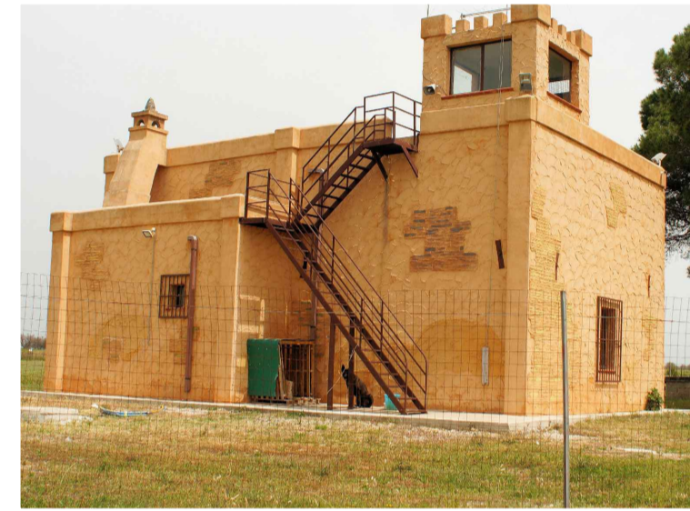
Sito 6: Torre Aviosuperficie Vista 3