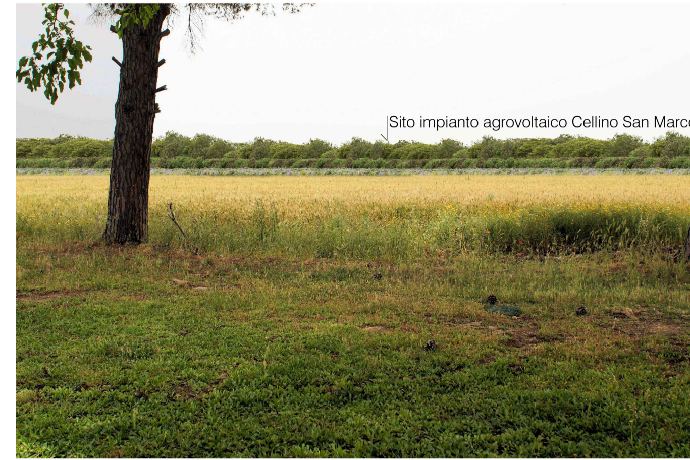
Sito 6: Torre Aviosuperficie. Stato di Progetto