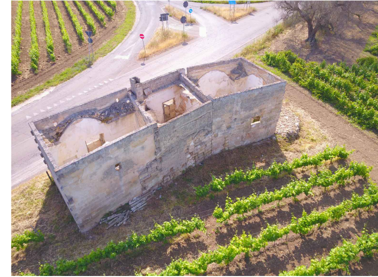
Sito 4Bis: Masseria Esperti Vecchi Vista 3