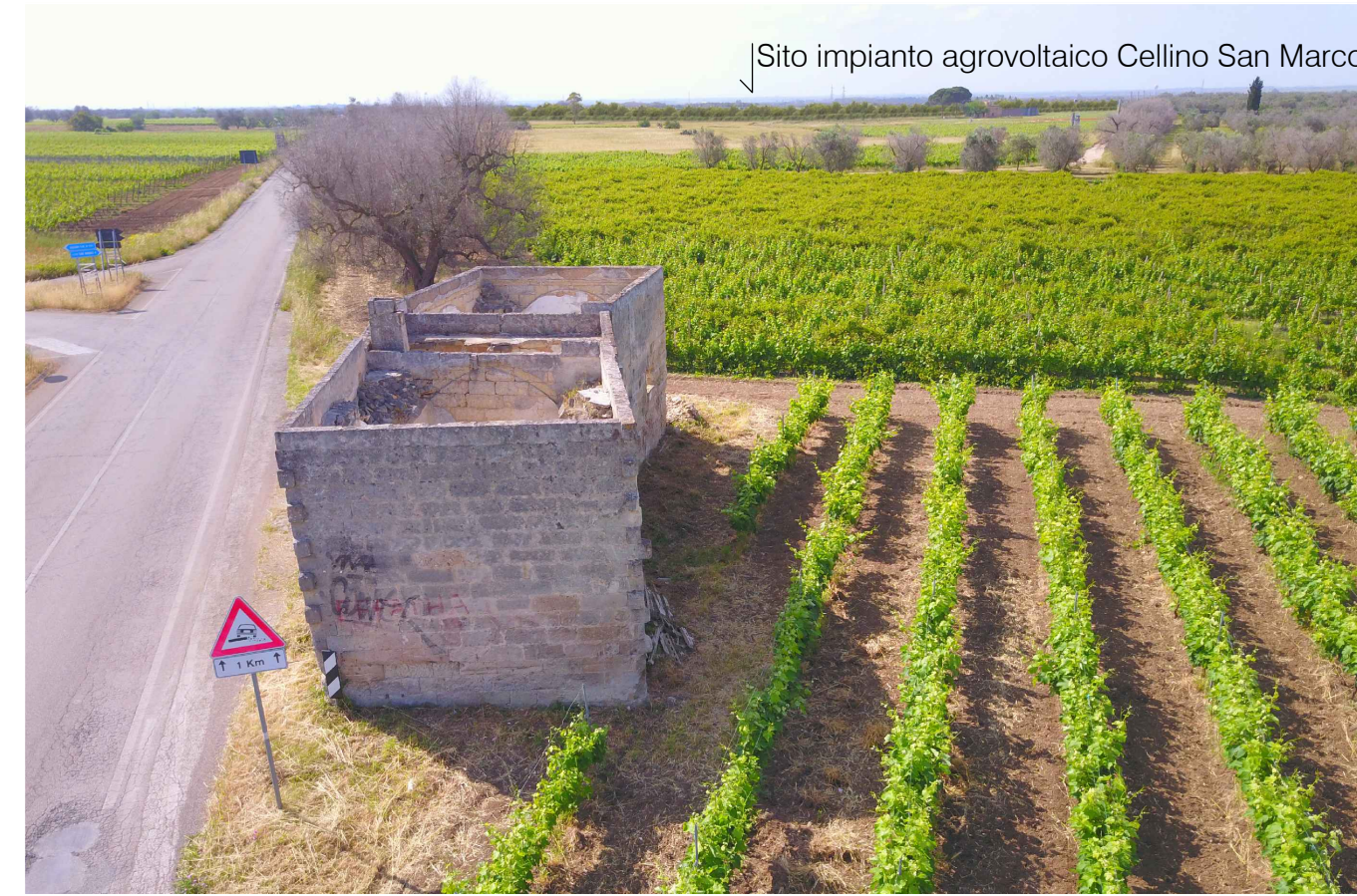
Sito 4Bis: Masseria Esperti Vecchi. Stato di Progetto