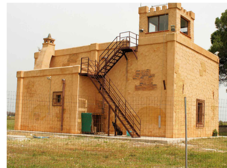
Sito 6: Torre Aviosuperficie Vista 3