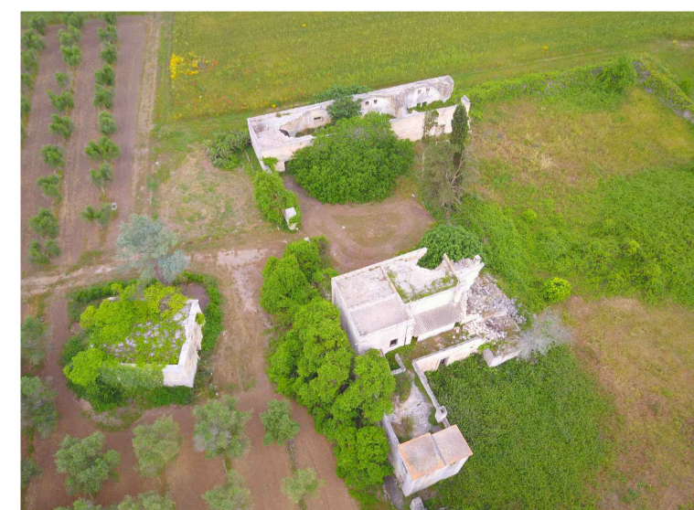
Sito 7: Masseria Monticello Vista 3