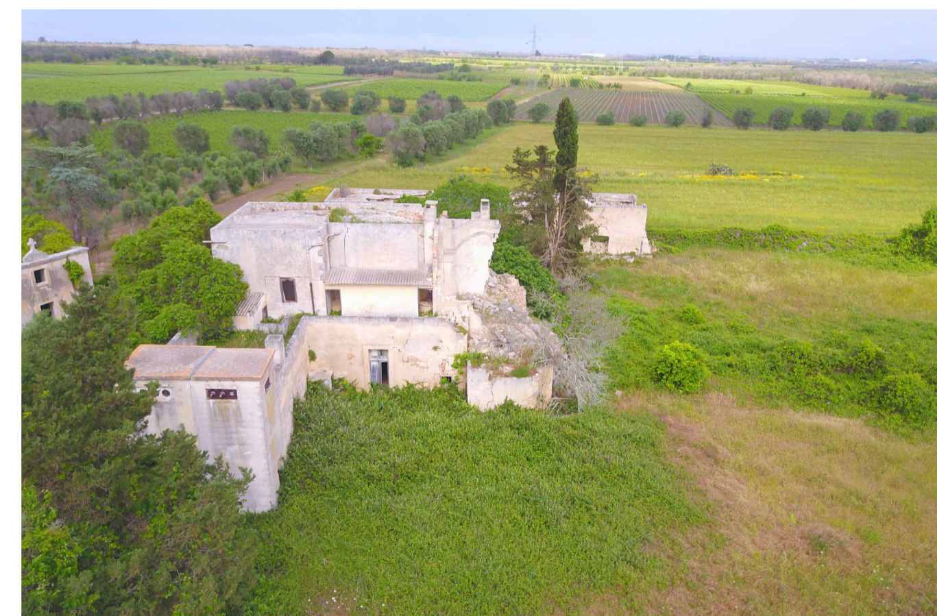
Sito 7: Masseria Monticello. Stato di Fatto