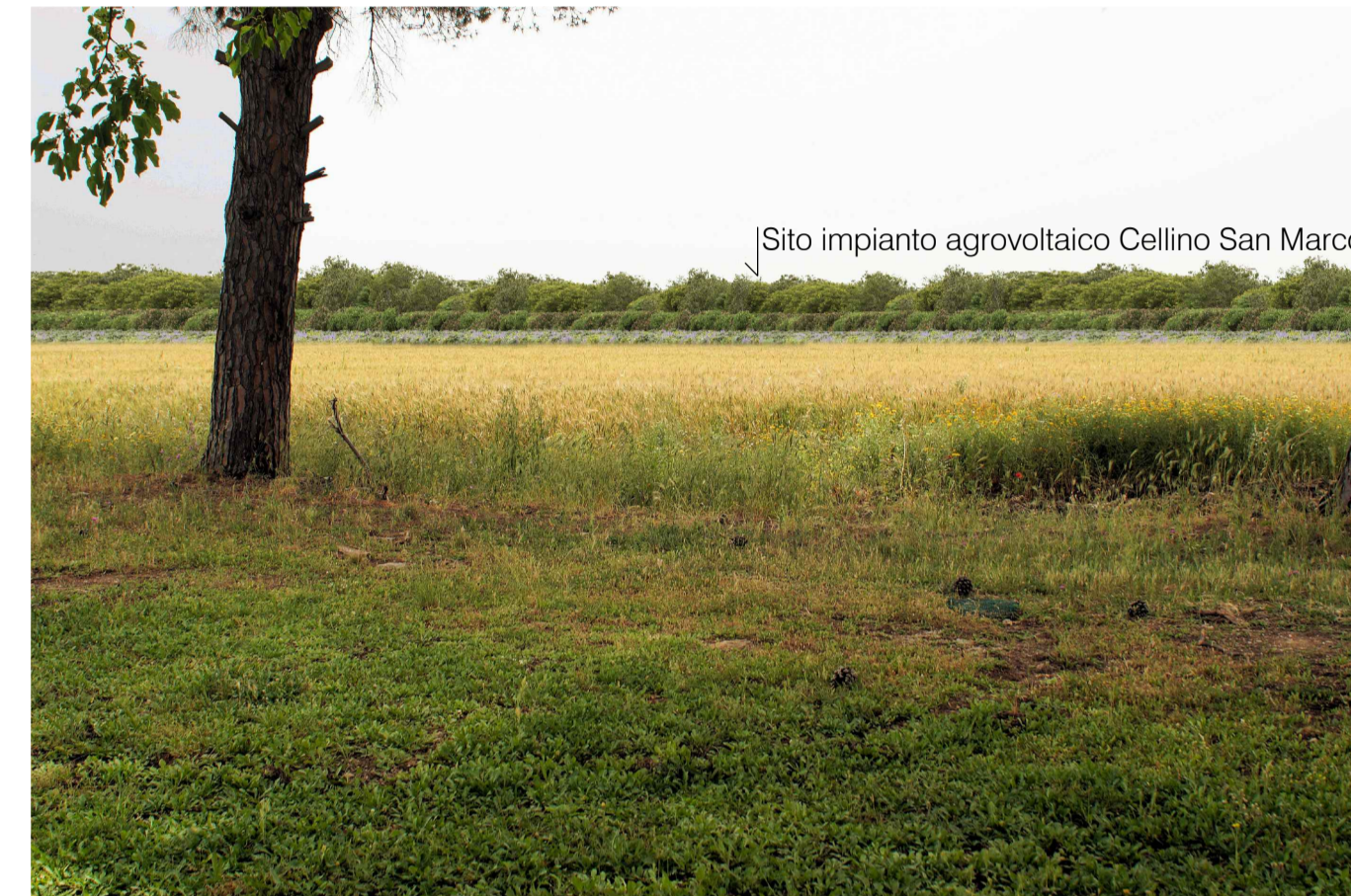
Sito 6: Torre Aviosuperficie. Stato di Progetto