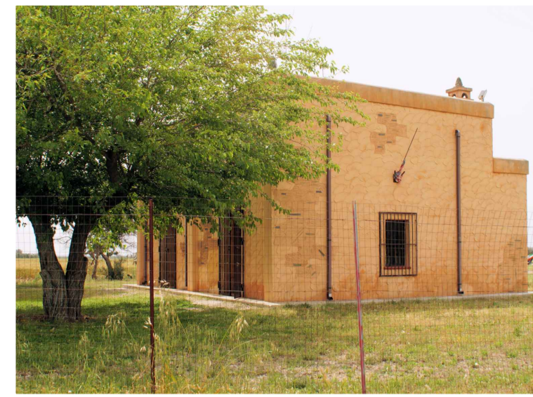
Sito 6: Torre Aviosuperficie Vista 1