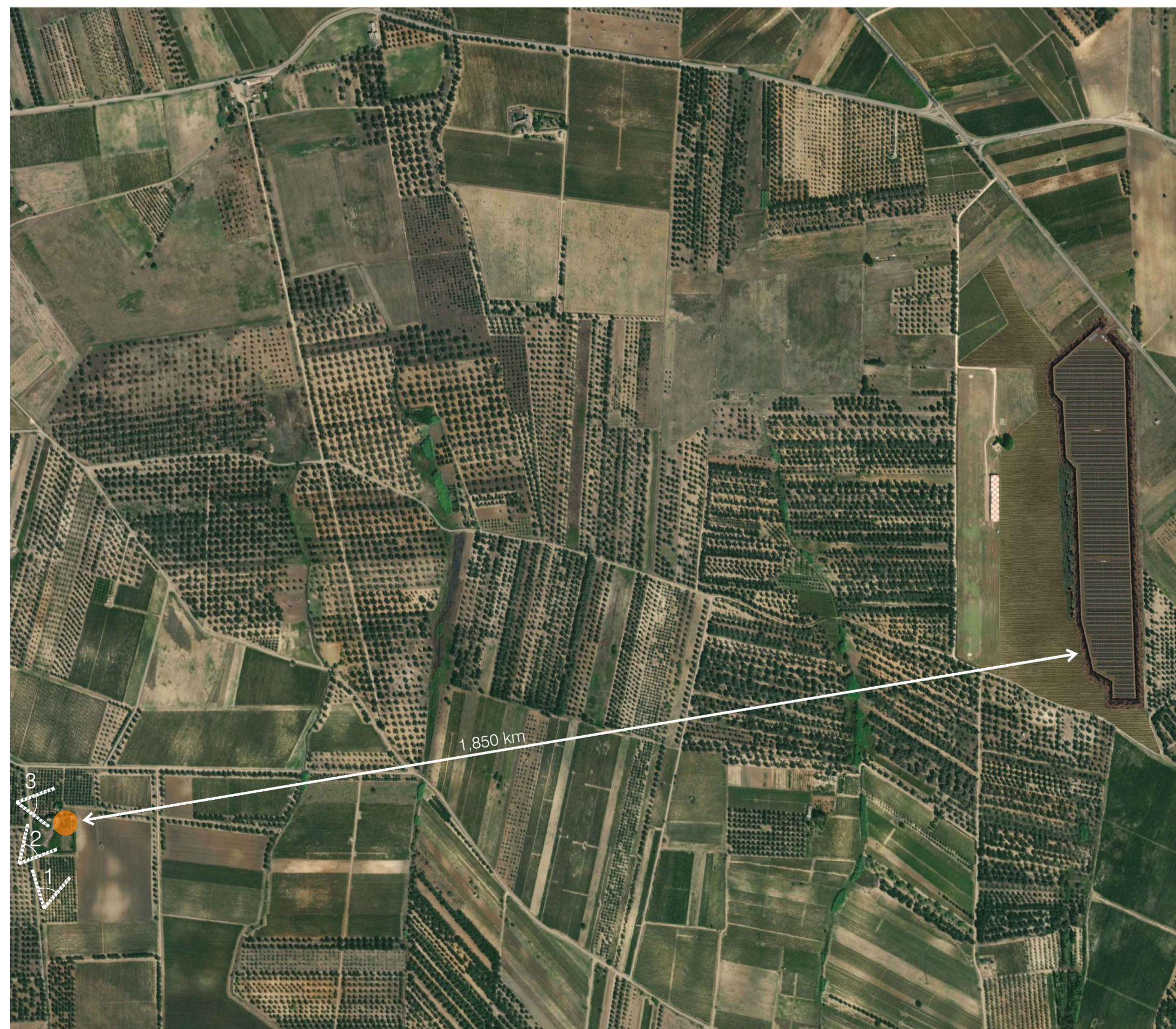
Ortofoto Sito 7: Monticello