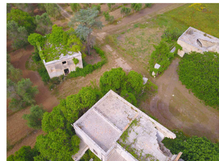
Sito 7: Masseria Monticello Vista 2