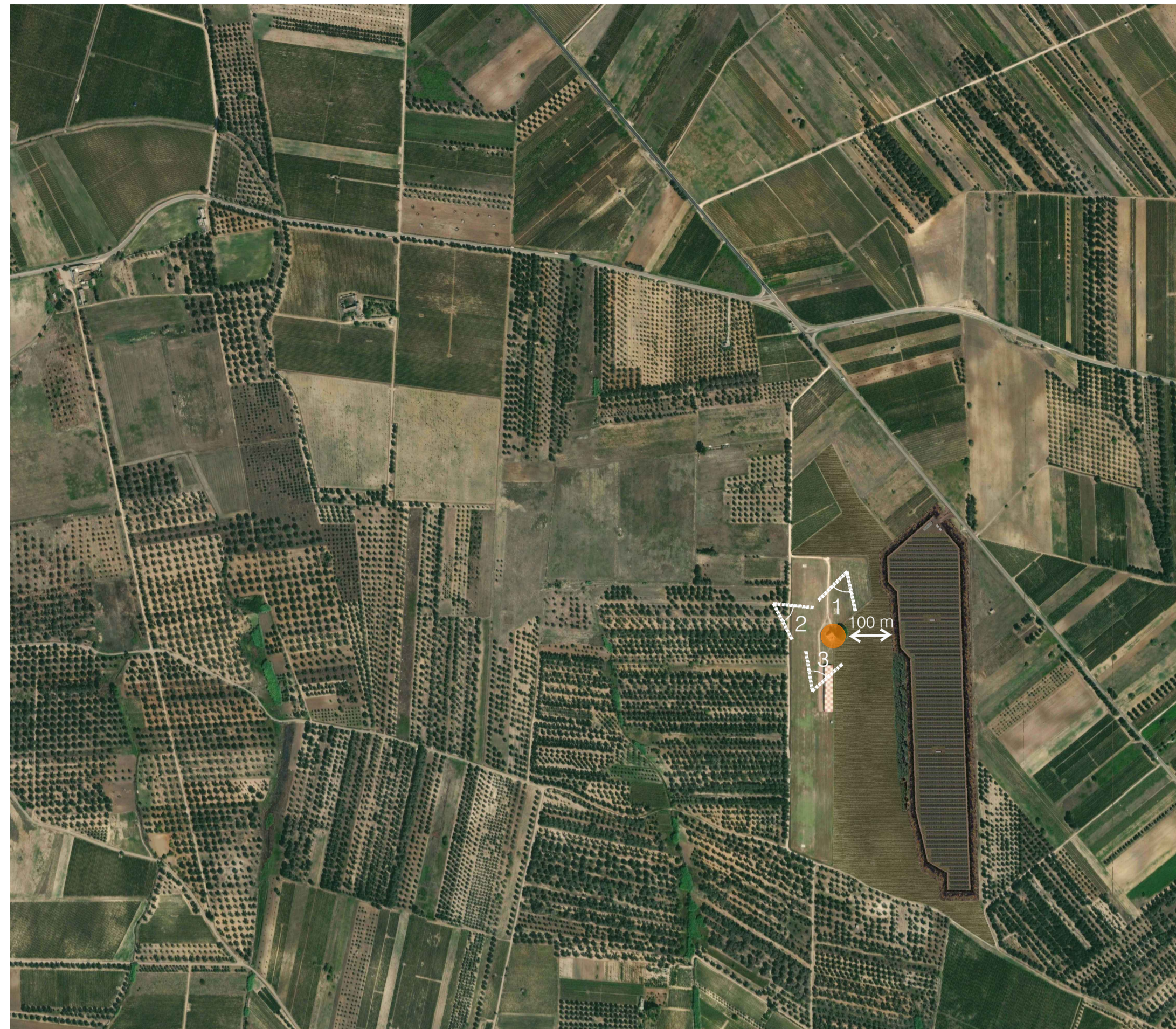
Ortofoto Sito 6: Torre Aviosuperficie