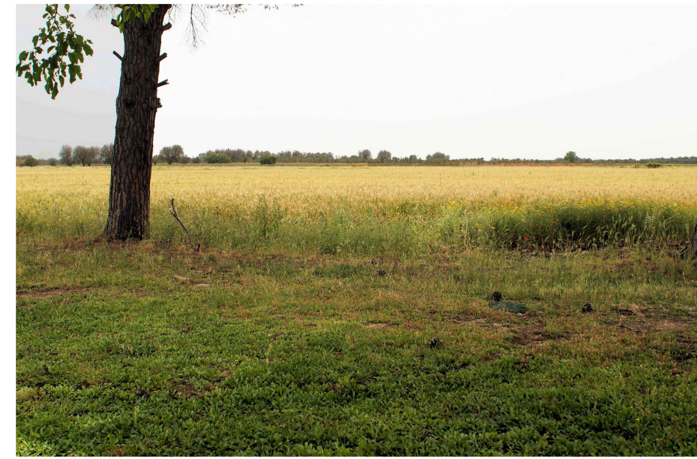
Sito 6: Torre Aviosuperficie. Stato di Fatto