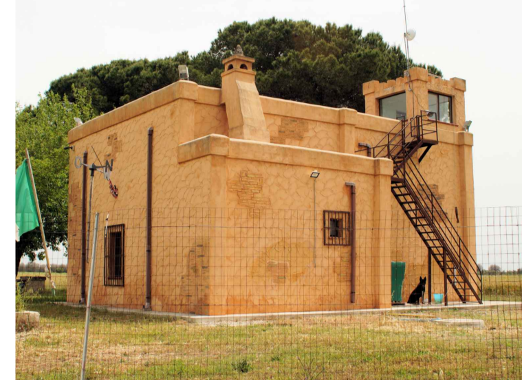
Sito 6: Torre Aviosuperficie Vista 2