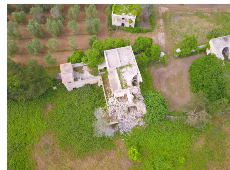
Sito 7: Masseria Monticello Vista 1