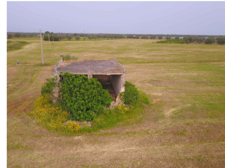
Sito 1: Masseria Uggio Piccolo Vista 2