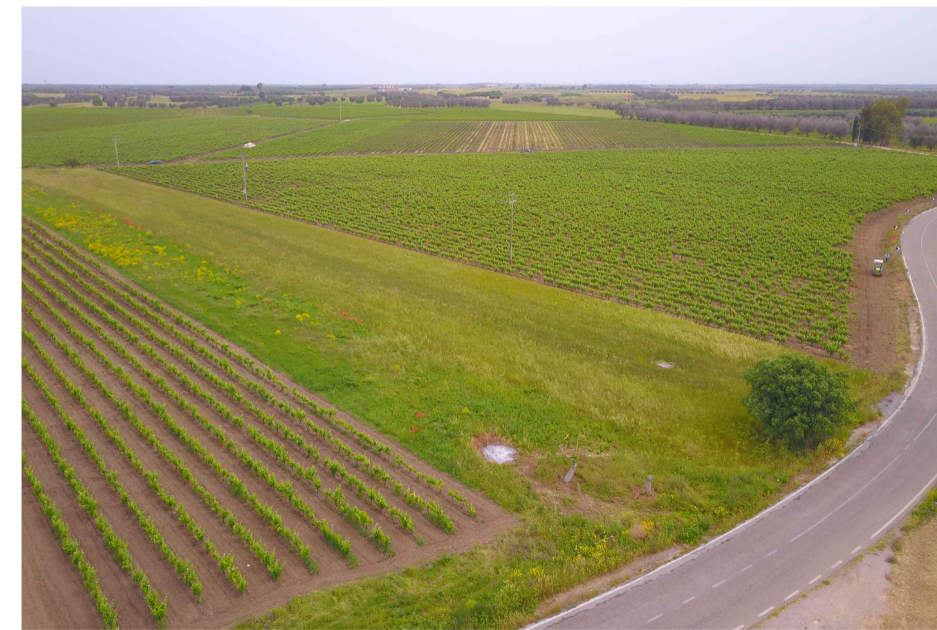
Sito 6: Masseria Scaloti. Stato di Fatto