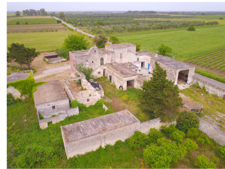
Sito 6: Masseria Scaloti Vista 2