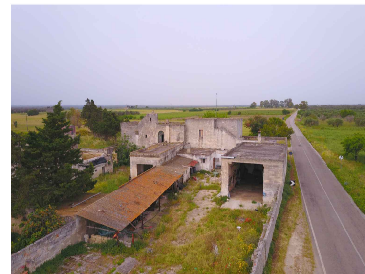
Sito 6: Masseria Scaloti Vista 1