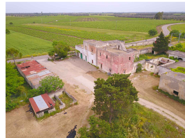
Sito 6: Masseria Scaloti Vista 3