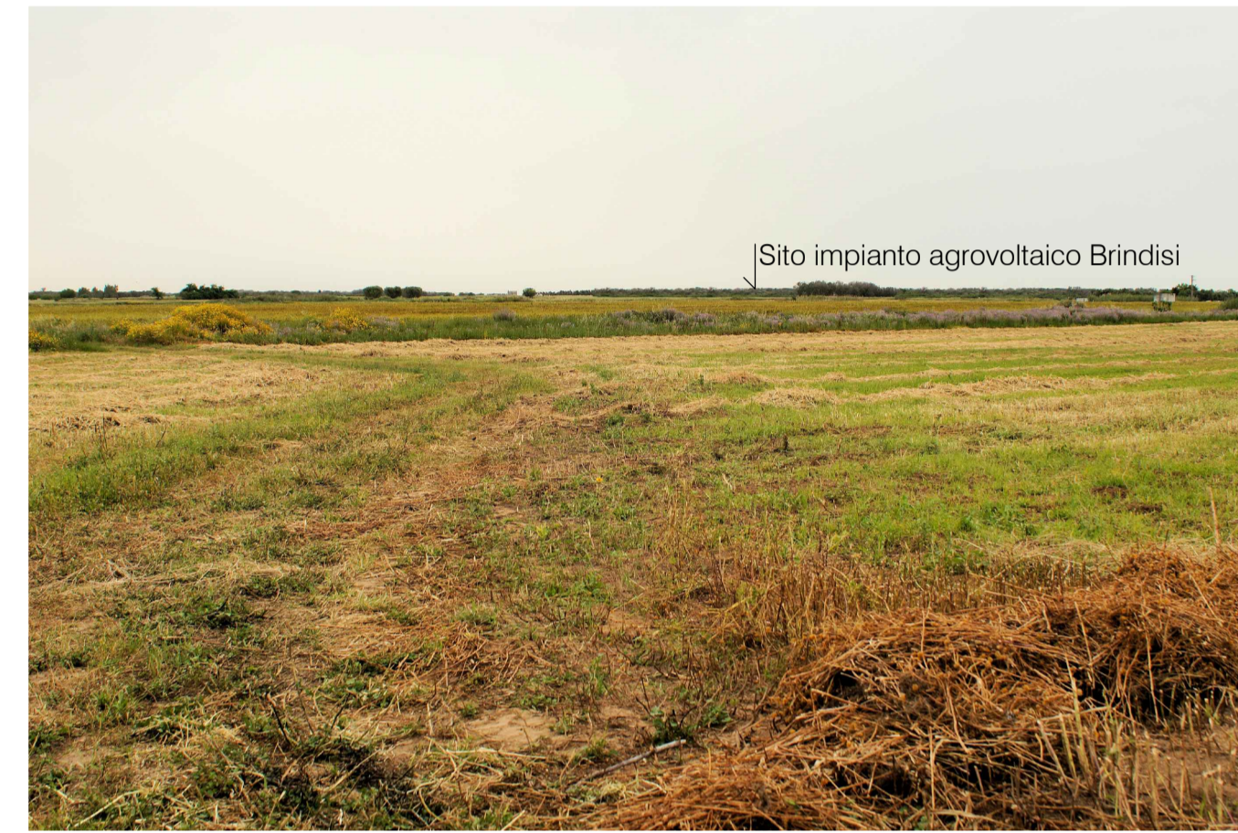
Sito 1: Masseria Uggio Piccolo. Stato di Progetto