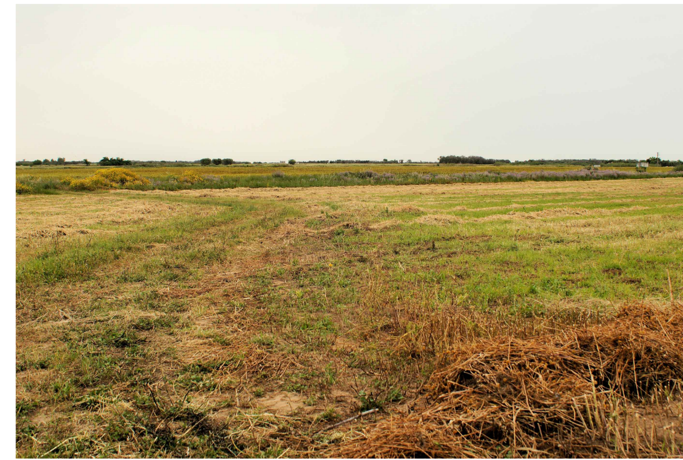
Sito 1: Masseria Uggio Piccolo. Stato di Fatto