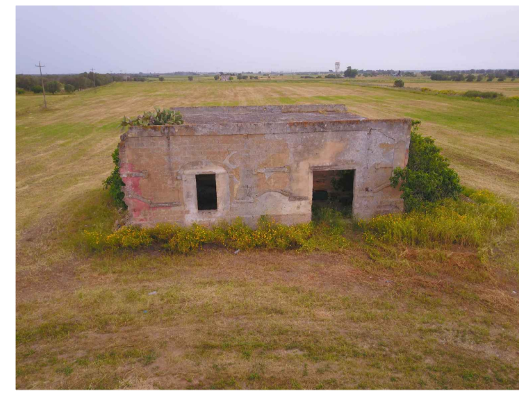
Sito 1: Masseria Uggio Piccolo Vista 1