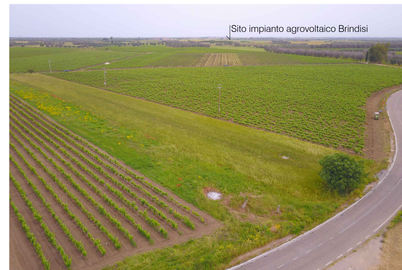
Sito 6: Masseria Scaloti. Stato di Progetto