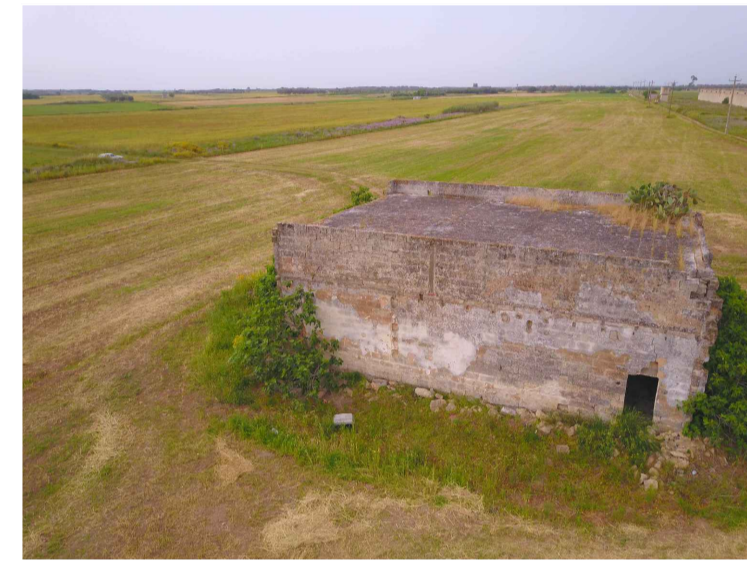
Sito 1: Masseria Uggio Piccolo Vista 3