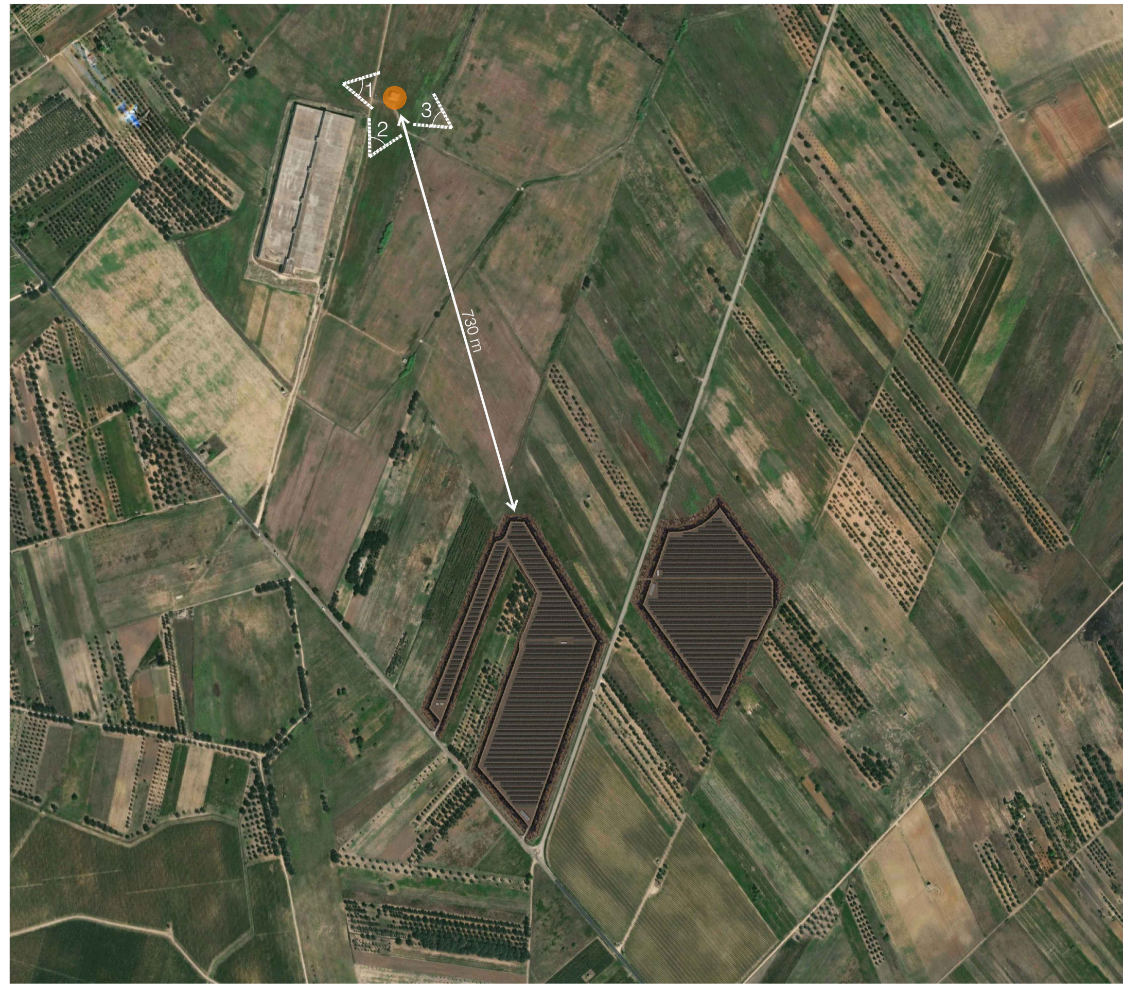
Ortofoto Sito 1: Masseria Uggio Piccolo