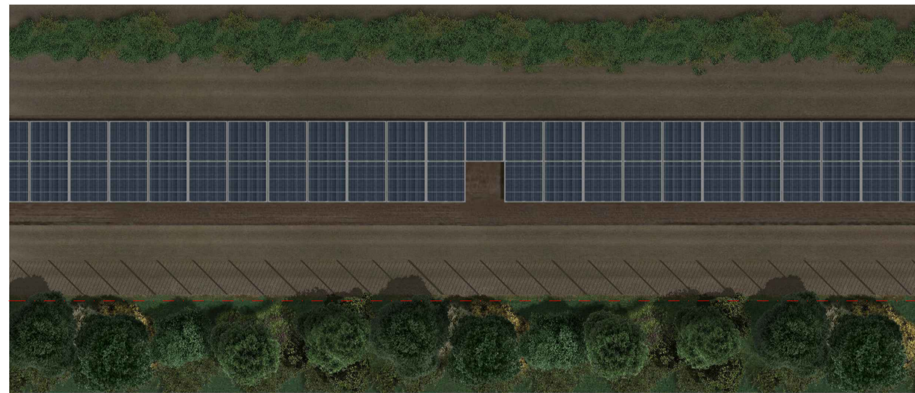
Ortofoto fascia di mitigazione da 5 mt

ASPARAGUS ACUTIFOLIUS CALICOTOME INFESTA CERATONIA SILIQUA CISTUS MONSPELIENSIS DAPHNE GNIDIUM FICUS CARICA HEDERA HELIT PISTACIA LENTISCUS PYRUS SPINOSA QUERCUS ILEX THYMUS CAPITATUS