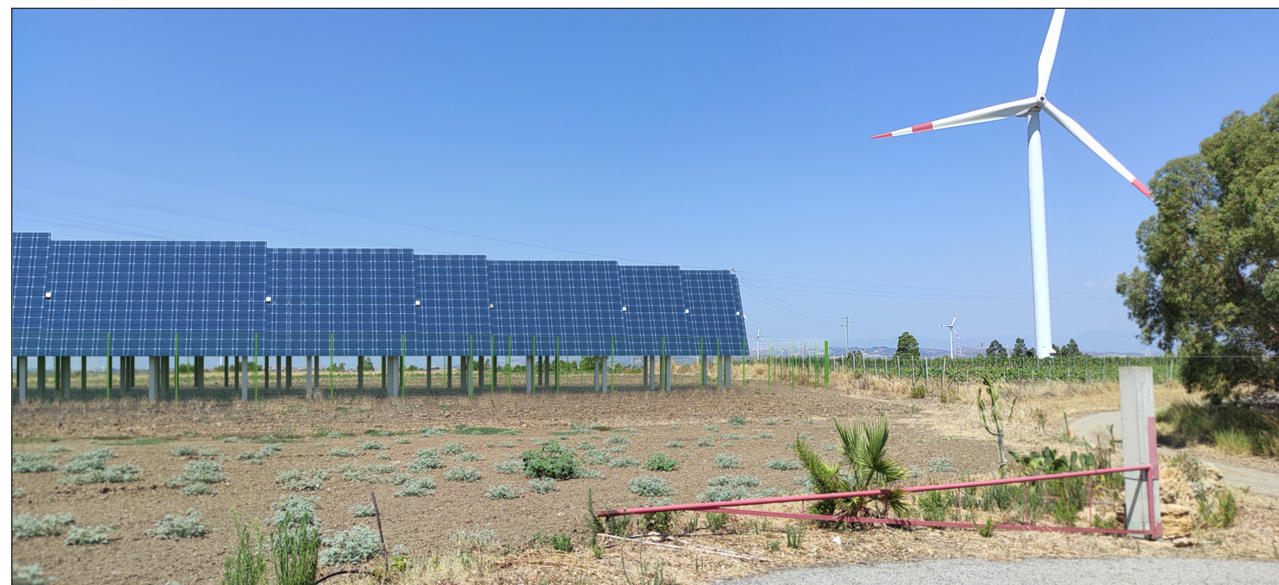
Vista dal sito di impianto con mitigazioni

Distanza focale 5mm Apertura max 1,83 lunghezza focale 25 mm