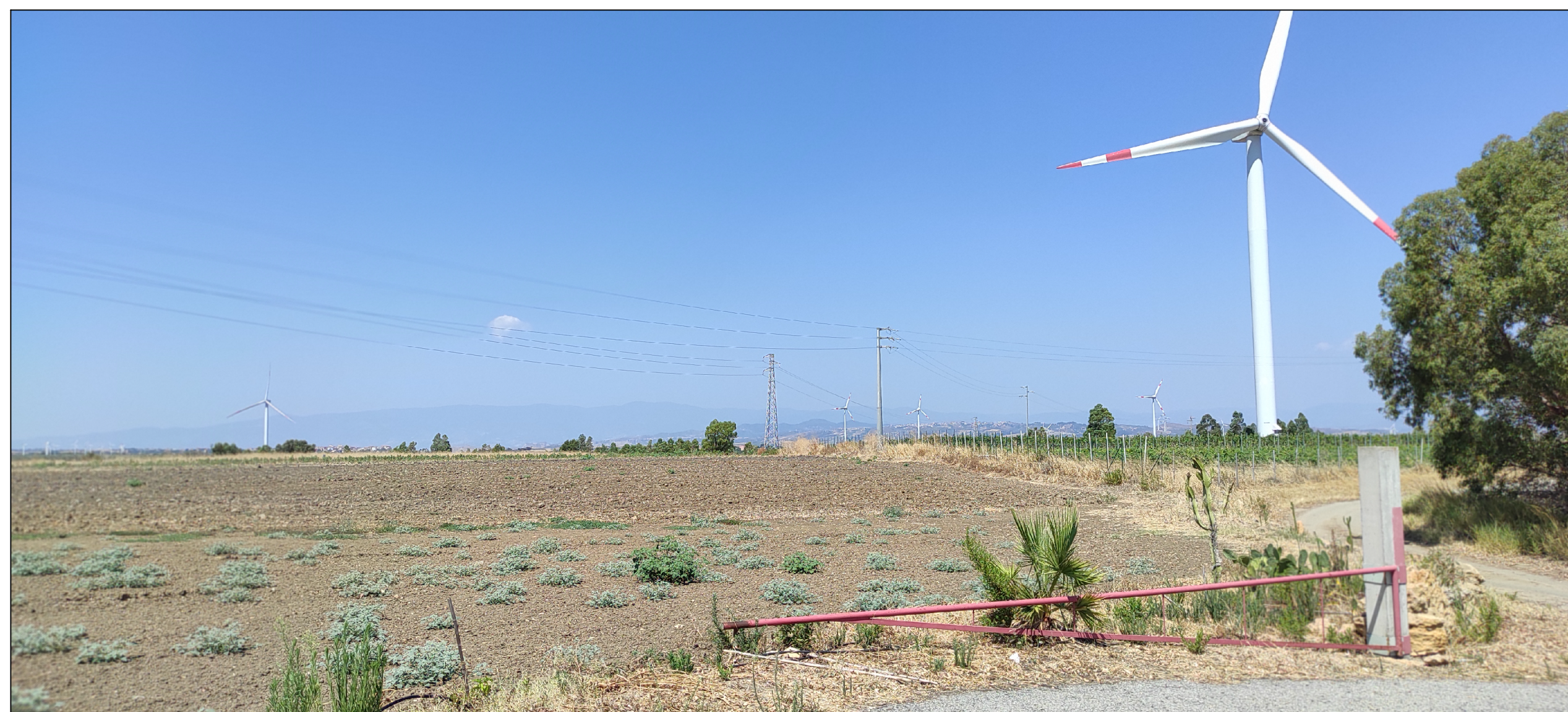
Vista dal sito di impianto

Distanza focale 5mm Apertura max 1,83 lunghezza focale 25 mm