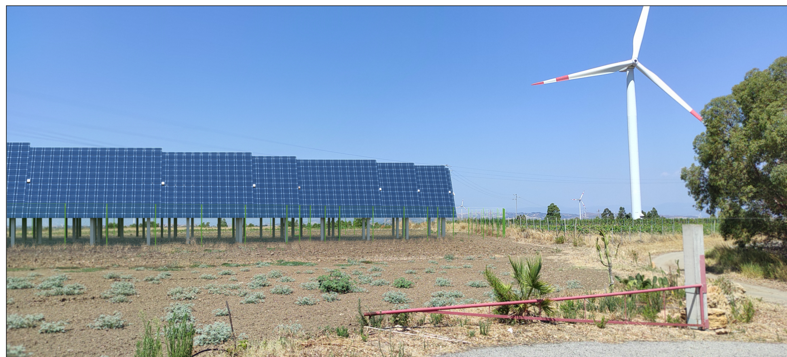
Vista dal sito di impianto

Distanza focale 5mm Apertura max 1,83 lunghezza focale 25 mm