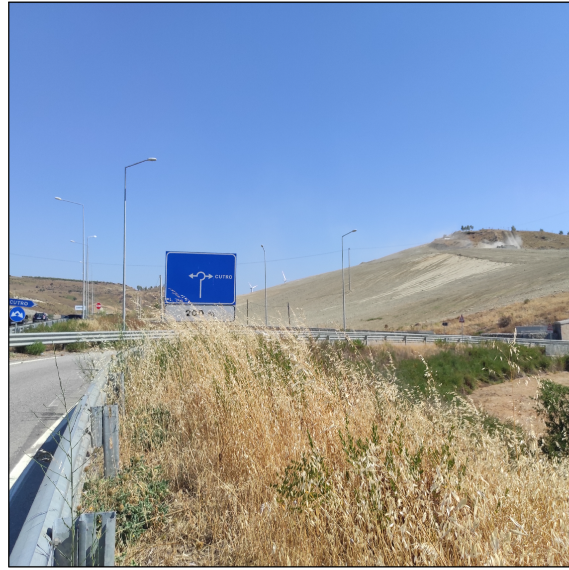
Vista da PV1 (SS106)

Distanza focale 5mm Apertura max 1,83 lunghezza focale 25 mm