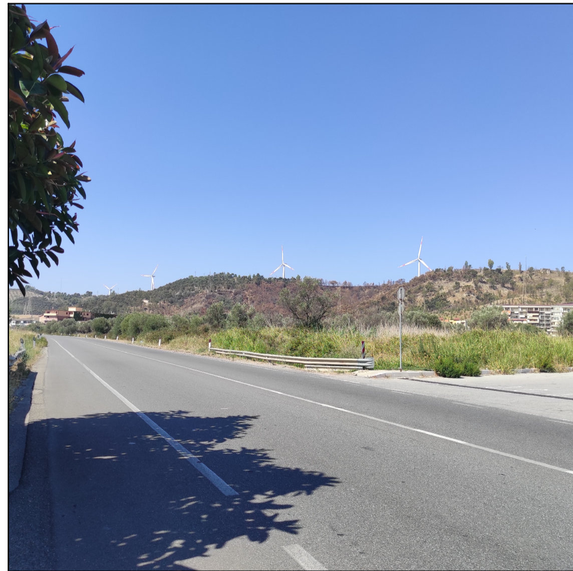
Vista da PV6 (SS106 e ferrovia)

Distanza focale 5mm Apertura max 1,83 lunghezza focale 25 mm