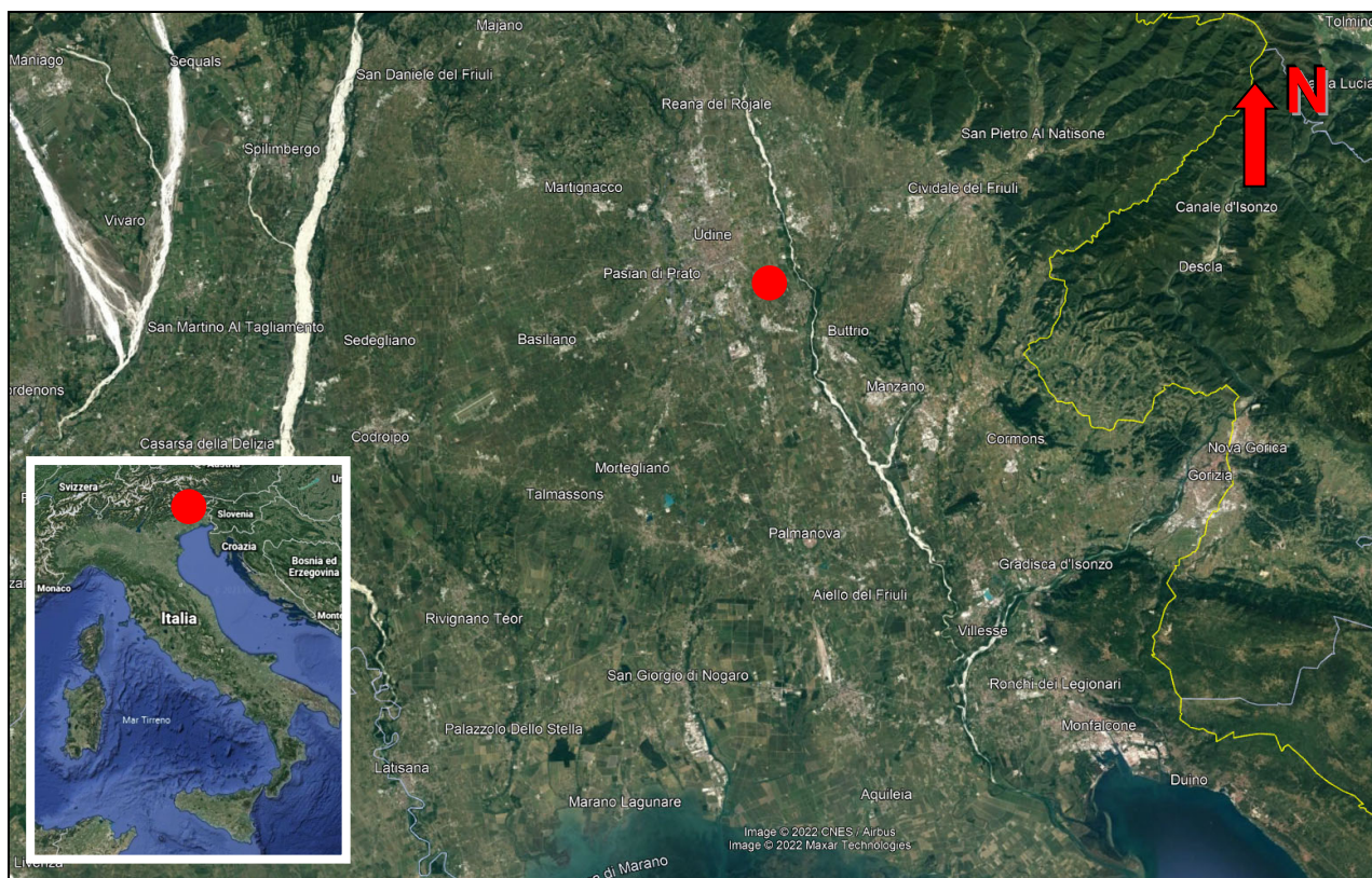
Figura 1 – Immagine satellitare con evidenziata, in rosso, la posizione del terreno oggetto di intervento.

Oggetto: Realizzazione di un impianto fotovoltaico su terreno sito nel Comune di Pradamano (UD) – Proponente Ellomay Solar Italy Eight S.r.l.