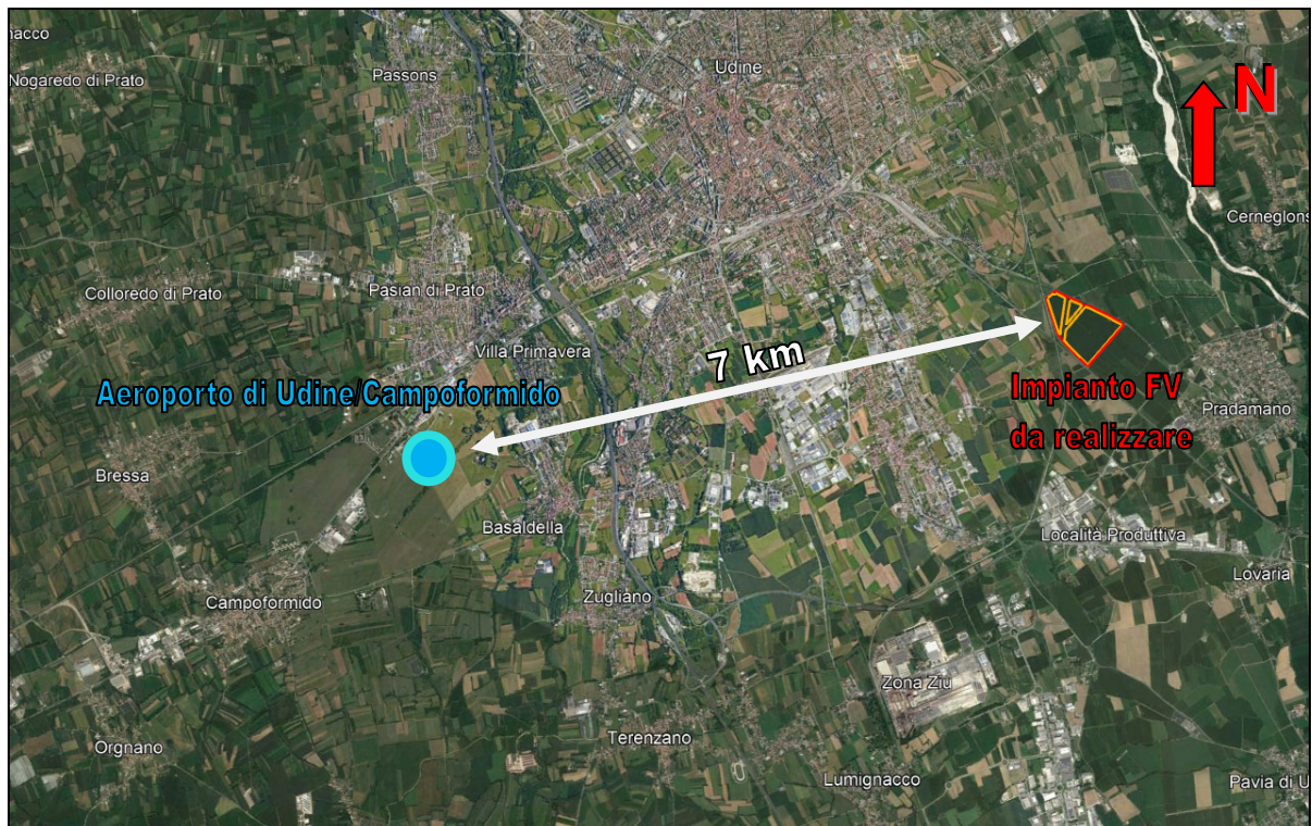
Figura 4 – Posizione e distanza dell'area interessata dall'intervento rispetto all'ARP dell'Aeroporto non strumentale più vicino di competenza ENAC/ENAV, nonché quello di Udine/Campoformido.

Cod. fisc.: VTTPPL86P21H501S – Part. IVA : 12330111001