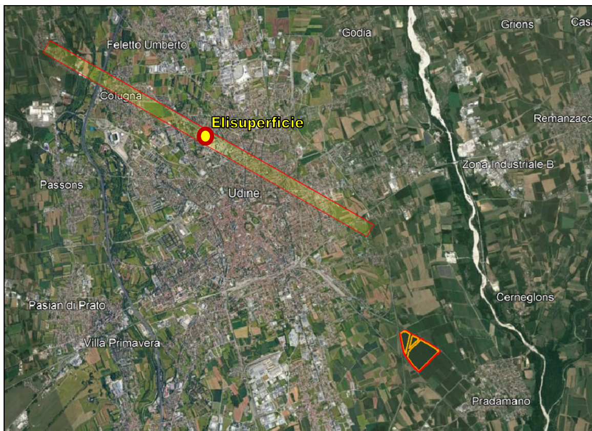
Figura 6 – In evidenza, in giallo, la superficie di limitazione dell'elisuperficie dell'Ospedale di Udine, rispetto all'area oggetto di intervento. Notasi la totale assenza di interferenze con l'impianto da realizzare.