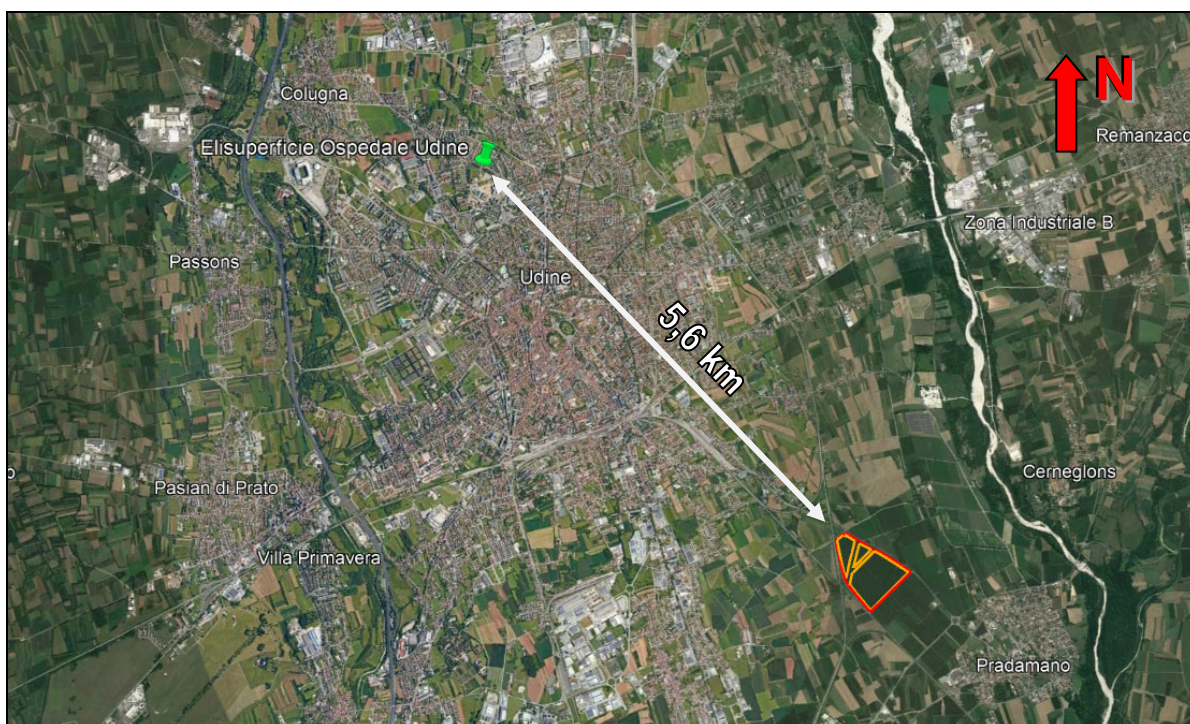
Figura 5 – Posizione e distanza dell'elisuperficie dell'Ospedale di Udine rispetto all'area oggetto di intervento.