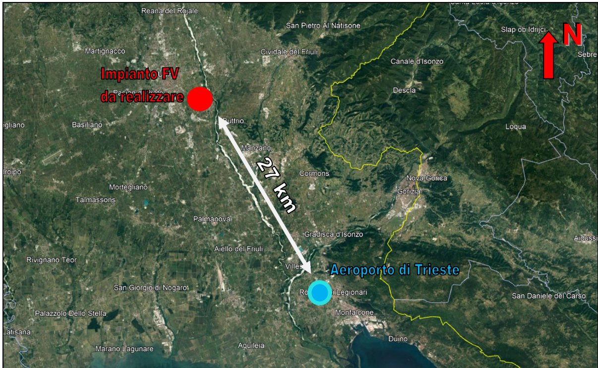
Figura 3 – Posizione e distanza dell'area interessata dall'intervento rispetto all'ARP dell'Aeroporto strumentale più vicino di competenza ENAC/ENAV, nonché quello di Trieste "Ronchi dei Legionari".