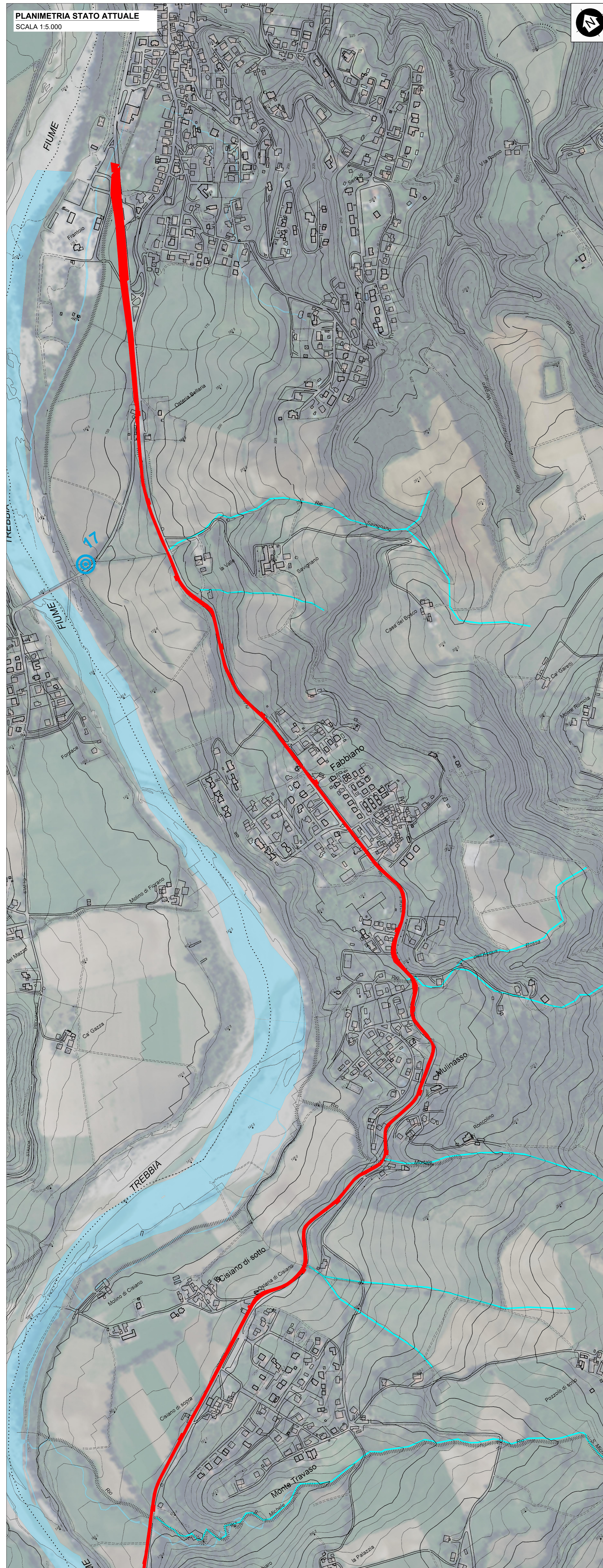
PLANIMETRIA STATO ATTUALE SCALA 1:5.000