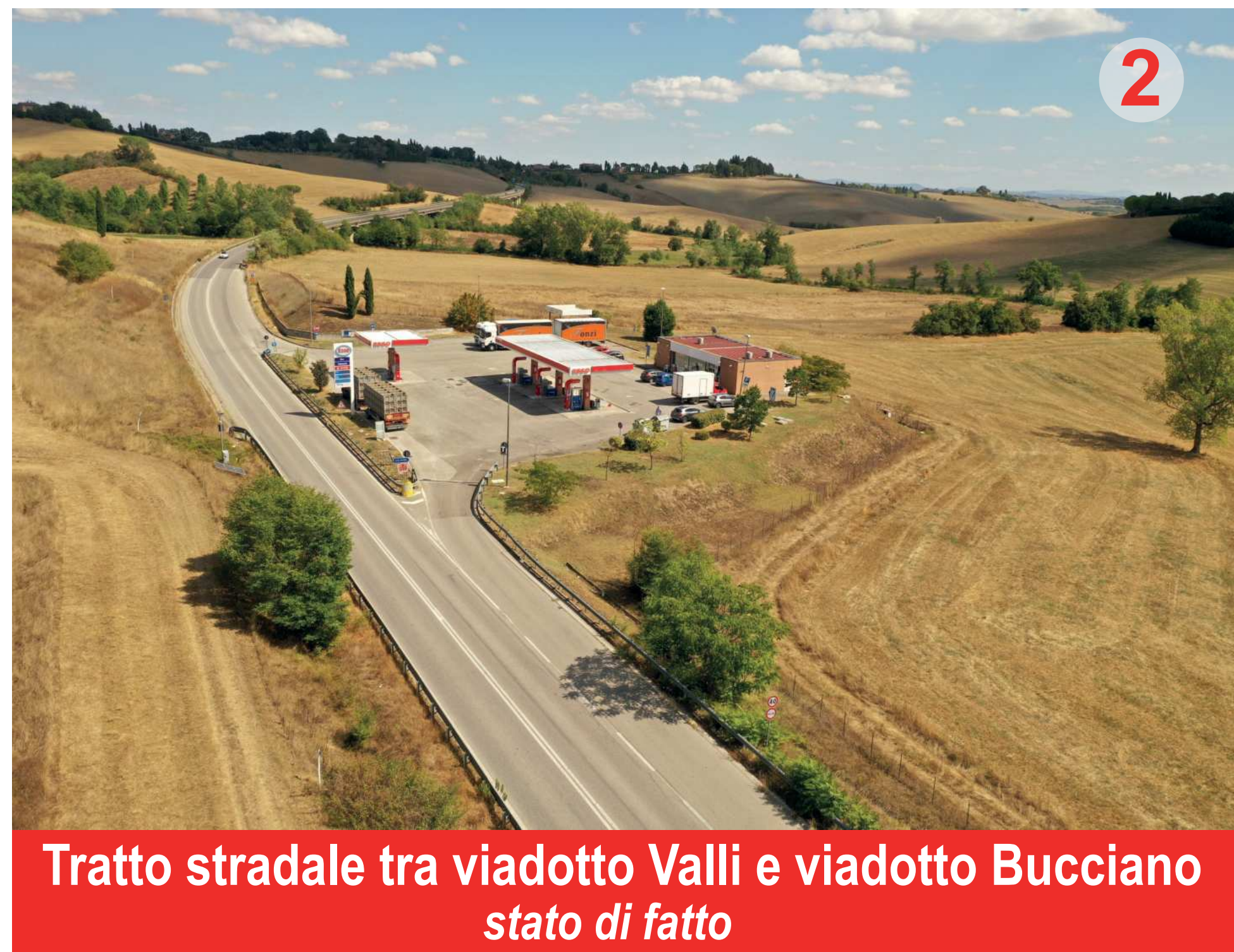
Tratto stradale tra viadotto Valli e viadotto Bucciano stato di fatto