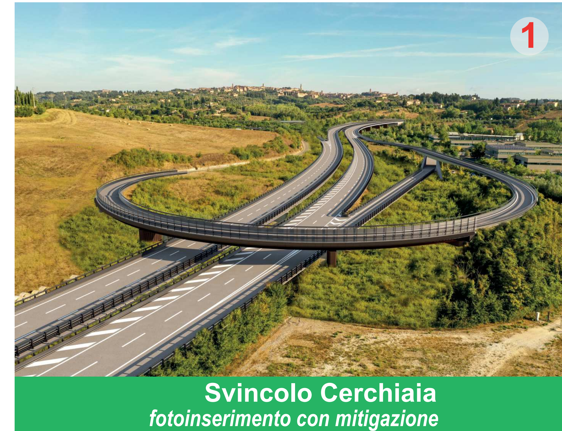
Svincolo Cerchiaia fotoinserimento con mitigazione