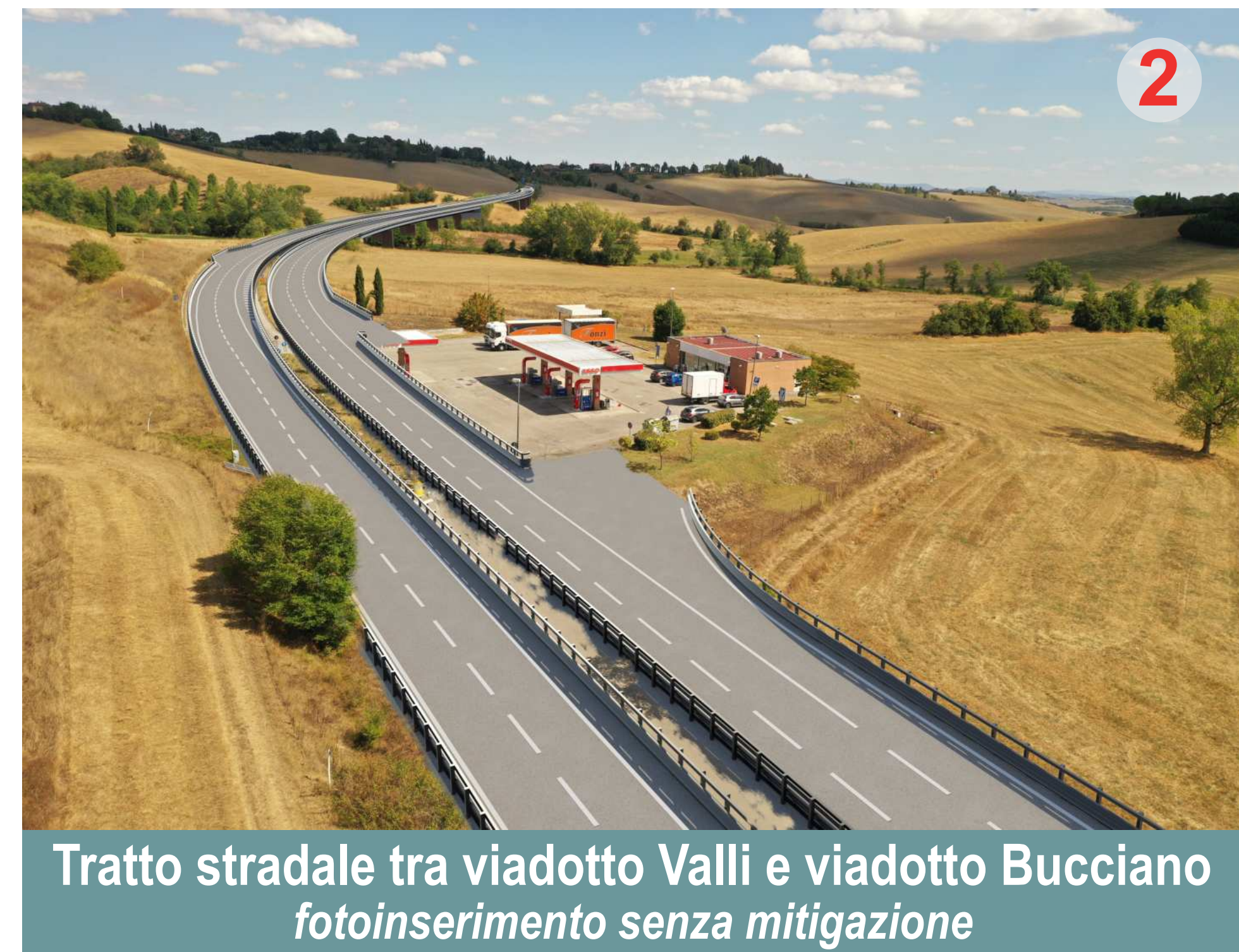
Tratto stradale tra viadotto Valli e viadotto Bucciano fotoinserimento senza mitigazione