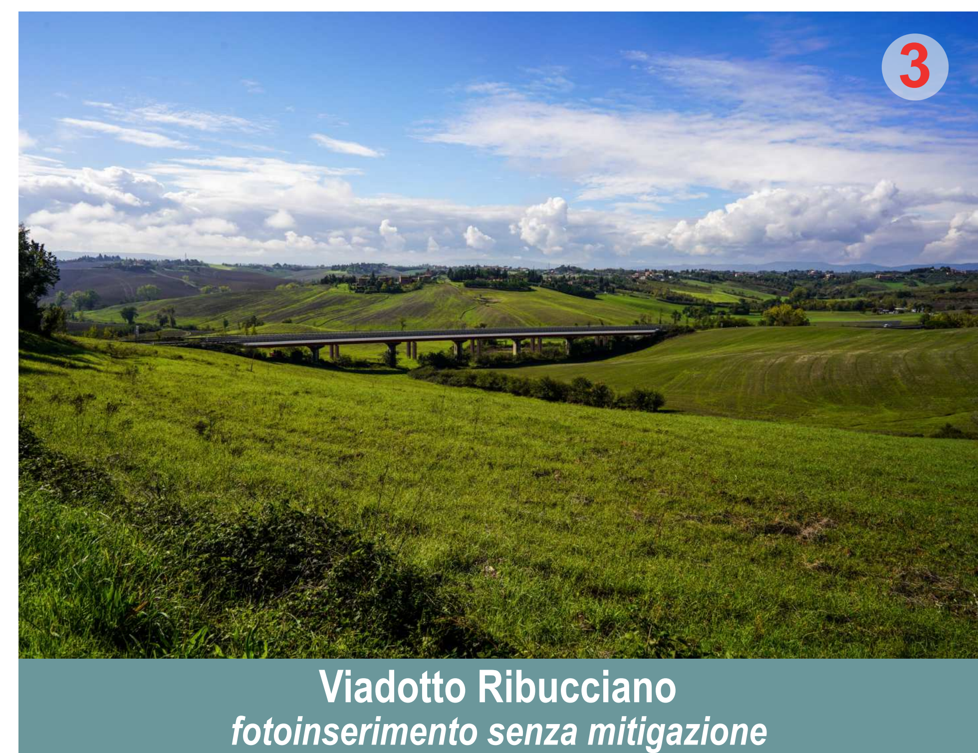
Viadotto Ribucciano fotoinserimento senza mitigazione