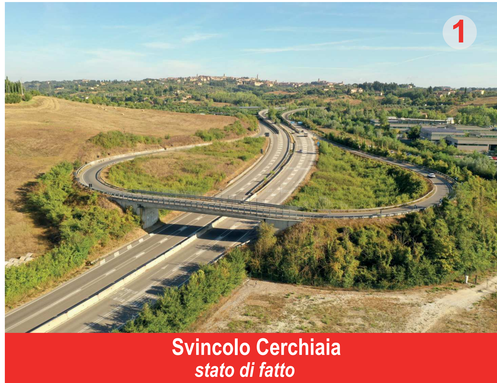
Svincolo Cerchiaia stato di fatto