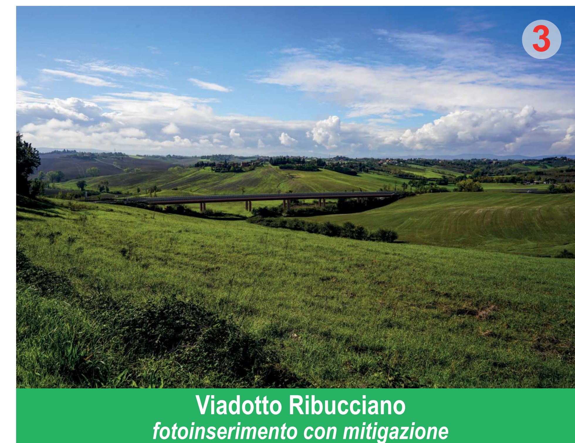
Viadotto Ribucciano fotoinserimento con mitigazione