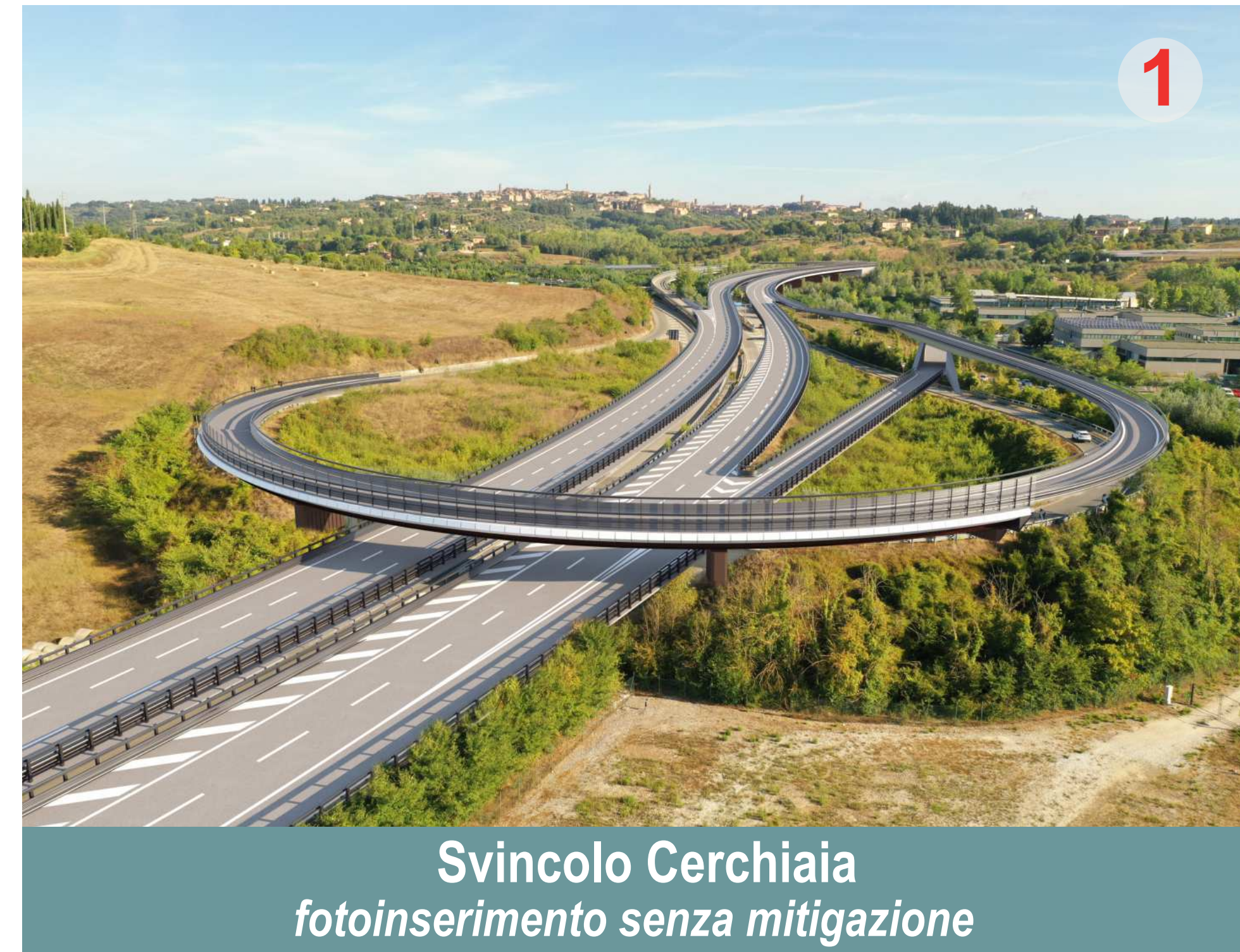
Svincolo Cerchiaia fotoinserimento senza mitigazione