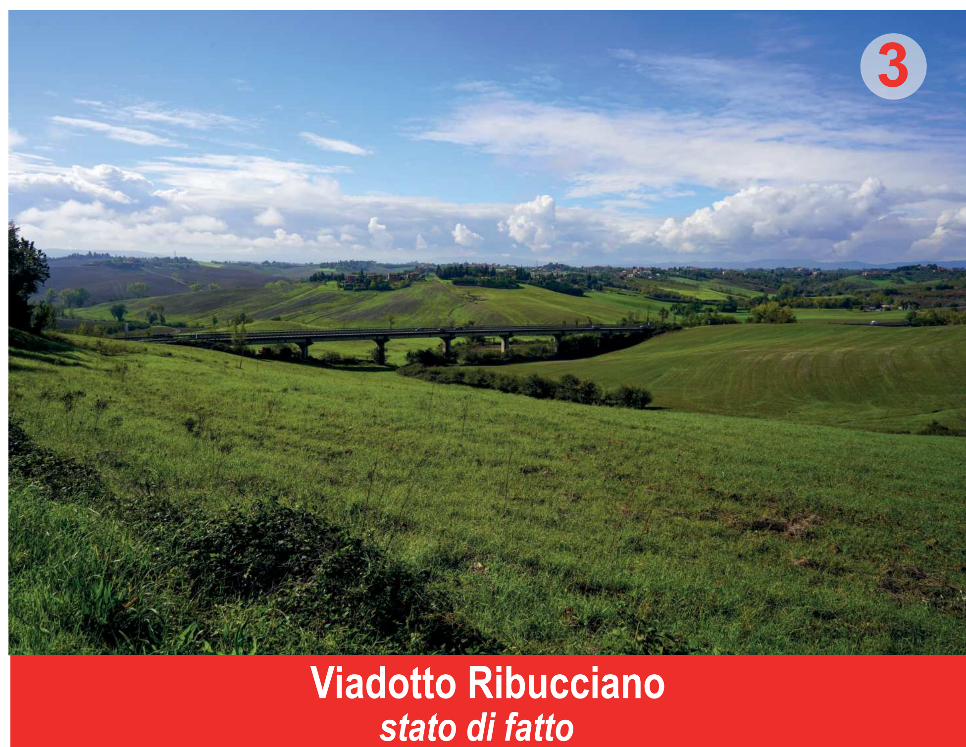
Viadotto Ribucciano stato di fatto