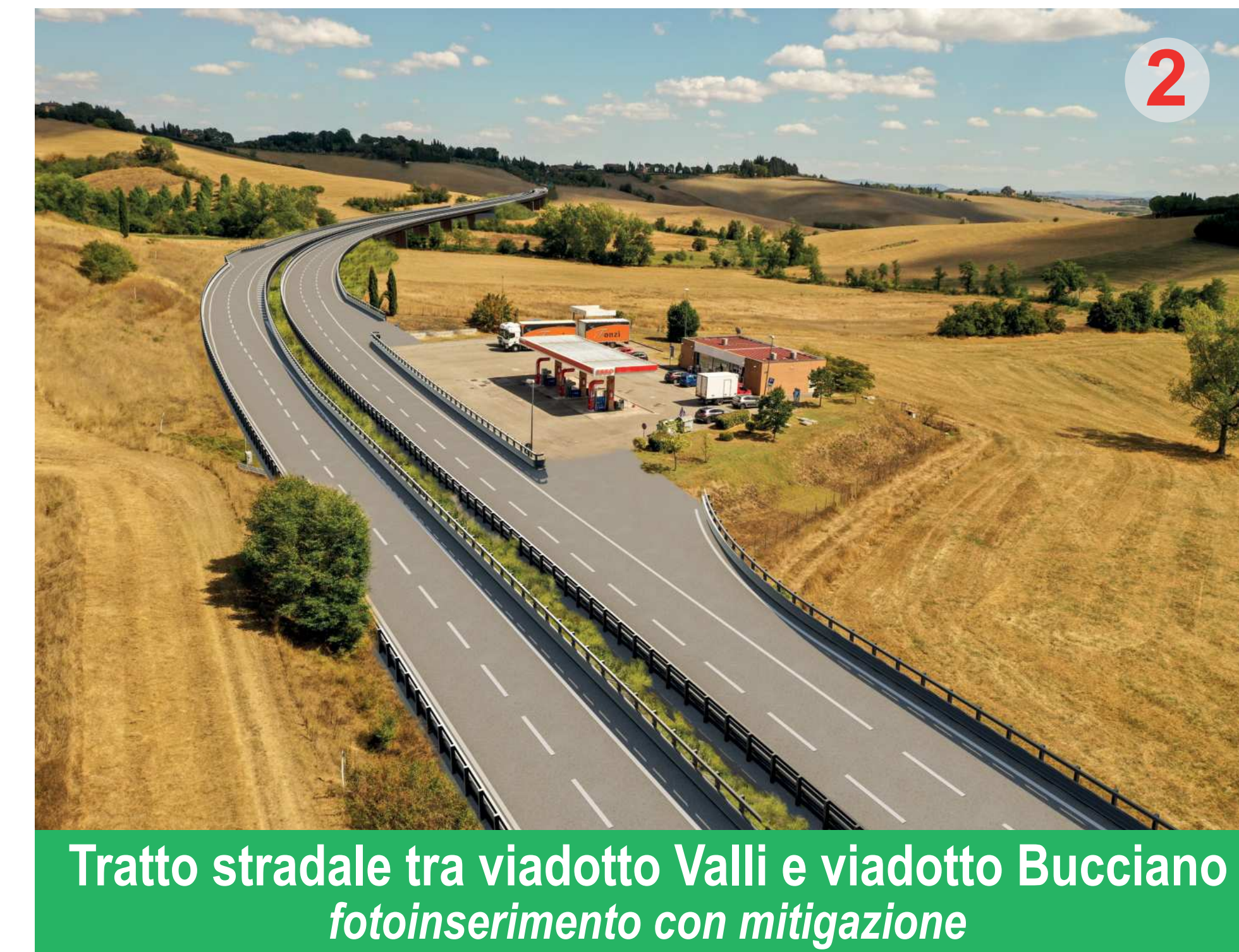
Tratto stradale tra viadotto Valli e viadotto Bucciano fotoinserimento con mitigazione