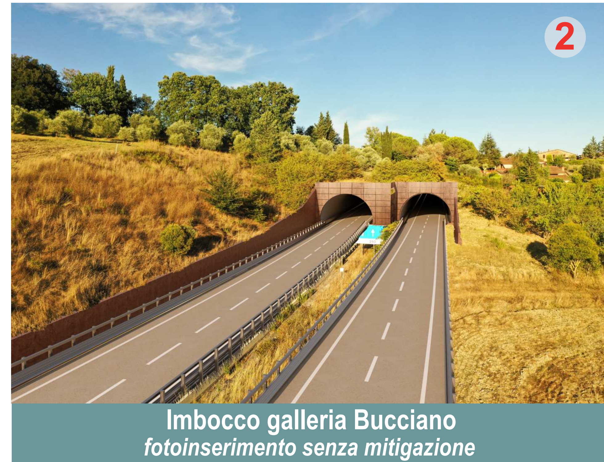
Imbocco galleria Bucciano fotoinserimento senza mitigazione