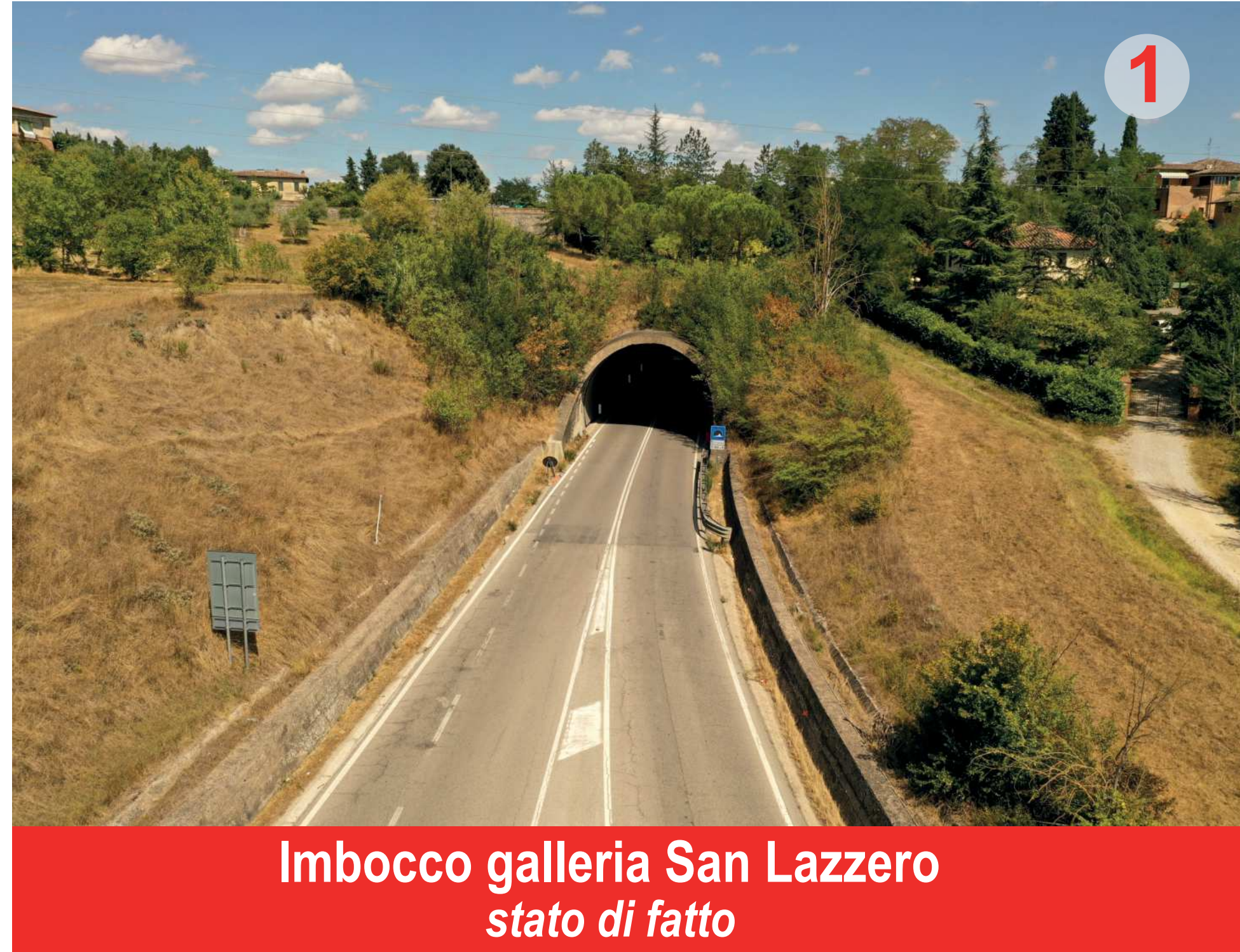
Imbocco galleria San Lazzero stato di fatto