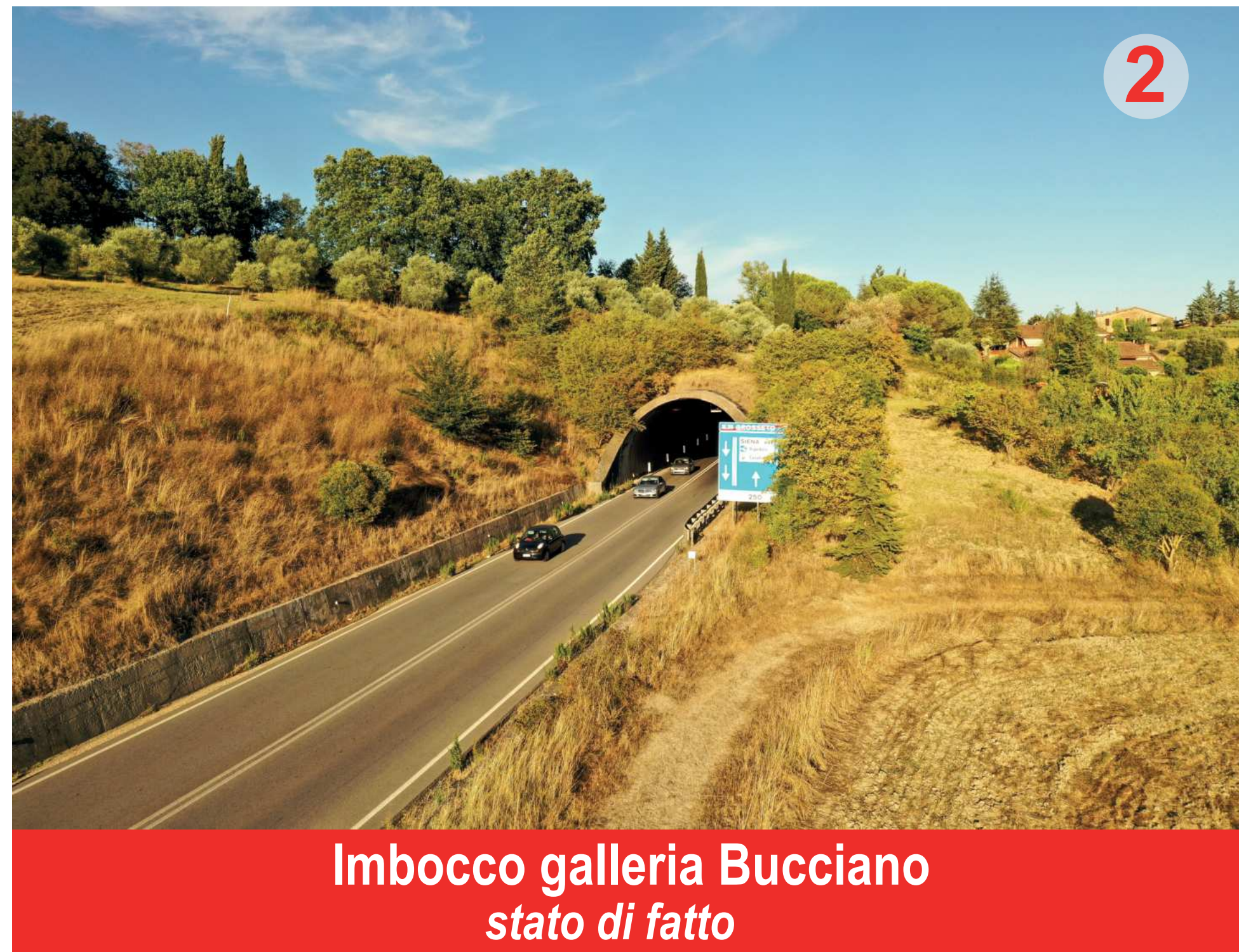
Imbocco galleria Bucciano stato di fatto