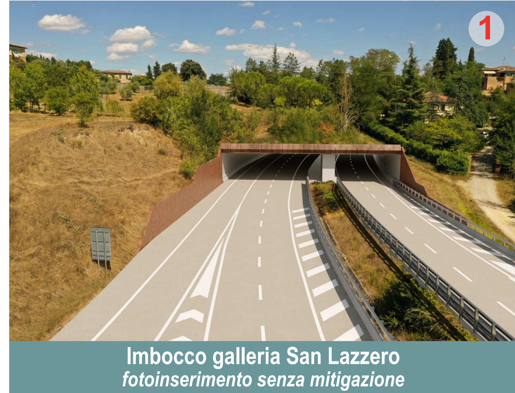
Imbocco galleria San Lazzero fotoinserimento senza mitigazione