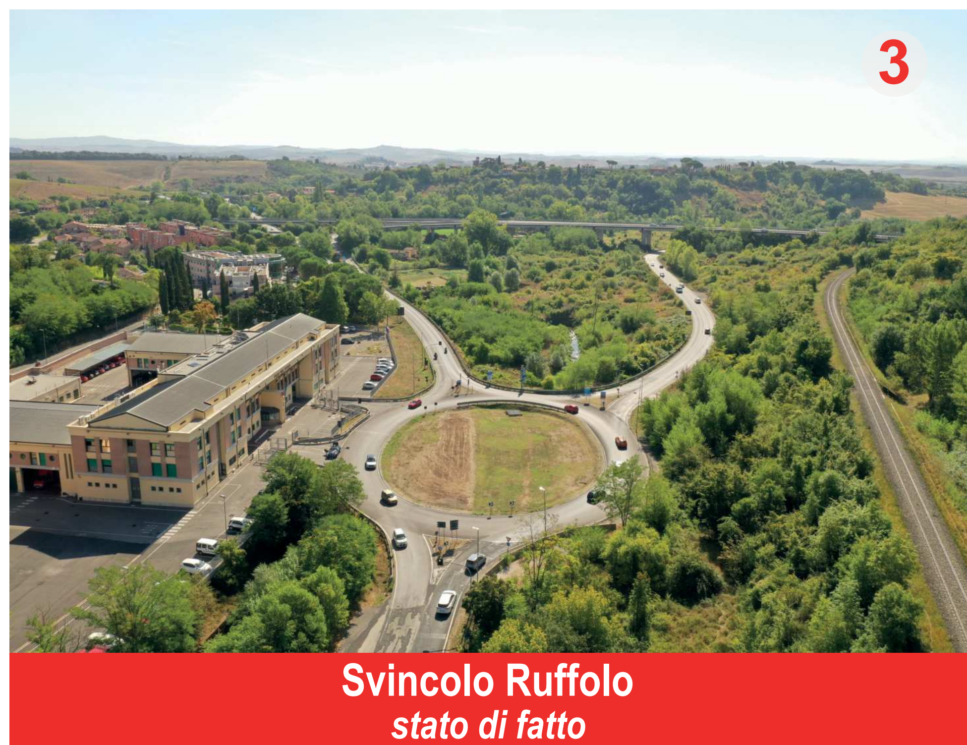
Svincolo Ruffolo stato di fatto