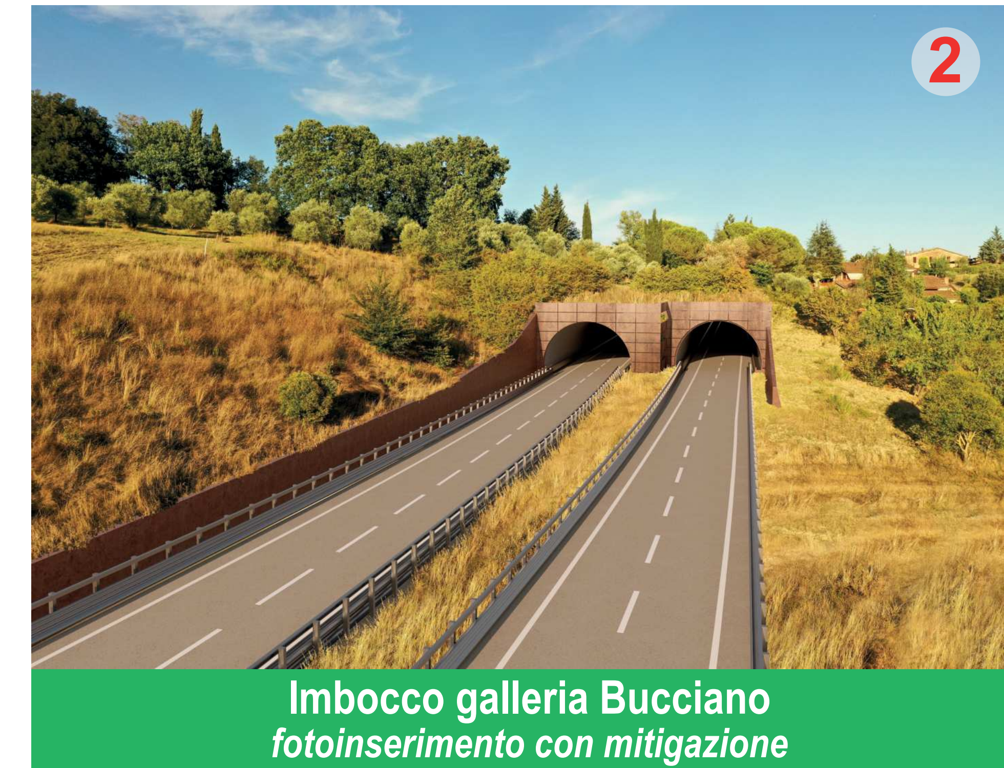
Imbocco galleria Bucciano fotoinserimento con mitigazione