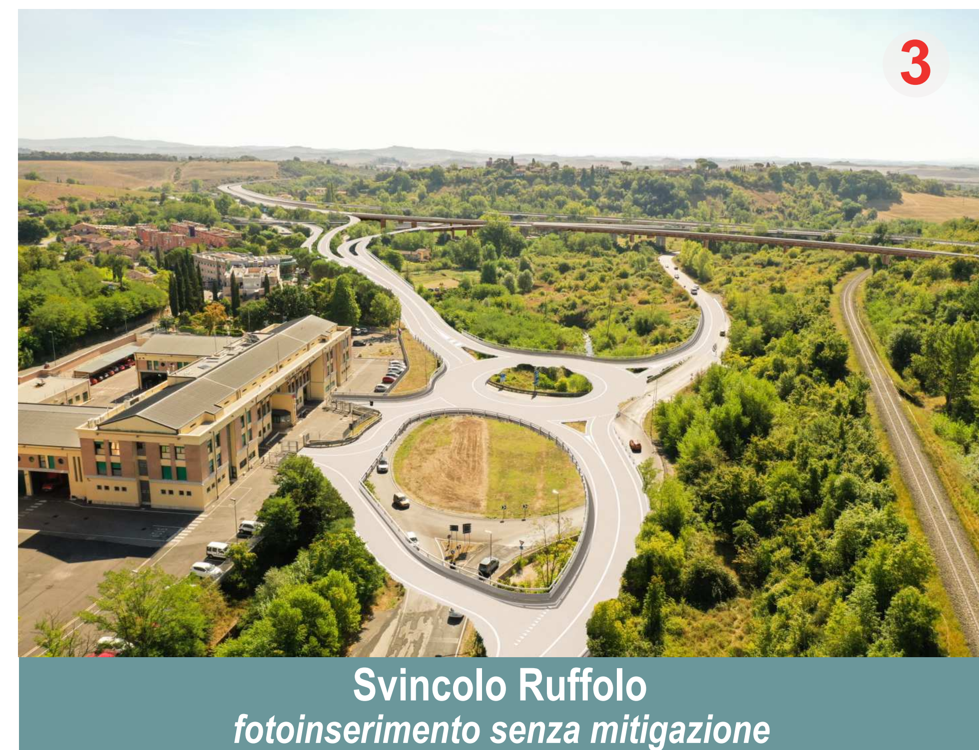
Svincolo Ruffolo fotoinserimento senza mitigazione