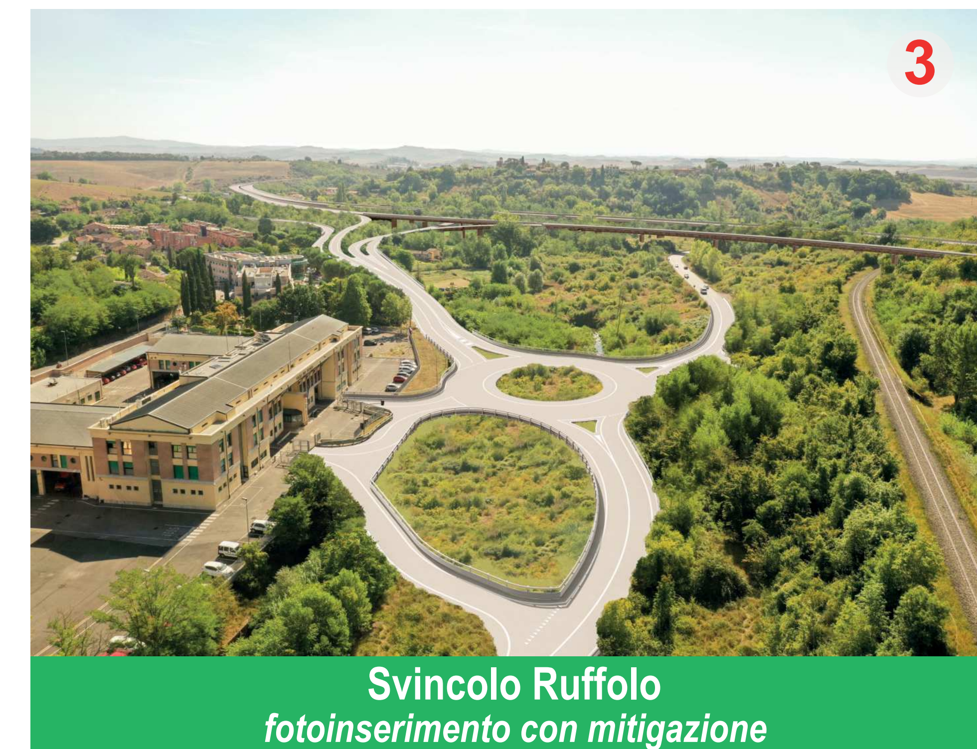
Svincolo Ruffolo fotoinserimento con mitigazione