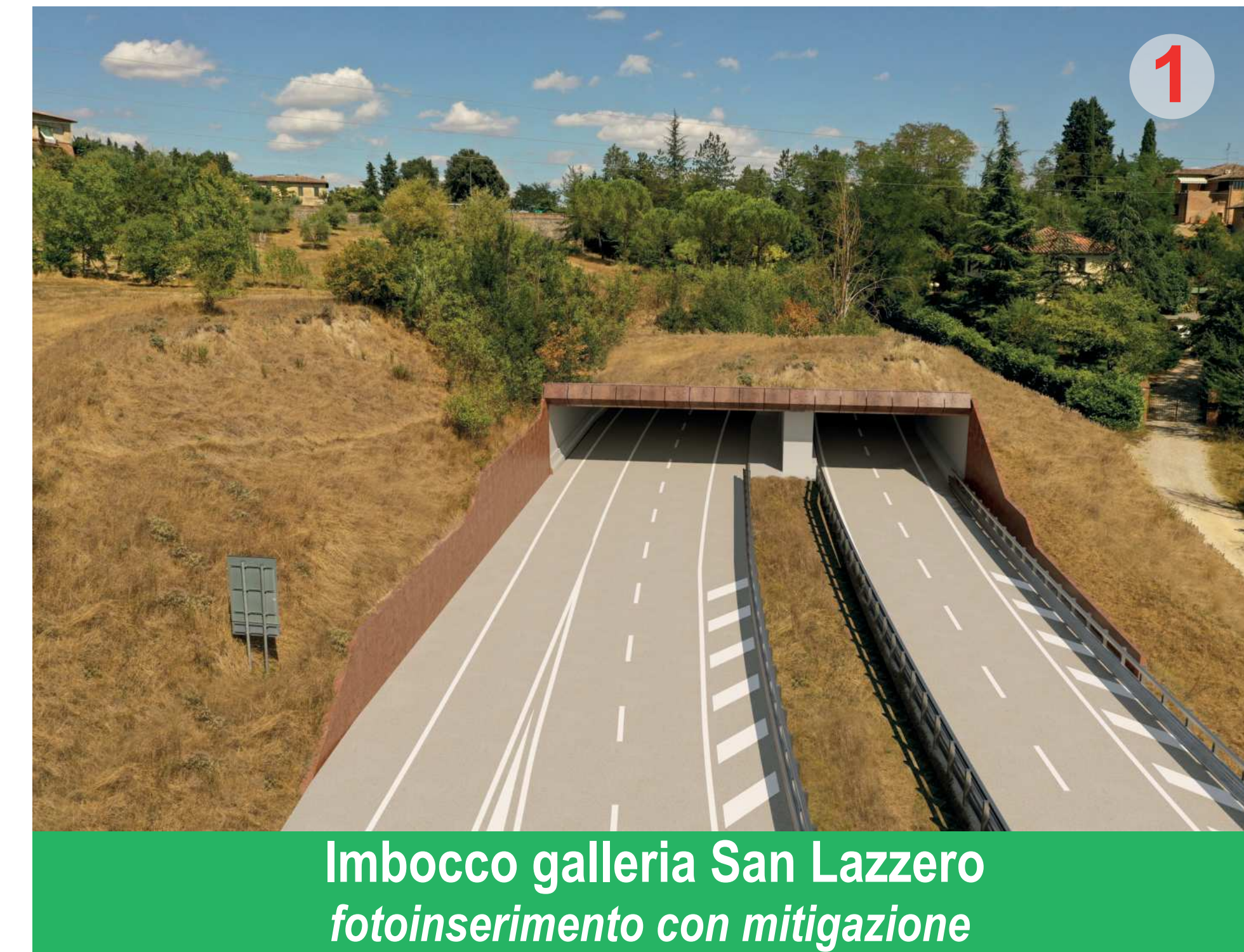
Imbocco galleria San Lazzero fotoinserimento con mitigazione