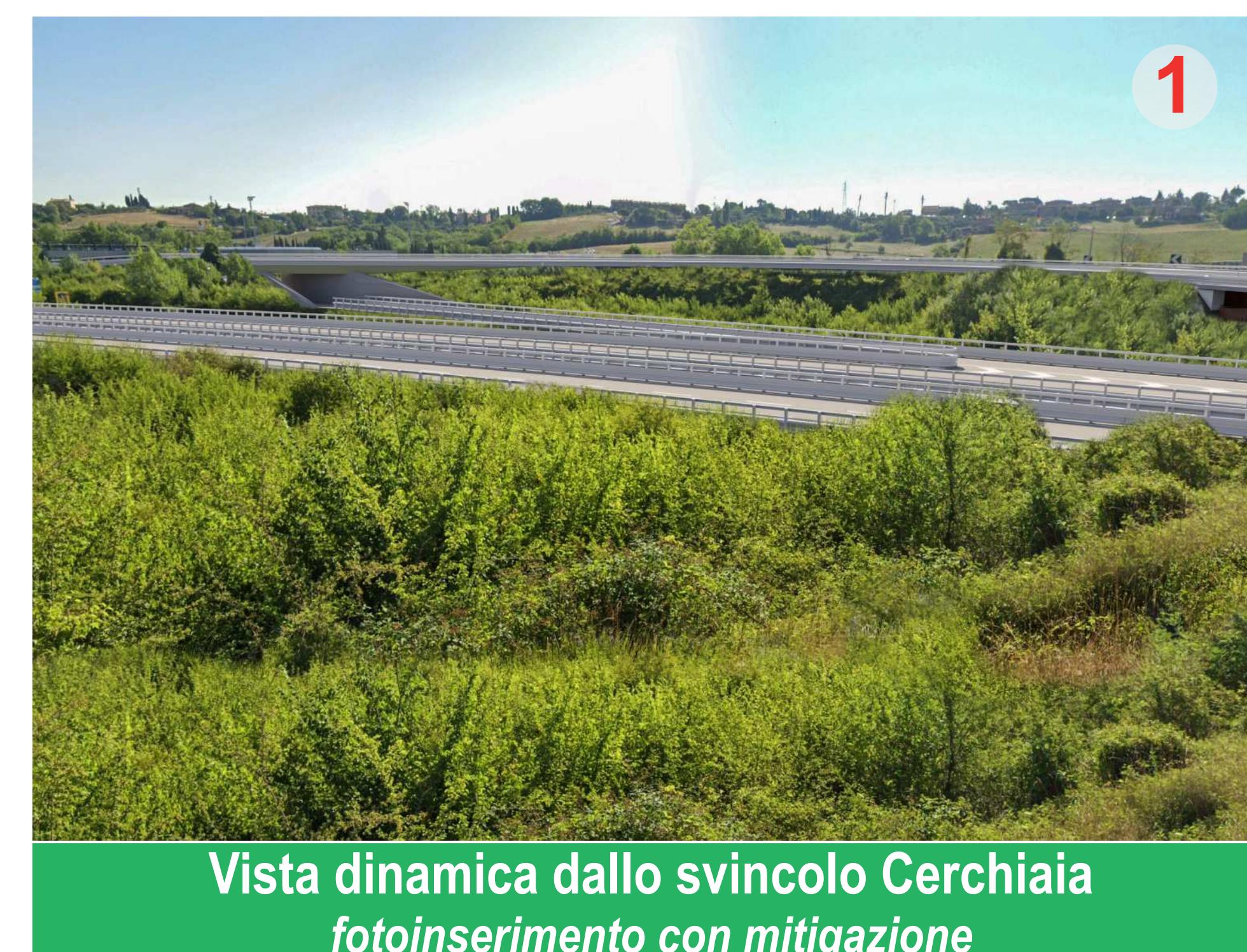
Vista dinamica dallo svincolo Cerchiaia fotoinserimento con mitigazione