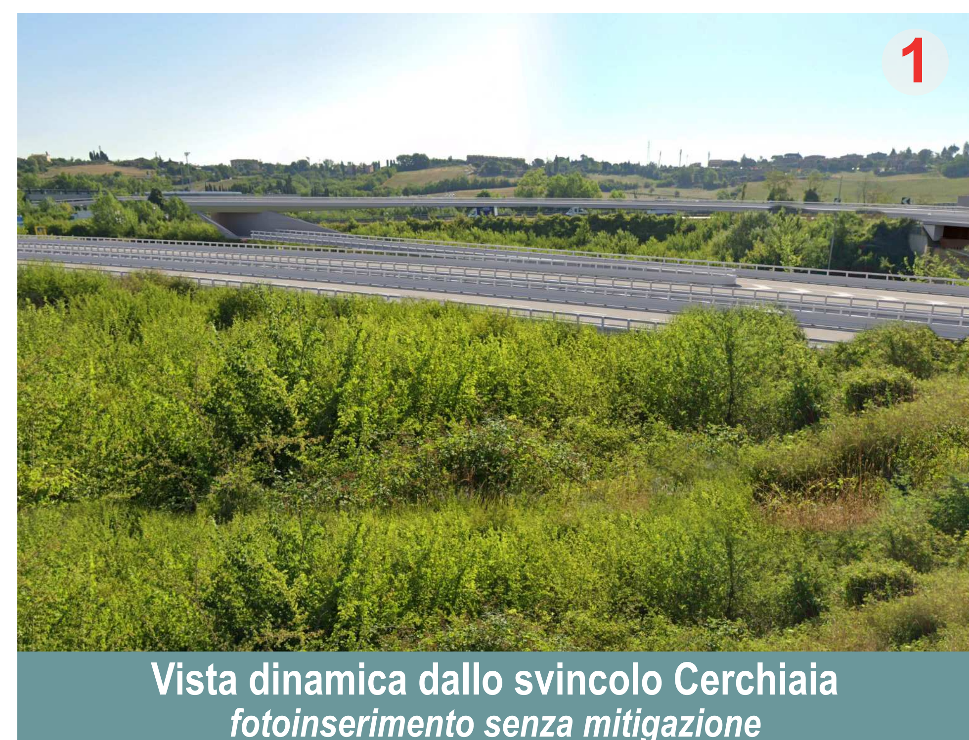
Vista dinamica dallo svincolo Cerchiaia fotoinserimento senza mitigazione