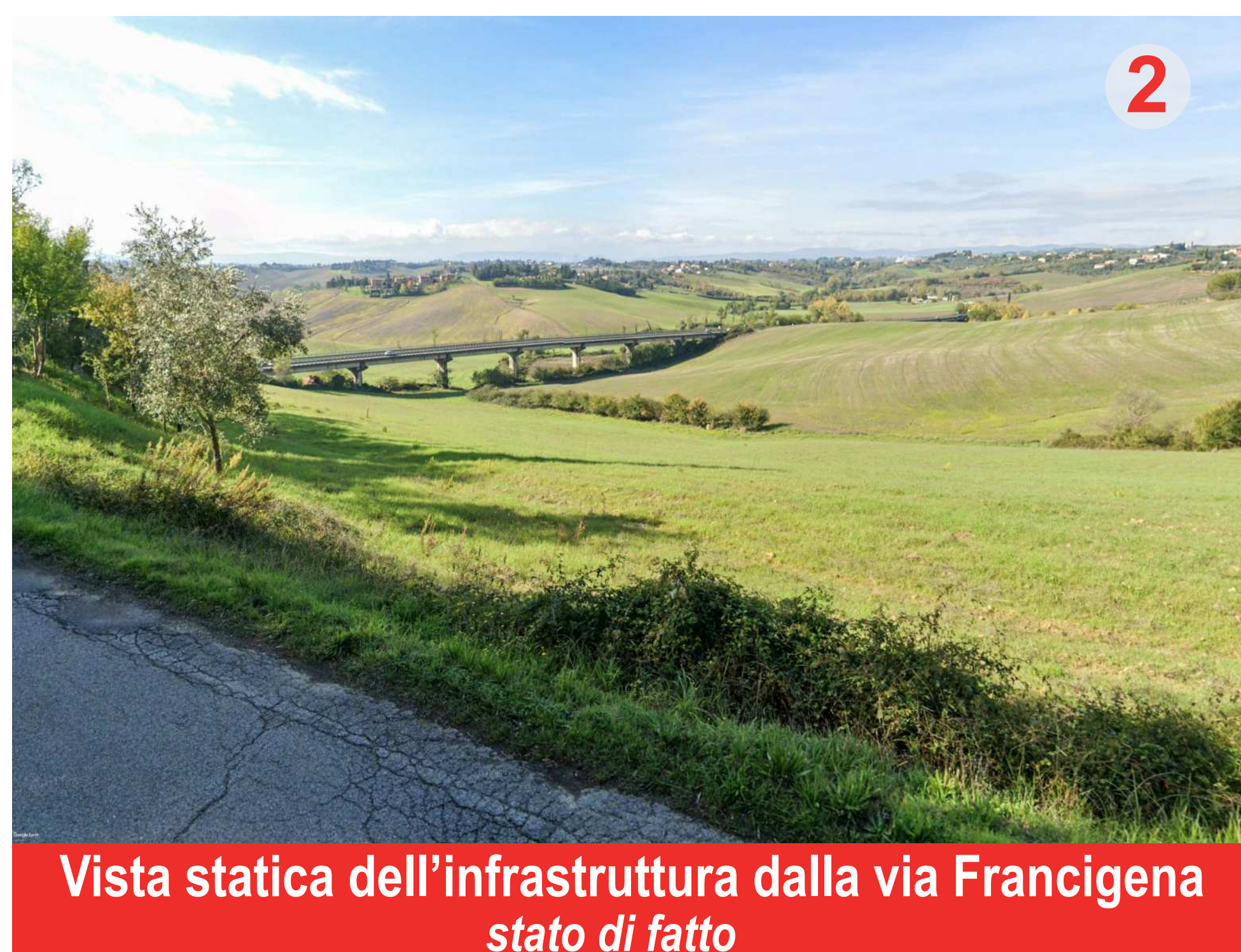
Vista statica dell'infrastruttura dalla via Francigena stato di fatto