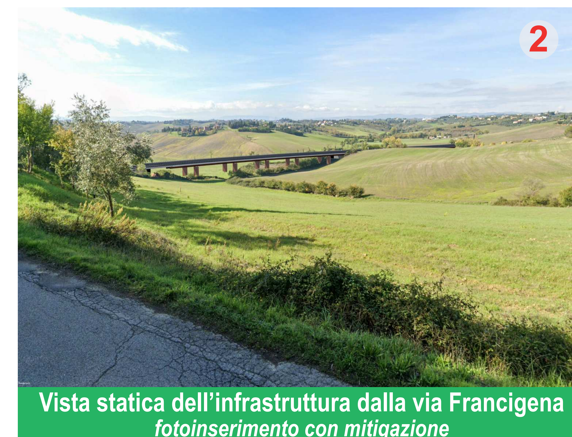
Vista statica dell'infrastruttura dalla via Francigena fotoinserimento con mitigazione