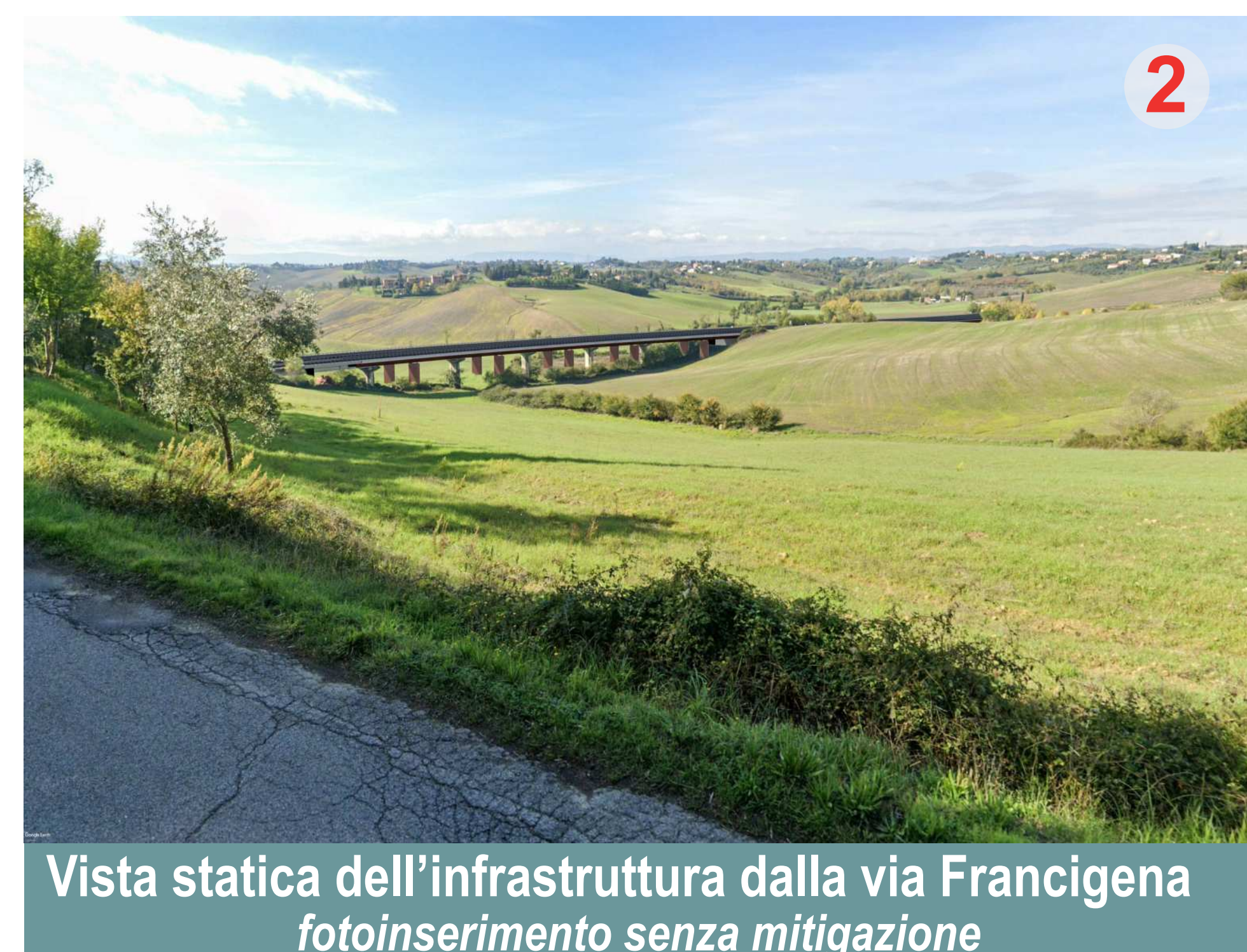
Vista statica dell'infrastruttura dalla via Francigena fotoinserimento senza mitigazione