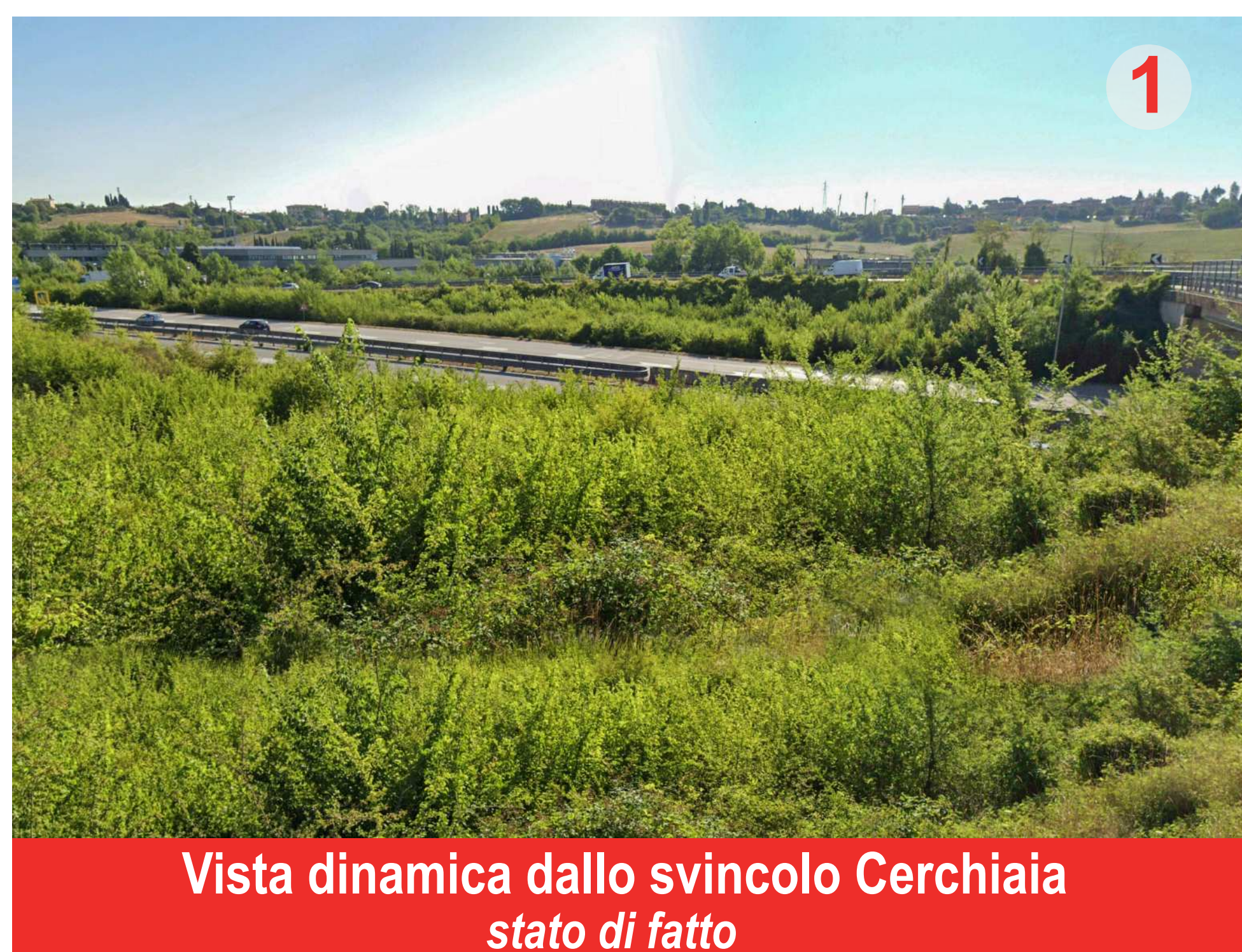
Vista dinamica dallo svincolo Cerchiaia stato di fatto