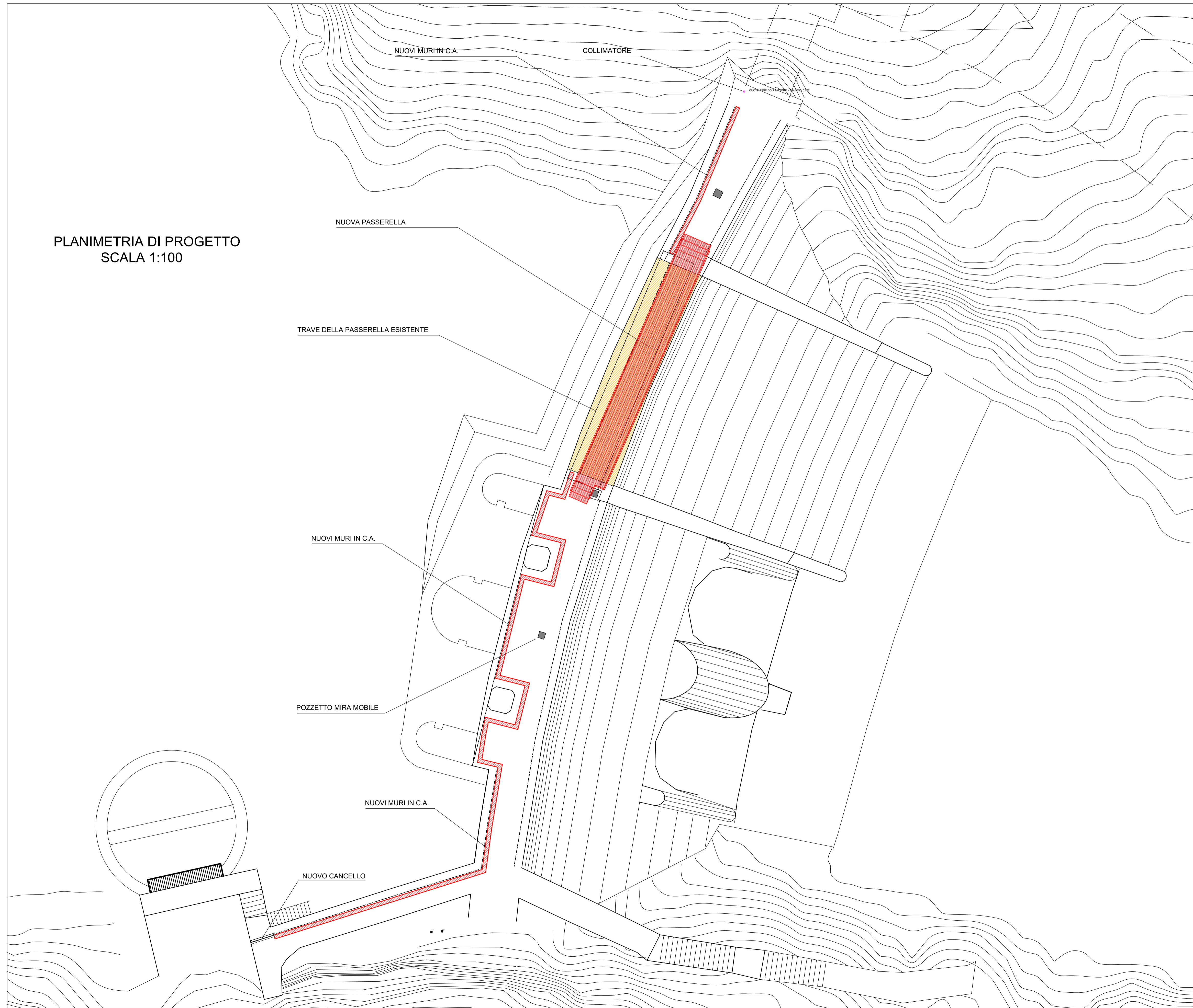
PLANIMETRIA DI PROGETTO SCALA 1:100