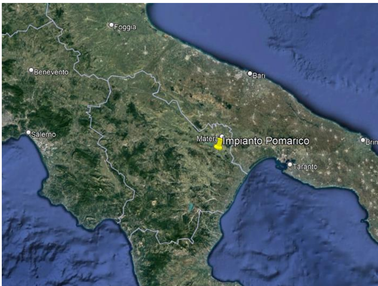
Figura 1 – Inquadramento dell'impianto FV su immagine satellitare

In Figura 1 è riportata la posizione del sito interessato su immagine satellitare, inquadrato nel territorio della Regione Basilicata.